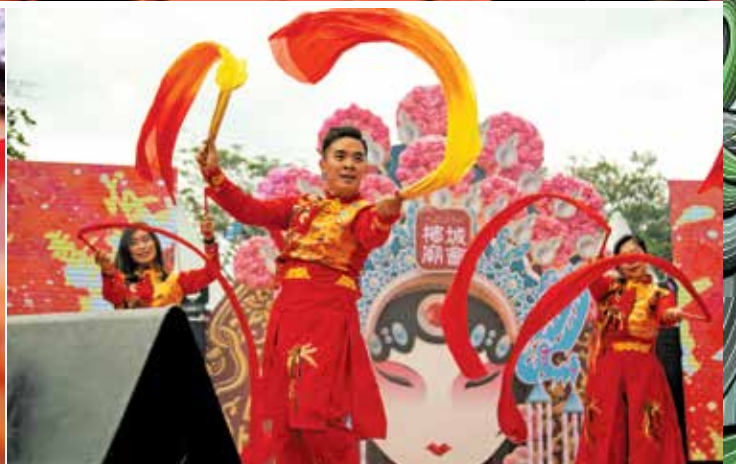
表演者随着热闹的歌乐,挥动着红彩带,现场洋溢着浓浓的新年气氛。