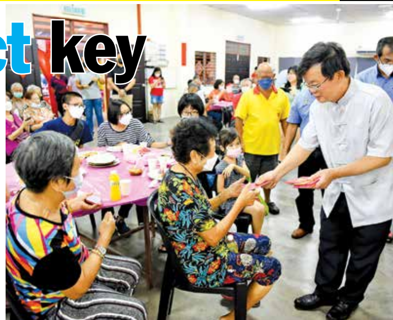
Chow giving an ang pow to a senior citizen at the Bukit Tengah CNY Open House.

“We should reject politicians like them. Yes, there may be disagreement in each other’s beliefs, but it is much more important to have respect for one