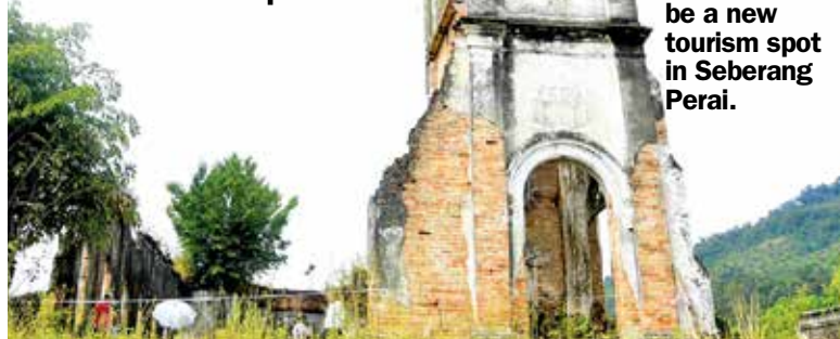
The Church of the Sacred Heart of Jesus, Pagar Tras in Sungai Lembu, Bukit Mertajam is set to be a new tourism spot in Seberang Perai.

SUNGAI Lembu in Bukit Mertajam, which is one of the quiet neighbourhoods in Seberang Perai, is set to draw many domestic and international tourists at year-end following the preservation of the Church of the Sacred Heart of Jesus, Pagar Tras.