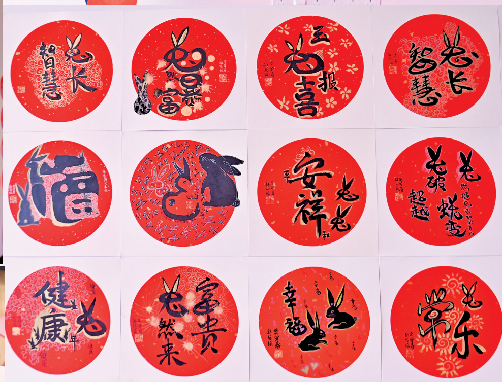
创意春联让您带着新希望，过个快乐年。