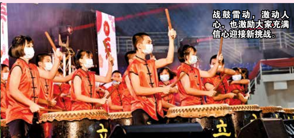
战鼓雷动，激动人心，也激励大家充满信心迎接新挑战。