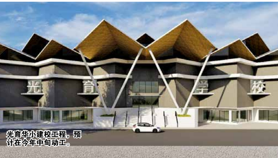
光育华小建校工程，预计在今年中旬动工。