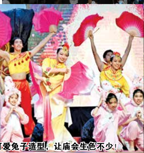
表演者婀娜多姿的舞姿、小孩们的可爱兔子造型,让庙会生色不少!

另外,现场也有超过150个文化及100个美食摊格、各类型活动和舞狮采青等,节目精彩纷呈,虽然间中下雨,但仍无阻众人逛庙会。