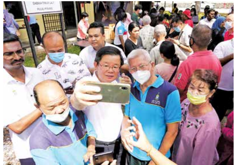
Chow taking a selfie with the people during his Jelajah Penang 2.0 to Bayan Baru.

"Therefore, PBAPP is planning to set up a reservoir (storage tank) at Bukit Penara, Balik Pulau, in the southwest district (to address water issues faced by the EOL areas).