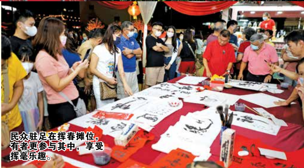
民众驻足在挥春摊位，有者更参与其中，享受挥毫乐趣。