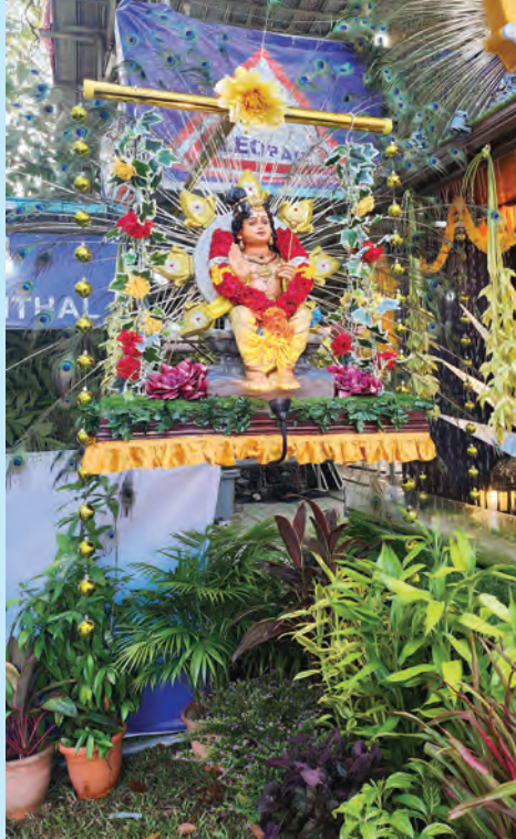
பினாங்கில் கலை கலாச்சாரக் கூறுகளுடன் பந்தல்கள் அலங்கரிக்கப்பட்டன.

மேலும், ஆலய நிர்வாகம் நிர்ணயித்துள்ள விதிமுறைகளைப் பின்பற்றி அமைதியான குழுவில் தைப்பூசத்தை கொண்டாட வேண்டும் என கேட்டுக் கொண்டார்.