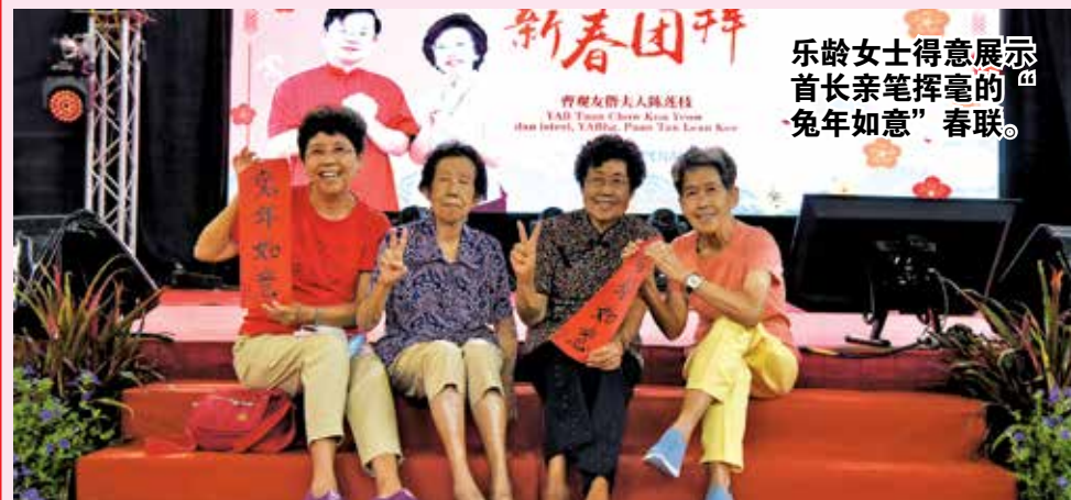
乐龄女士得意展示首长亲笔挥毫的“兔年如意”春联。

他指出，他将以务实的态度领导国家，并确保国家财富能够更公平的分配给人民，让每个人都可以在马来西亚安居乐业。