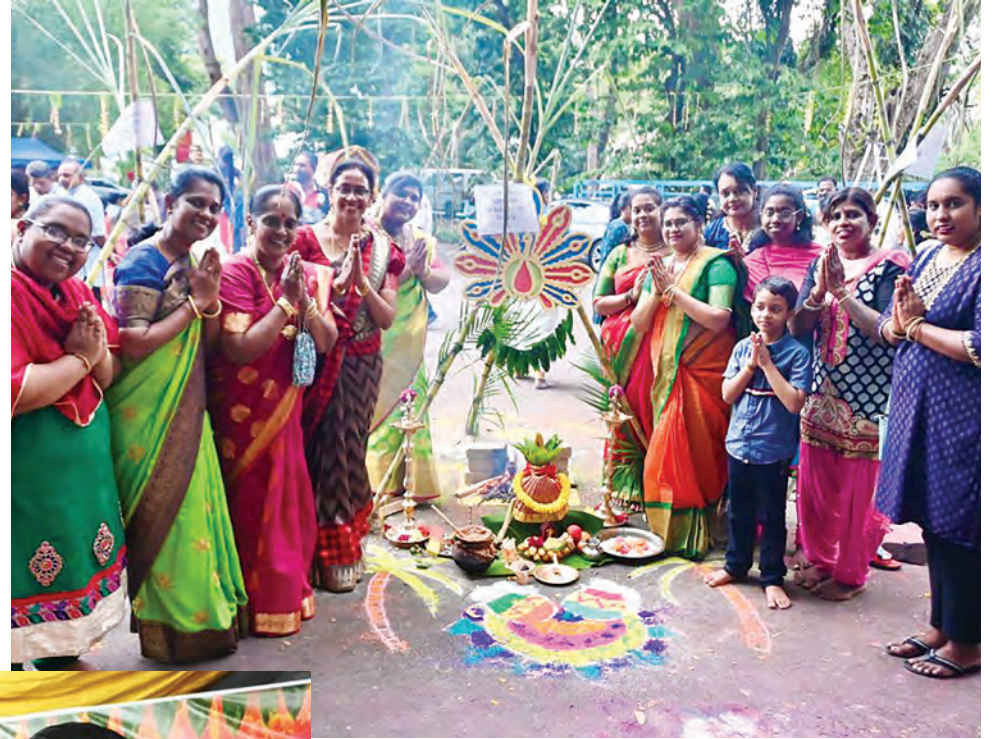
மாநில அளவிலான பொங்கல் போட்டியில் பொது மக்கள் கலந்து கொண்டனர்.

பராமரிக்க வேண்டும், என சாவ் வலியுறுத்தினார்.