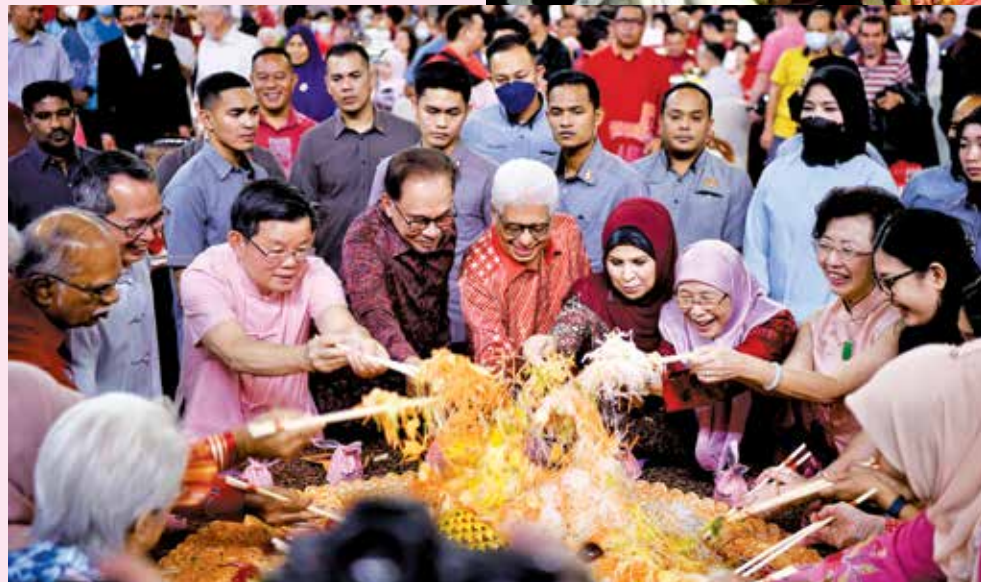
州元首、首相、首长等嘉宾齐捞生，希望马来西亚及槟城在新的一年里国泰民安，风调雨顺。

“我希望在癸卯年，在各领域合作下，能够推动槟城2030愿景向前迈出一大步，并协助在顾及全槟民的前提下，继续聚焦从疫情中全面复苏。”