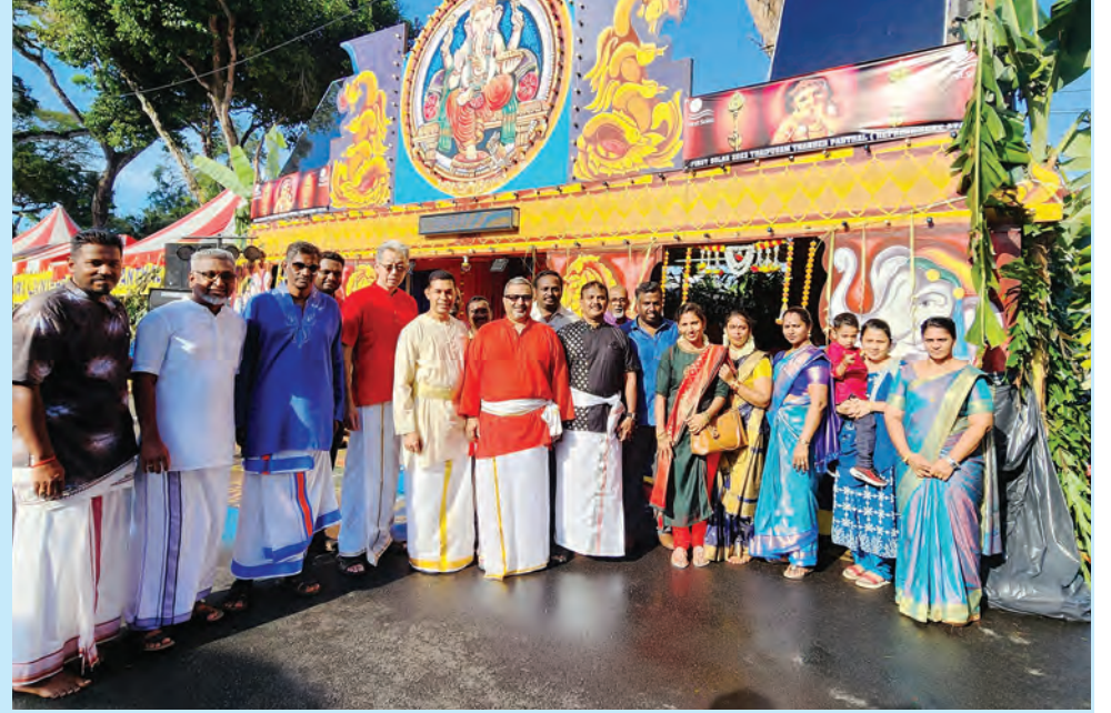
தண்ணீர் பந்தல் ஏற்பாட்டுக் குழுவினர் பாரம்பரிய ஆடையில் இன்முகத்துடன் பக்தர்கள் மற்றும் பார்வையாளர்களை வரவேற்றனர்.

மேலும், ஆலய நிர்வாகம் நிர்ணயித்துள்ள விதிமுறைகளைப் பின்பற்றி அமைதியான குழுவில் தைப்பூசத்தை கொண்டாட வேண்டும் என கேட்டுக் கொண்டார்.