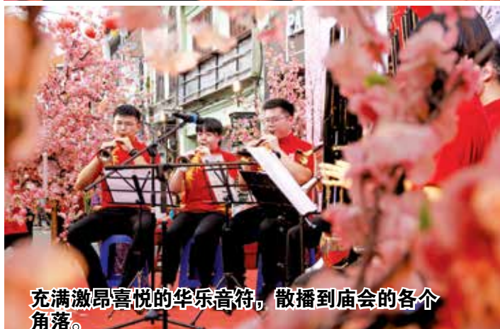
充满激昂喜悦的华乐音符,散播到庙会的各个角落。