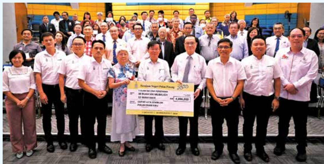
槟州政府拨款409万6000令吉予12所国民型中学、16所教会学校及5所独中。