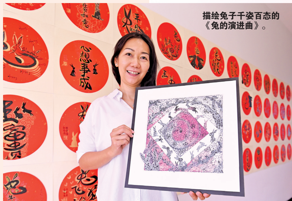
描绘兔子千姿百态的《兔的演进曲》。