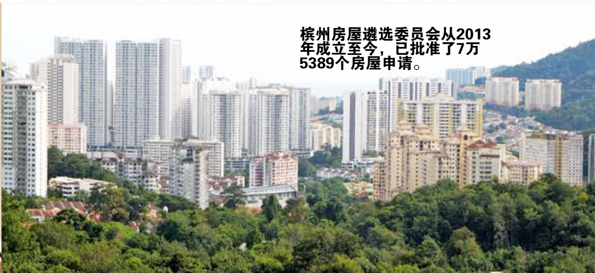
槟州房屋遴选委员会从2013年成立至今，已批准了7万5389个房屋申请。

槟州房屋、地方政府及城乡规划委员会主席佳日星表示，槟州政府有信心在2030年达到兴建22万间可负担房屋的目标，同时他已指示槟州房屋局，着手计划将目标调高至25万间。