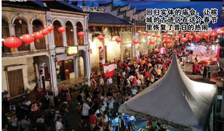
回归实体的庙会,让槟城的古迹区在这个春节里恢复了昔日的热闹。

要舞台设在大伯公街,周边街道设有15个大小舞台,包括广东、福建、客家、海南、潮州等不同籍贯和表演的舞台。