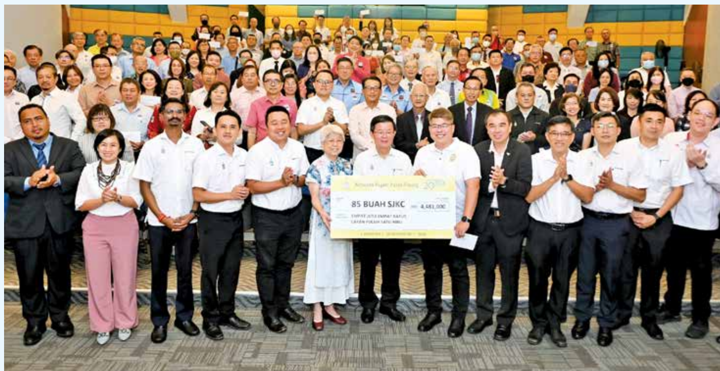
槟州政府每年都制度化拨款，其中448万1000令吉获分配至州内85所华小。