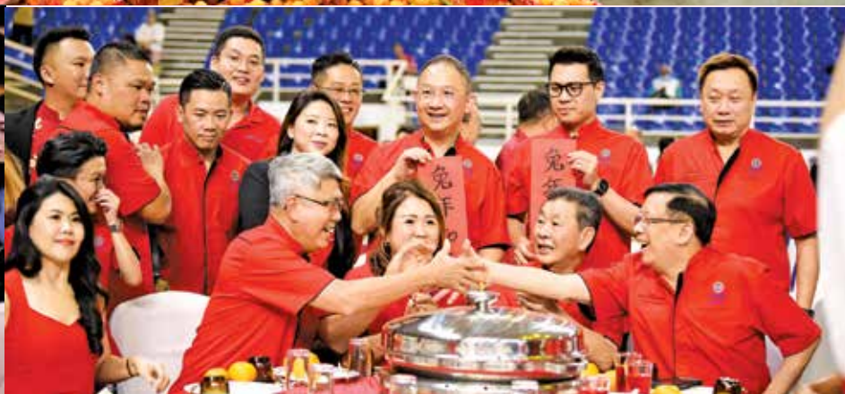
槟州中华总商会成员开心出席团拜，互道恭喜。