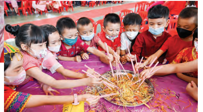
மாணவர்கள் 'Lao Sheng' செய்வதில் ஆர்வமாக ஈடுபட்டனர்.

கம்போங் வால்டோர் சீனப்பள்ளி மாணவர்கள் சீனப் புத்தாண்டு கொண்டாட்டத்தில் கலந்து கொண்டனர்.