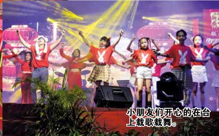
小朋友们开心的在台上载歌载舞。