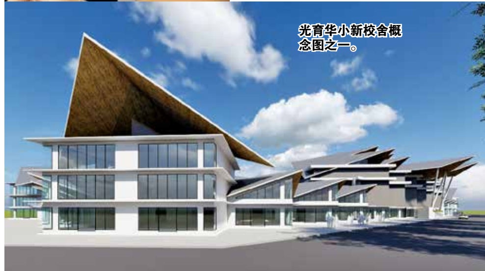
光育华小新校舍概念图之一。

欲知更多有关光育华校建校新进展，可到光育华小新校舍监委会面子书浏览： https://www.facebook.com/BatuKawan.KuangYu