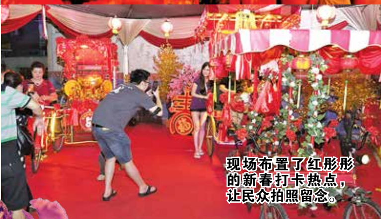
现场布置了红彤彤的新春打卡热点，让民众拍照留念。

上述一连两天的活动，是在北海新芭观音亭斗母宫举行。现场除了丰富的舞台节目外，更邀来多个单位共襄盛举，在现场提供文化、艺术及美食等，场面热爆。