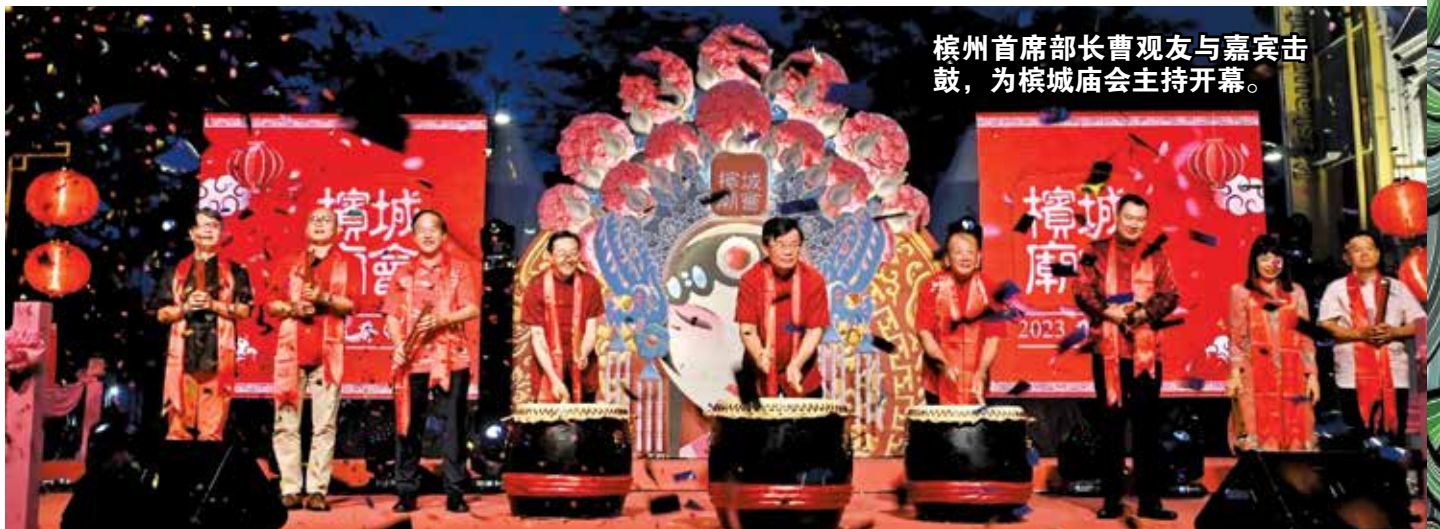
槟州首席部长曹观友与嘉宾击鼓,为槟城庙会主持开幕。

主题为“从心出发”的“2023癸卯年槟城庙会”于大年初七下午4时至晚上11时在乔治市古迹区举行,主