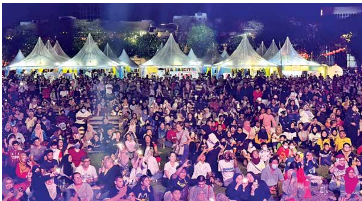
A huge crowd thronging the carnival at the Esplanade.

Some of them also took the opportunity to take pictures with Chow while he was distributing the mandarin oranges.