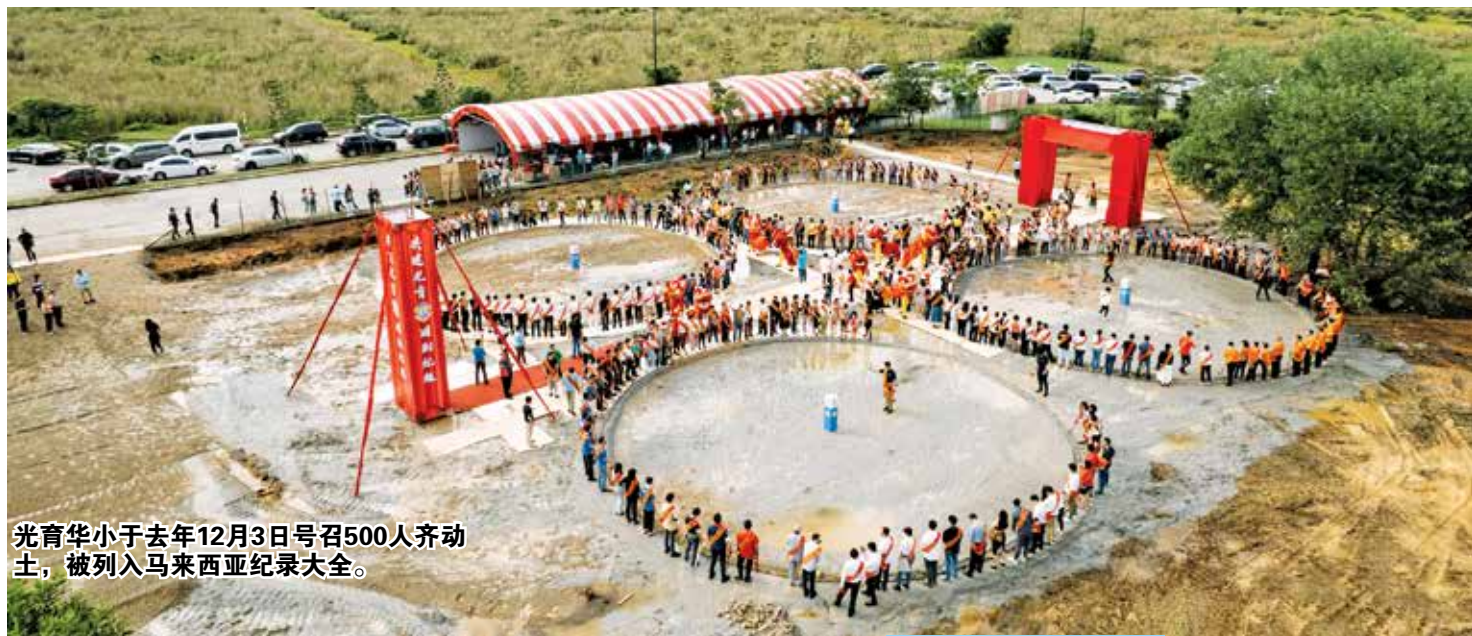
光育华小于去年12月3日号召500人齐动土，被列入马来西亚纪录大全。

他指出，在发展新城鎮的申请规划准证上，一般都会列入国中或国小为其中发展项目，甚少会看到有全新建造的华小出现。