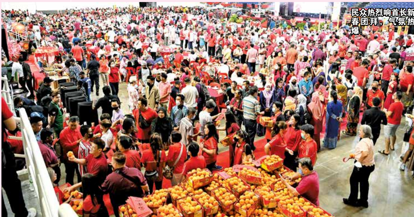
民众热烈响首长新春团拜，气氛火爆！

他也说，今年是癸卯“水兔”年，顾名思义，今年将是敏捷、智慧、迅速及充满活力的一年，他希望今年能够汲取上述元素，协助槟州更上一层楼，在国际扮演更重要角色。