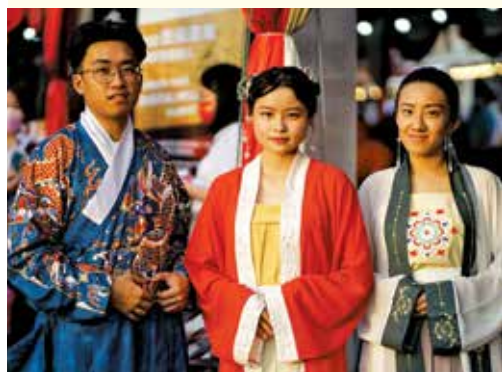
北海新春庙会中，也能体验穿传统汉服。