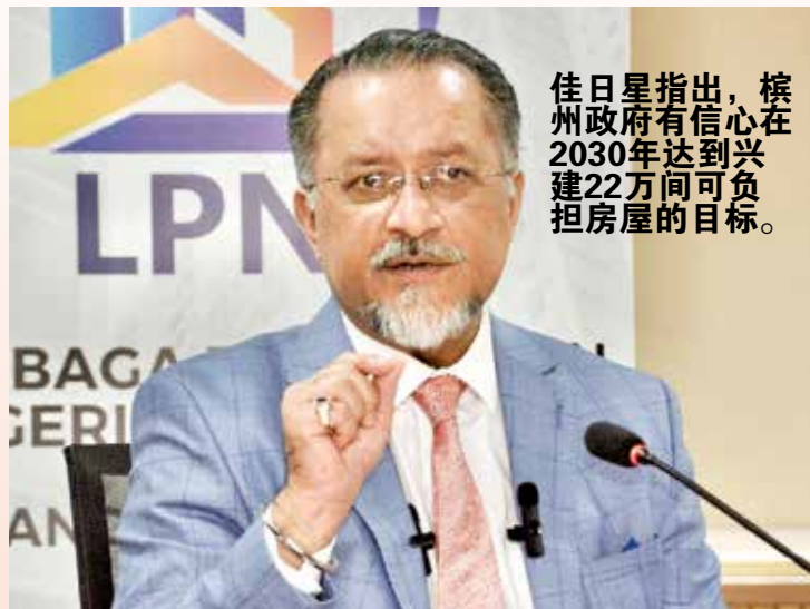
佳日星指出，槟州政府有信心在2030年达到兴建22万间可负担房屋的目标。