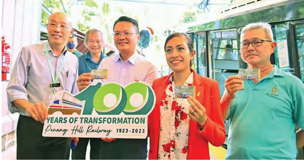
ஆட்சிக்குழு உறுப்பினர் இயோ சூன் ஹின், நாடாளுமன்ற உறுப்பினர் சியர்லீனா அப்துல் ரஷித் (நடுவில்) புக்கிட் பெண்டேரா சிறப்பு விரைவுப் பாதை நுழைவுக் கட்டண அட்டையைக் காண்பிக்கின்றனர் (உடன் PHC இன் பொது மேலாளர் டத்தோ சியோக் லாய் லெங்).