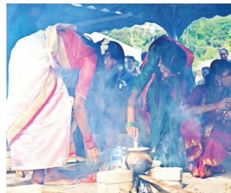
மகளிர் பொங்கல் வைப்பதைப் படத்தில் காணலாம்.