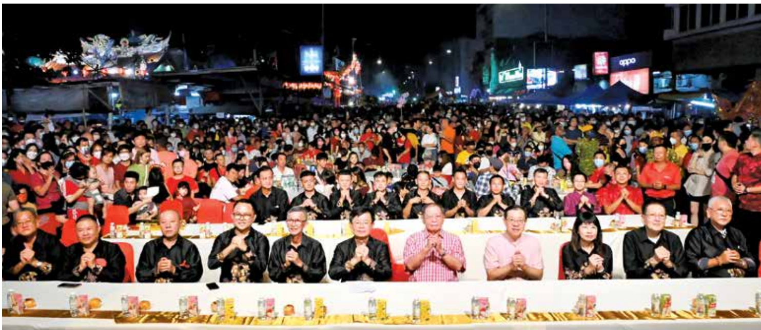
姓周桥新春文化庆典暨天公诞仪式全体嘉宾，向民众拜年。

“我回想起最后一次站在这个舞台向大家致词，也就是疫情前最后一次所主办的天公诞庆典仪式，当时我在会上宣布拨款20万令吉协助姓周桥朝元宫进行修复工程。今天再度回到这里，看到姓周桥朝元宫已修复完毕，也已经再度