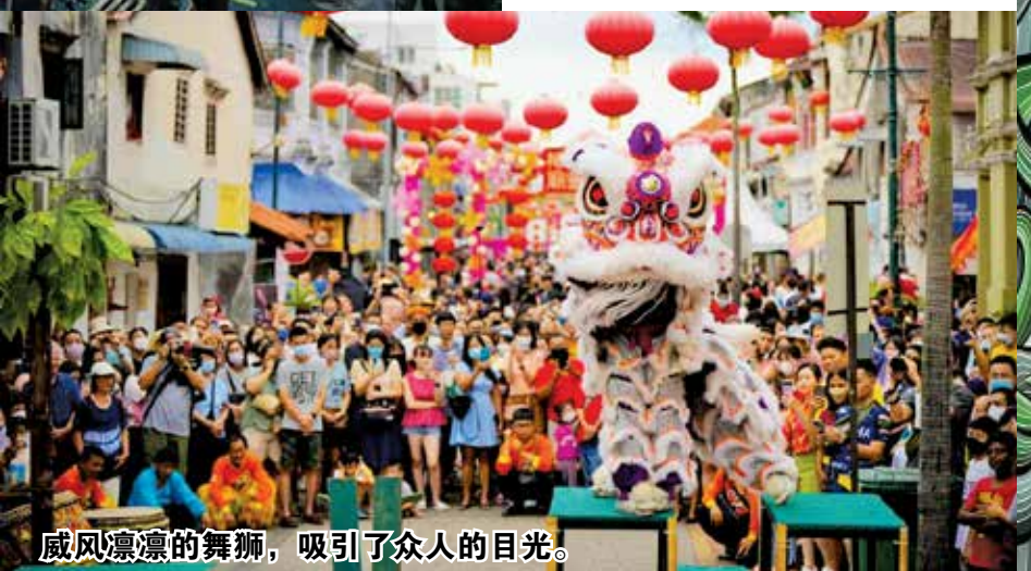
威风凛凛的舞狮,吸引了众人的目光。