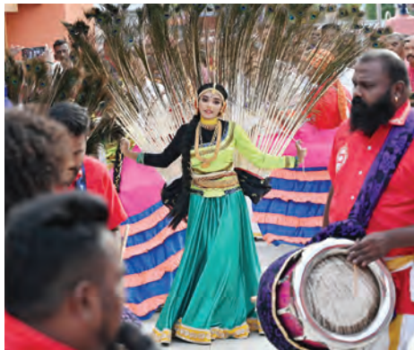
பொங்கல் கொண்டாட்டத்தில் மயிலாட்டம் இடம்பெற்றது.

வழிகாட்டியாகவும், அமைதி மற்றும் நல்லிணக்கத்தை வலுப்படுத்துவதற்கான முயற்சிகளை மேலும் அதிகரிக்கும்," என பிளாங்கு மாநில முதல்வரும் பத்து காவான் நாடாளுமன்ற உறுப்பினருமான மேதகு சாவ் கொன் இயோவ் ஸ்ரீ மங்களநாயகி அம்மன் ஆலயத்தில் நடைபெற்ற பொங்கல் கொண்டாட்டத்தை தொடங்கி வைத்த பின்னர் தமதுரையில் இவ்வாறு