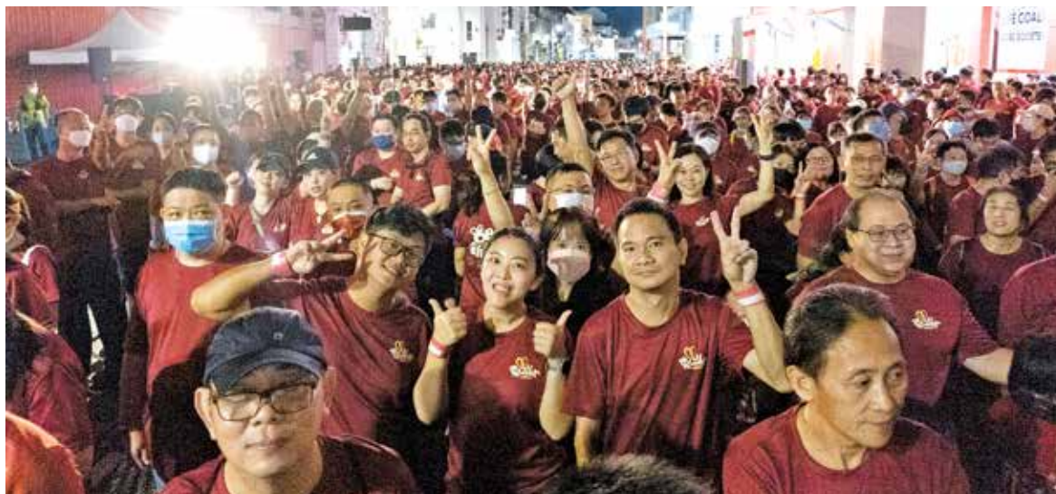
These participants are all gung-ho to join the run.

Event, for having successfully gathered 2,500 participants for this event.