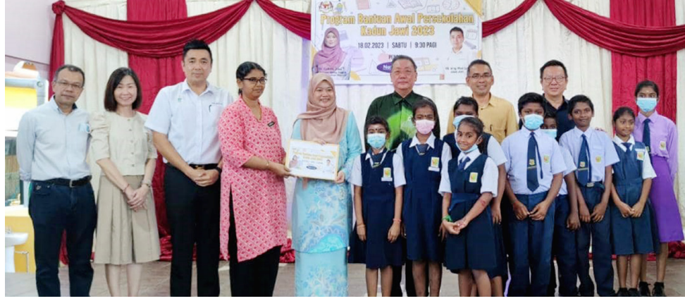
பள்ளி உபகரணங்களுக்கானப் பற்றுச்சீட்டுப் பெற்றுக் கொண்ட மாணவர்கள் மற்றும் ஆசிரியர்களுடன் ஜாவி சட்டமன்ற உறுப்பினர் இங் மோய் லாய் மற்றும் கல்வி அமைச்சர் ஃபட்லினா சிடேக் (நடுவில்).

சுமையைக் குறைக்க முடிகிறது," என்று சட்டமன்ற உறுப்பினர் இங் மோய் லாய் தெரிவித்தார்.