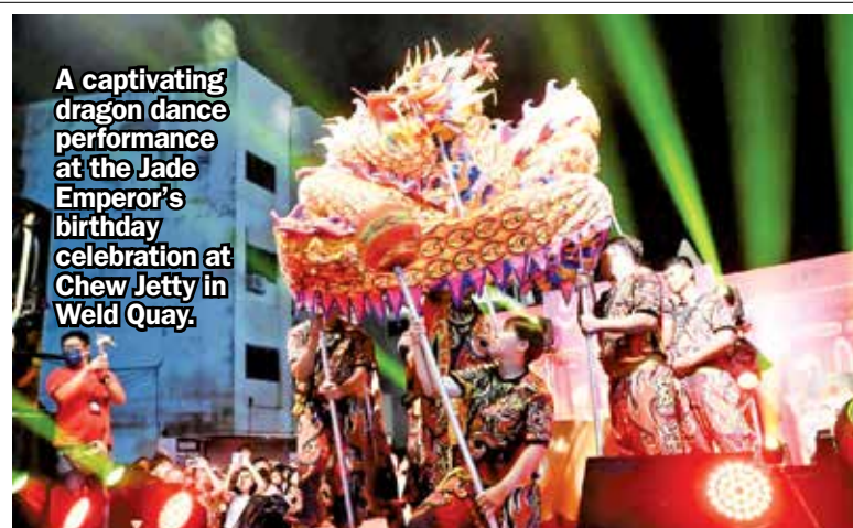
A captivating dragon dance performance at the Jade Emperor's birthday celebration at Chew Jetty in Weld Quay.

“With this achievement, I believe that as long as all parties, including government agencies, private enterprises, non-governmental organisations and people from all walks of life, are willing to join forces and cooperate, no matter how difficult or great the ambition is, it can be realised together.”