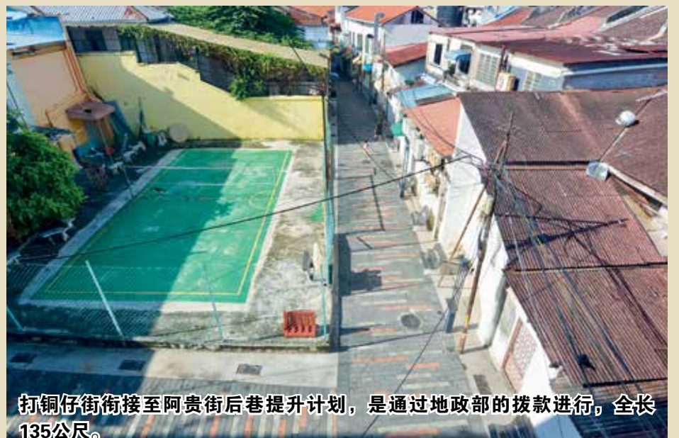
打铜仔街衔接至阿贵街后巷提升计划，是通过地政部的拨款进行，全长135公尺。

他说，虽然后巷还未提升前就有很多游客到访，但提升后成为了打卡地点，也吸引更多人前来，不过每当早上市政厅员工打扫清洁后，到了下午许多游客到访后又会变成肮脏，因此希望民众可以不要乱丢垃圾，最重要是保持环境清洁。