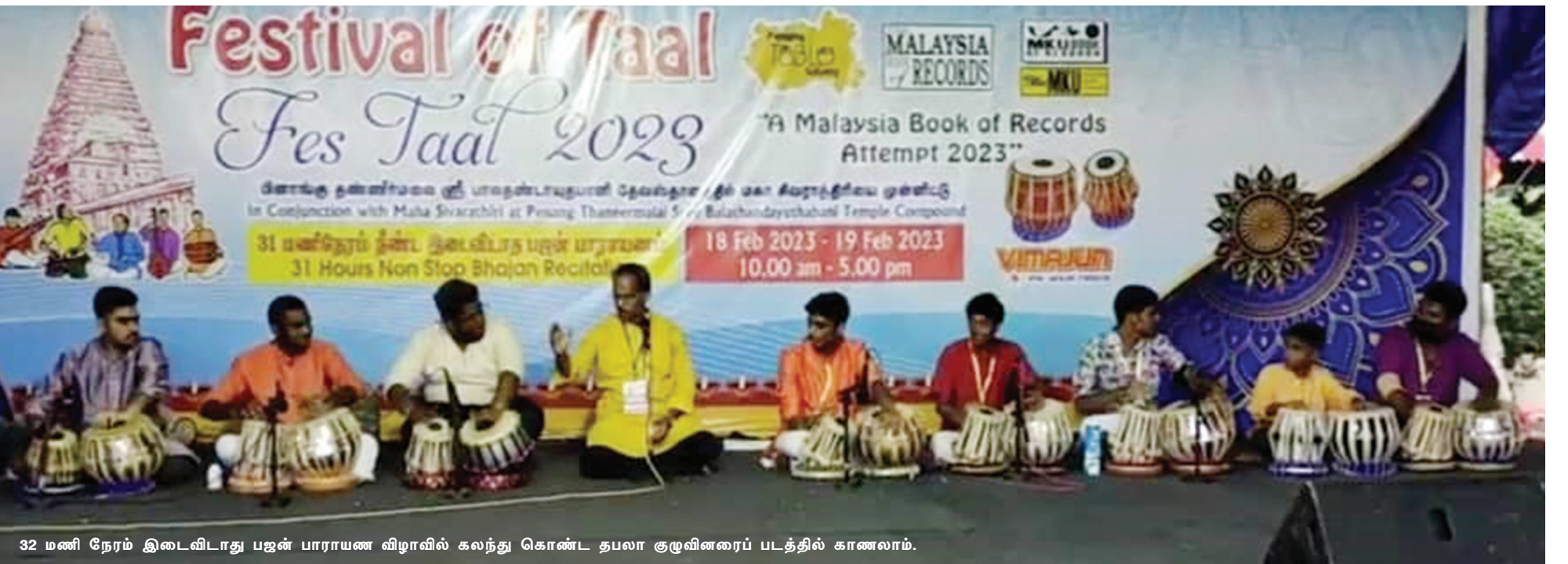
32 மணி நேரம் இடைவிடாது பஜன் பாராயண விழாவில் கலந்து கொண்ட தபலா குழுவினரைப் படத்தில் காணலாம்.

பினாங்கு மாநிலத்தில் ஆறு தபலா பயிற்சி வகுப்புகள் நடத்தப்படுகின்றன.