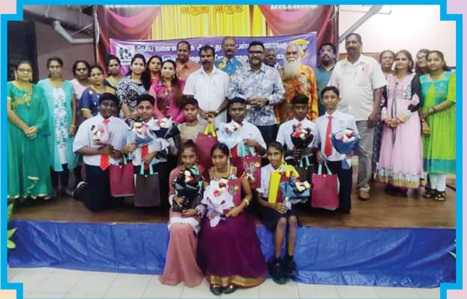
சுங்கை ஆரா தமிழ்ப்பள்ளியில் 'திறமைக்கோர் அங்கீகாரம்' எனும் பரிசளிப்பு விழாவில் பரிசுகள் பெற்ற மாணவர்களுடன் பாகான் டாலாம் சட்டமன்ற உறுப்பினர் சத்தீஸ் முனியாண்டி(நடுவில்), பள்ளி ஆசிரியர்கள் மற்றும் பிரமுகர்கள் குழுப்படம் எடுத்து கொண்டனர்.