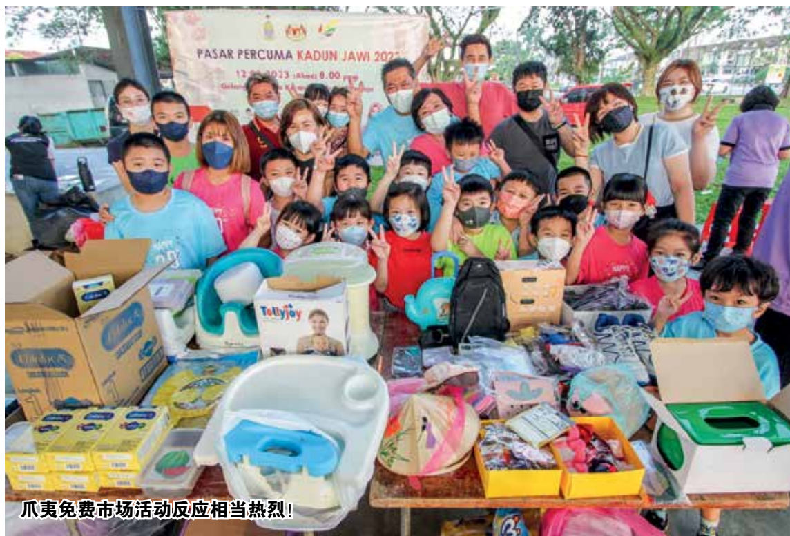
爪夷免费市场活动反应相当热烈！