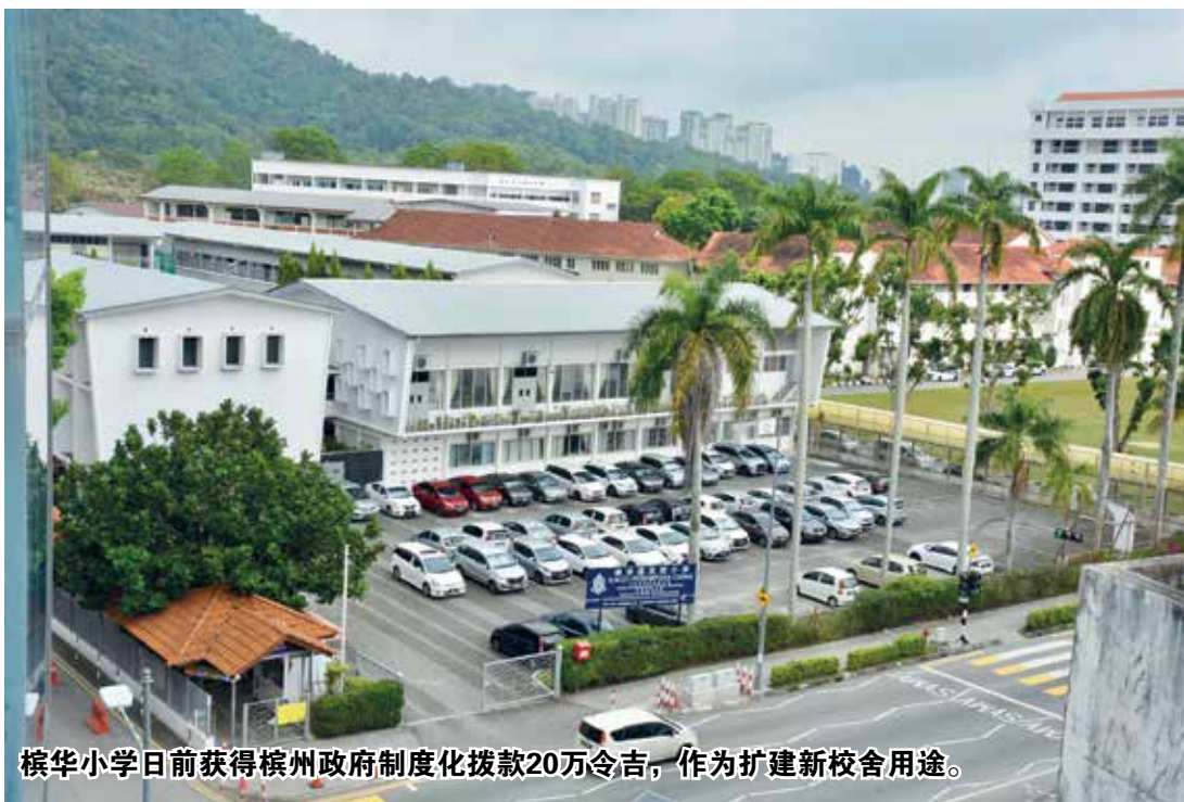
槟华小学日前获得槟州政府制度化拨款20万令吉，作为扩建新校舍用途。