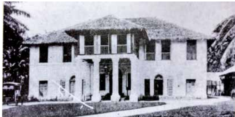
A recopied photo of the Pinang Club building, back in the old days.

■ Story by Christopher Tan