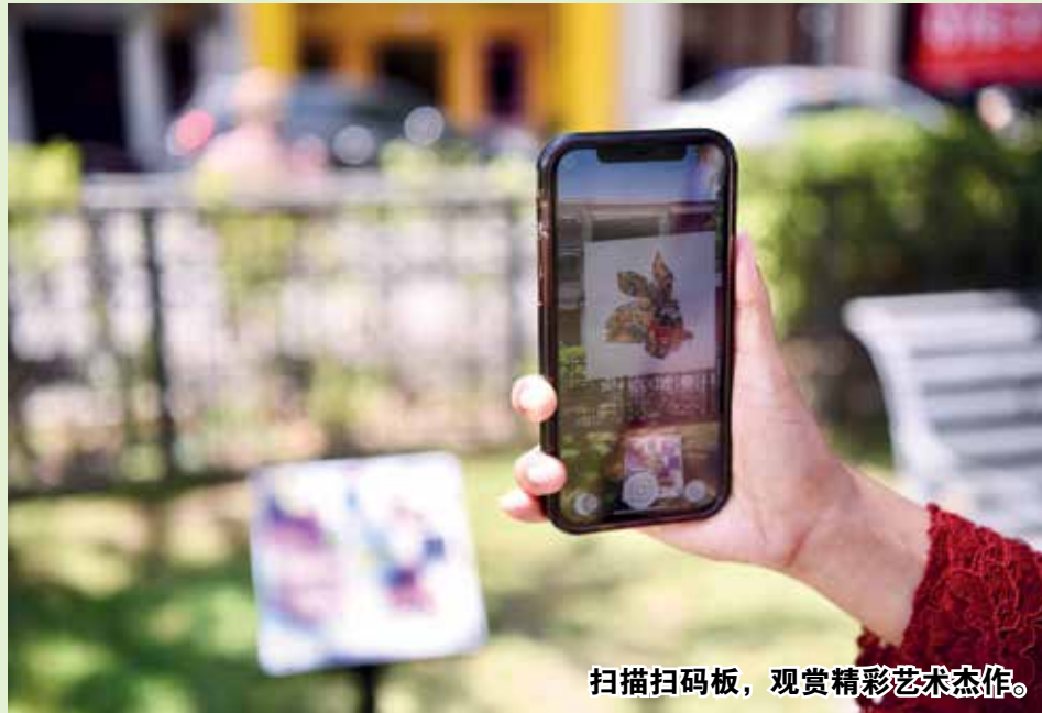
扫描扫码板，观赏精彩艺术杰作。

“打铜仔街公园现在也是一个露天画廊了，游客可以在这里享受将传统实体艺术装置与尖端数码技术相结合