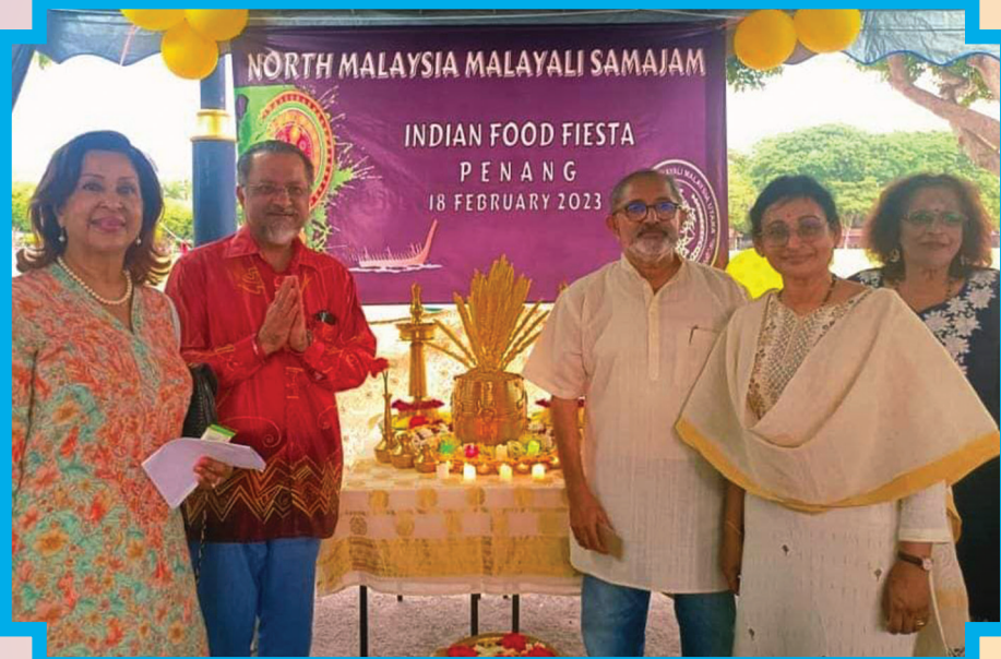
ஆட்சிக்குழு உறுப்பினர் ஜெகதிப் சிங் டியோ இந்திய உணவு விழாவில் வட மலேசிய மலையாளி சங்கத்தின் கூடாரத்திற்கு வருகையளித்தார்.