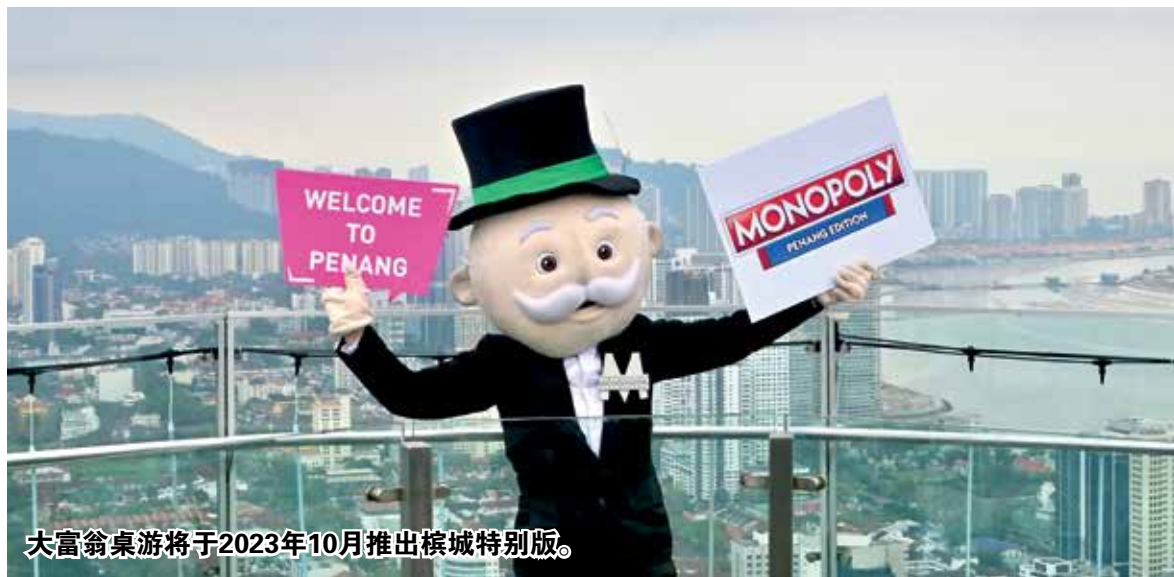
大富翁桌游将于2023年10月推出槟城特别版。