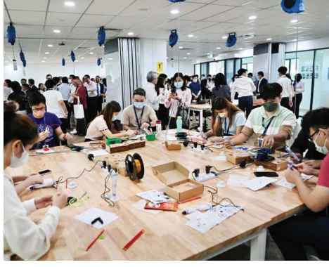
ViTrox கல்லூரியில் பயிலும் மாணவர்களைப் படத்தில் காணலாம்.