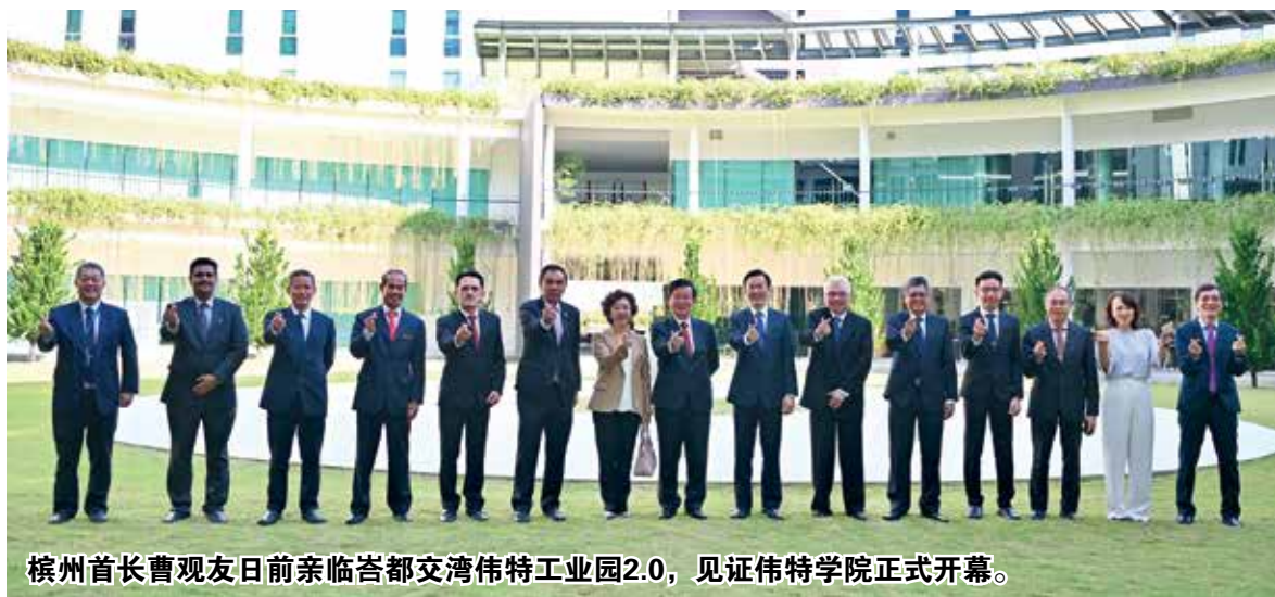
槟州首长曹观友日前亲临峇都交湾伟特工业园2.0,见证伟特学院正式开幕。

他指出,为了配合槟州工业领域迅速发展,槟州政府也推出多项政策,来扩展槟州的人才库,以冀能提供更多相关领