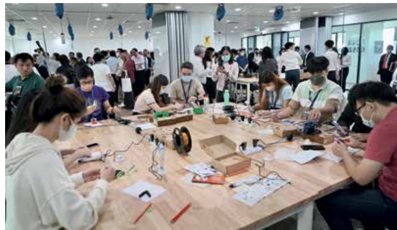
目前伟特学院可容纳逾200名学生,未来将开放更多领域专业文凭,让学子选修。