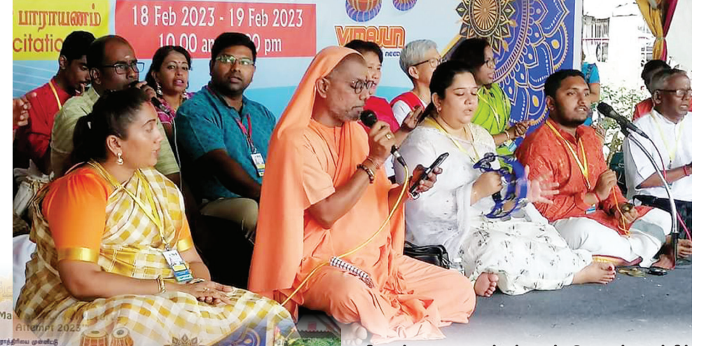
பினாங்கு தபலா சங்கத்துடன் இணைந்து பக்திப் பாடல் கலைஞர்களும் கலந்து கொண்டனர்.