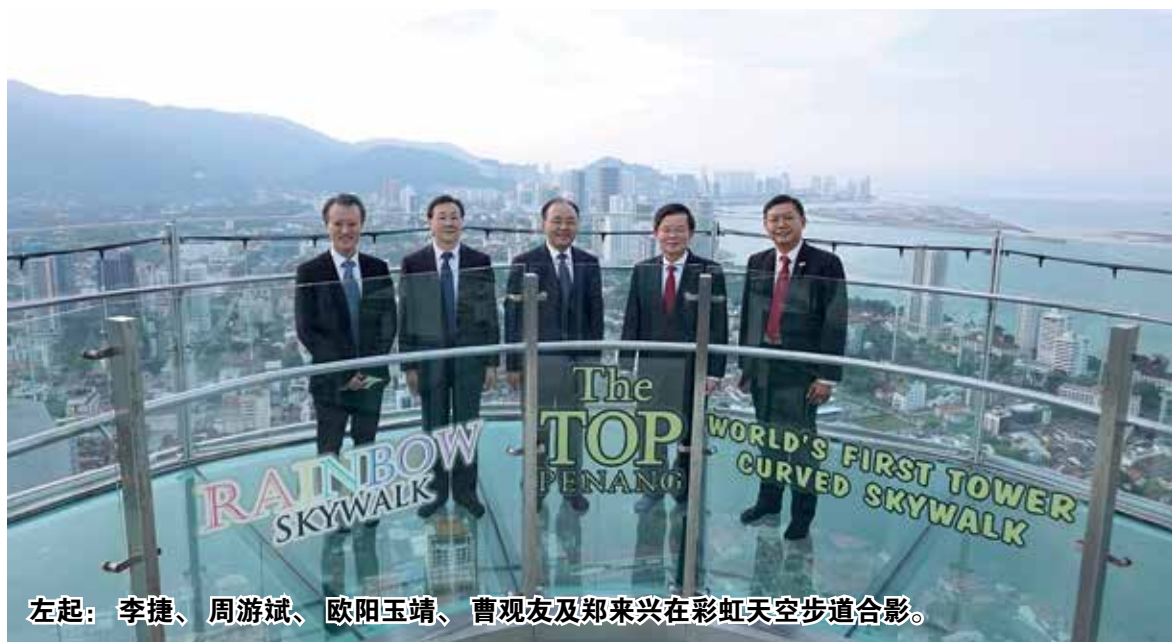
左起：李捷、周游斌、欧阳玉靖、曹观友及郑来兴在彩虹天空步道合影。

中国驻马大使欧阳玉靖表示，马来西亚拥有一定的投资吸引力，自从马来西亚在去年4月1日国境开放后，中国驻马大使馆接收了不少中国企业的热络咨询，以探讨在马来西亚投资的可能性。