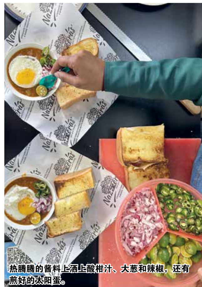
热腾腾的酱料上洒上酸柑汁、大葱和辣椒，还有煎好的太阳蛋。

的大葱酱、意大利红肠（Pepperoni）还有芝士，味道也因此提升到另一个层次。”