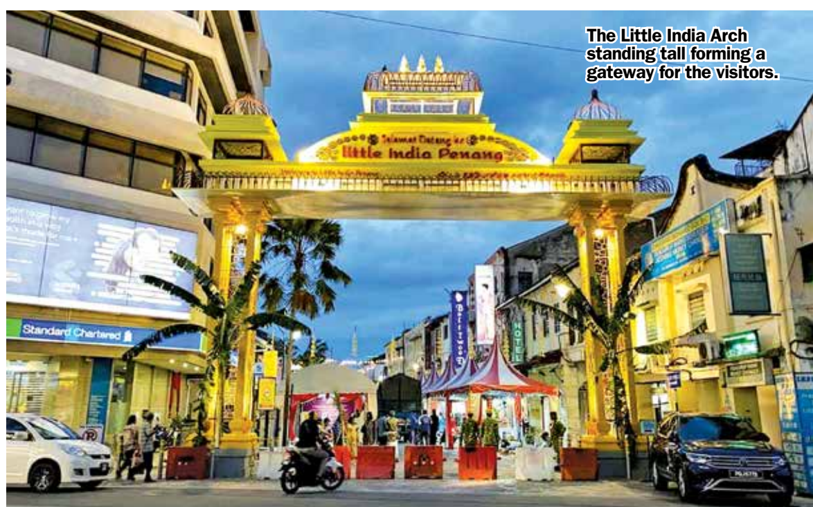
The Little India Arch standing tall forming a gateway for the visitors.

"The design of the arch was done by the Malaysian Indian Chamber of Commerce and Industry (MICCI) Penang together