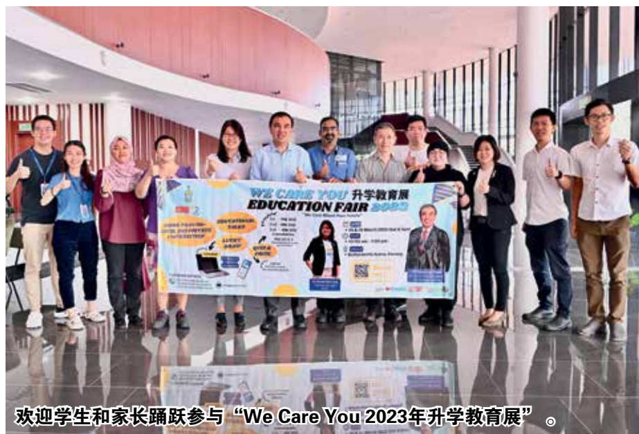
欢迎学生和家踊跃参与“我们关心你2023年升学教育展”。

的角色,因此我呼吁父母可陪同孩子一同前来参展,听取专业人士对升学途径的意见,了解孩子内心想