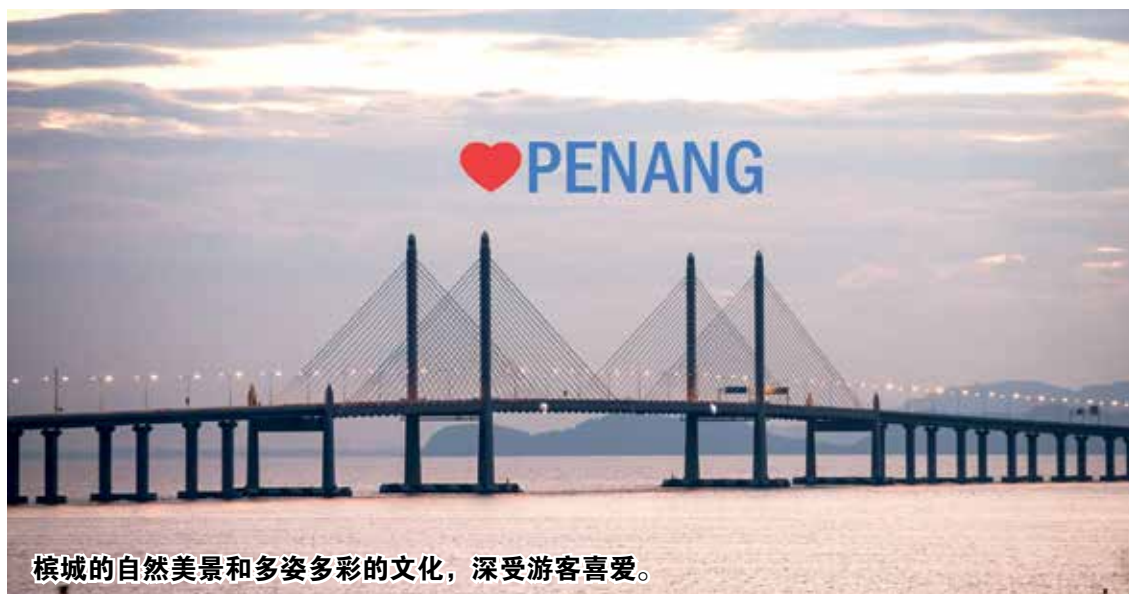
槟城的自然美景和多姿多彩的文化，深受游客喜爱。