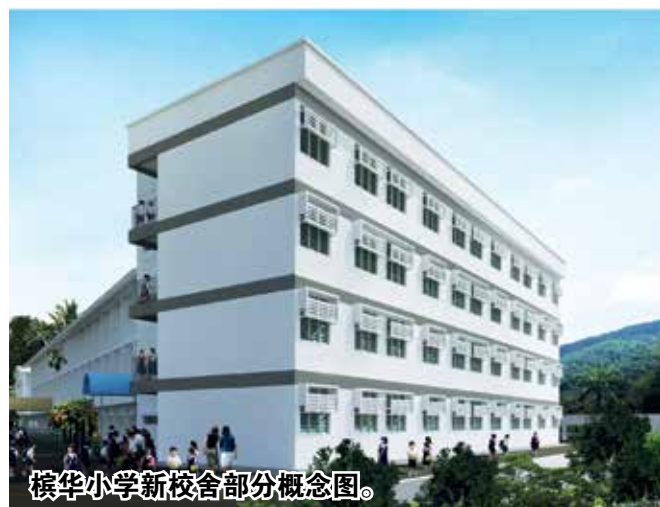
槟华小学新校舍部分概念图。