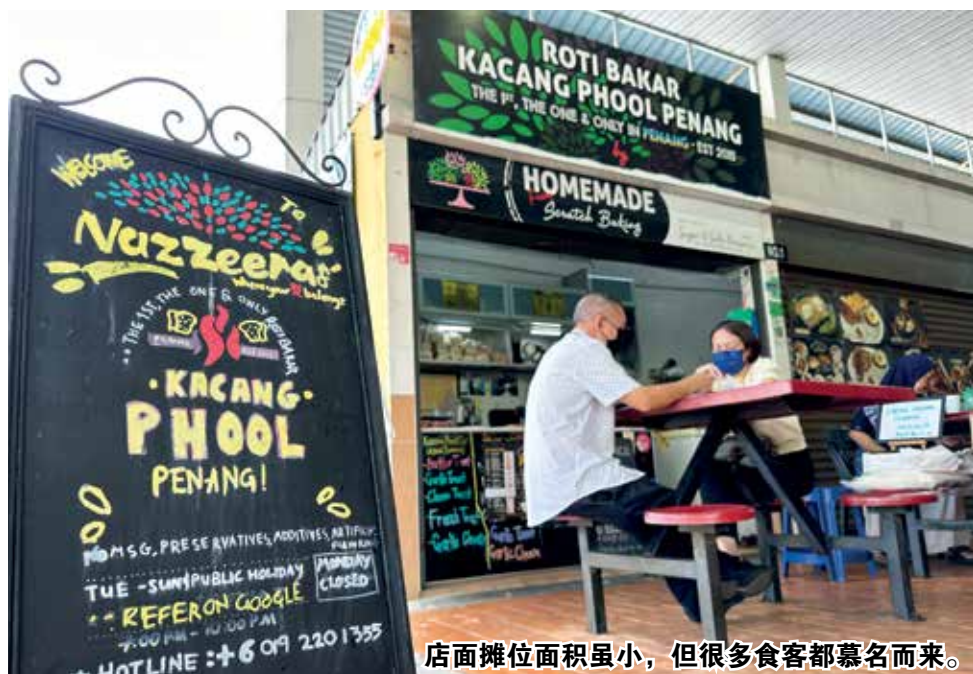
店面摊位面积虽小，但很多食客都慕名而来。