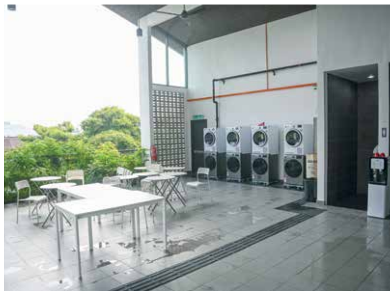
RUANG dobi yang disediakan.