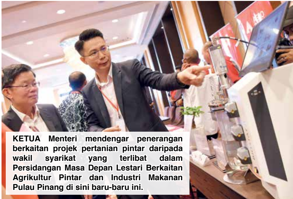
KETUA Menteri mendengar penerangan berkaitan projek pertanian pintar daripada wakil syarikat yang terlibat dalam Persidangan Masa Depan Lestari Berkaitan Agrikultur Pintar dan Industri Makanan Pulau Pinang di sini baru-baru ini.

“Tumpuan pelaburan Kerajaan Negeri melalui InvestPenang (IP) ini sudah tentu dalam sektor E&E (elektrik dan elektronik), industri teknologi dan perkhidmatan perniagaan sejagat, (namun) saya percaya telah tiba masanya untuk memperkukuhkan industri pengeluaran