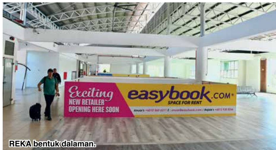
REKA bentuk dalaman.