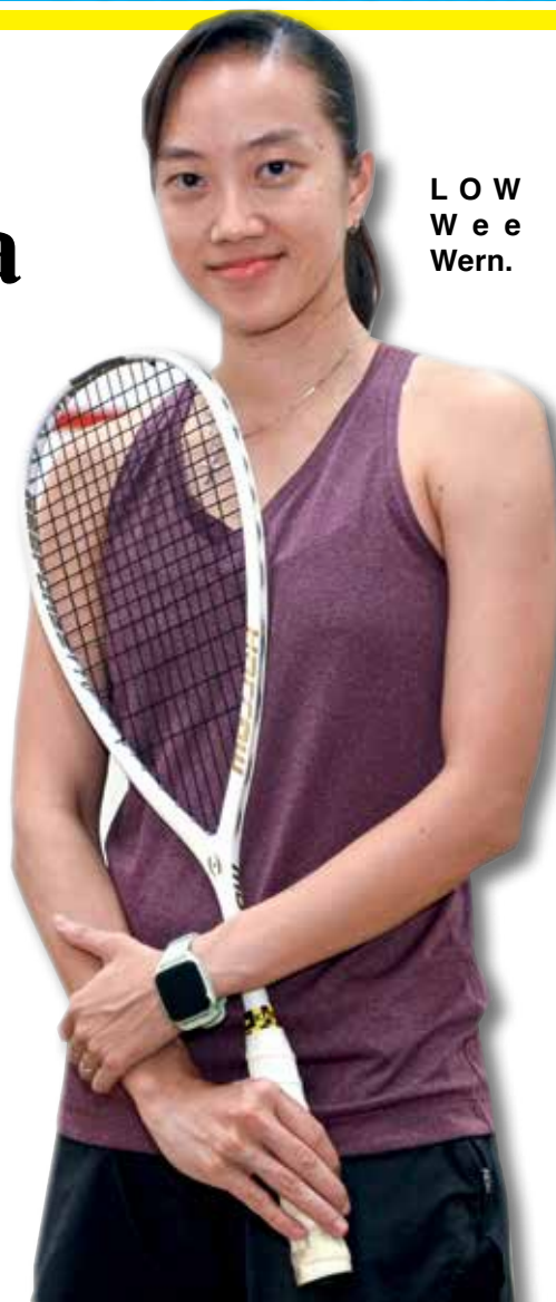
LOW Wee Wern.

TERRACES CONDOMINIUM BUKIT JAMBUL · PENANG