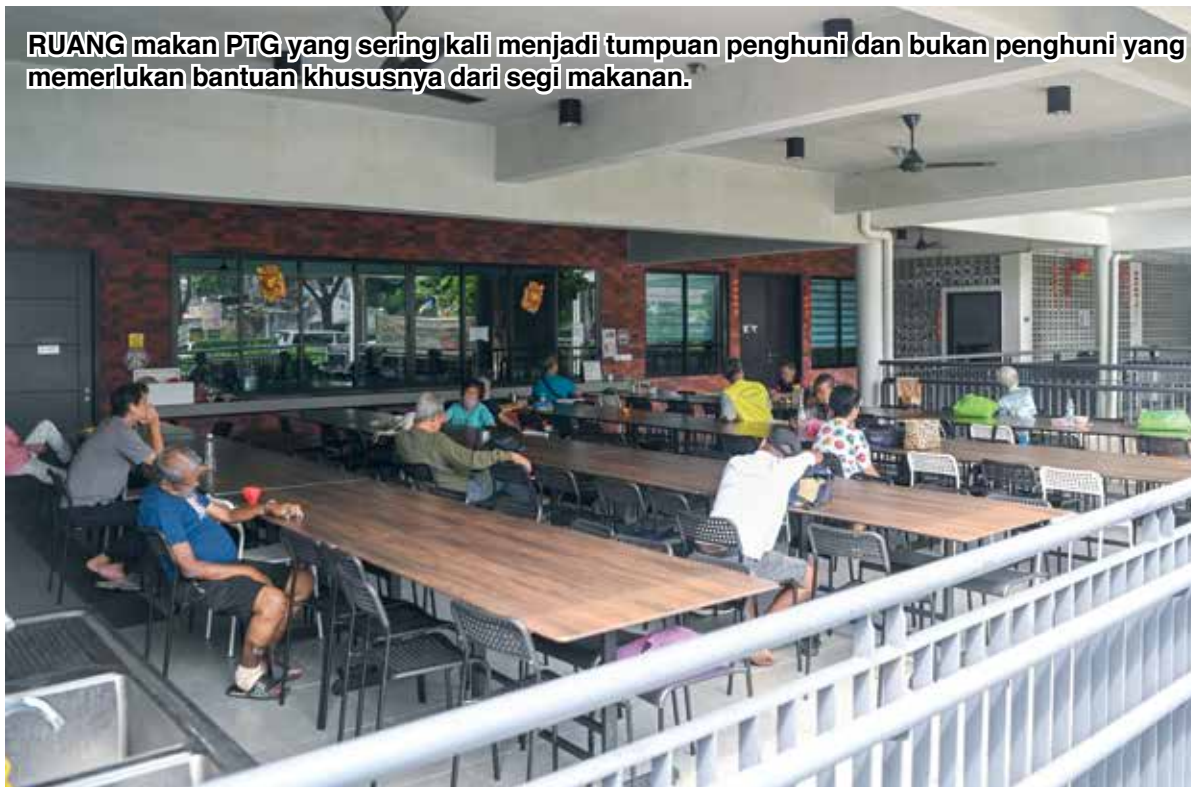
RUANG makan PTG yang seringkali menjadi tumpuan penghuni dan bukan penghuni yang memerlukan bantuan khususnya dari segi makanan.

Bagi yang ingin menyampaikan bantuan atau sebarang jalinan kerjasama, boleh hubungi PTG menerusi WhatsApp di talian 014 - 790 4744.