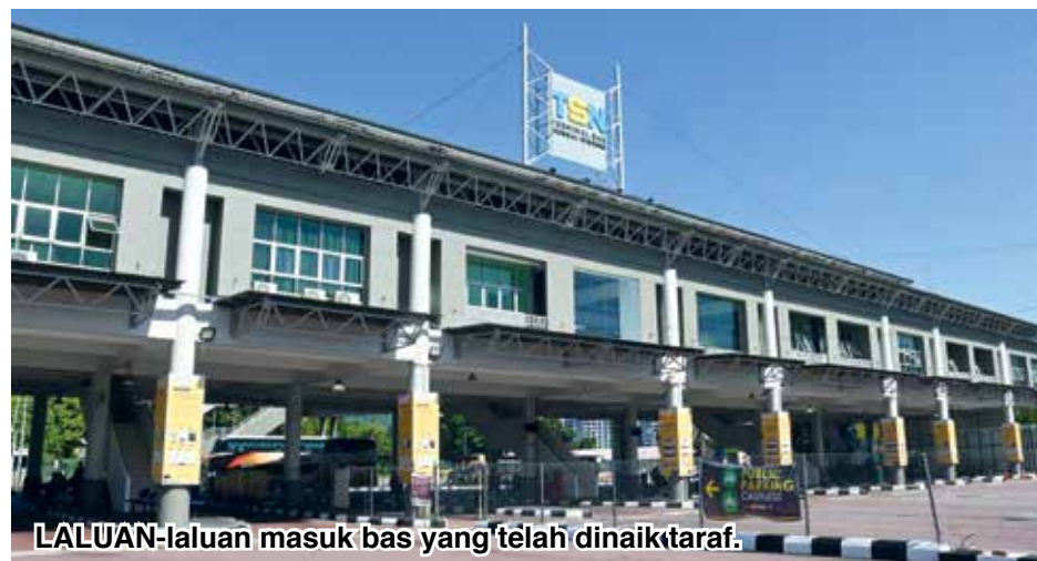
LALUAN-laluan masuk bas yang telah dinaiktaraf.