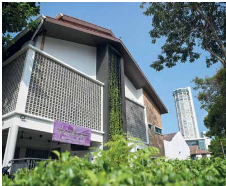
PTG merupakan inisiatif Kerajaan Negeri dalam menyediakan pusat perlindungan bagi membantu golongan gelandangan kembali ke masyarakat sebagai insan normal.