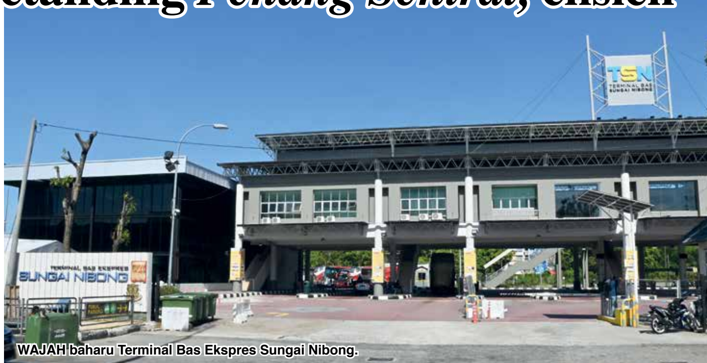
WAJAH baharu Terminal Bas Ekspres Sungai Nibong.

“Kini, pelanggan hanya perlu menaiki lif atau eskalator yang tersedia di bangunan baharu, kemudian naik ke tingkat atas, setelah daftar masuk tiket di kaunter, mereka perlu berjalan ke