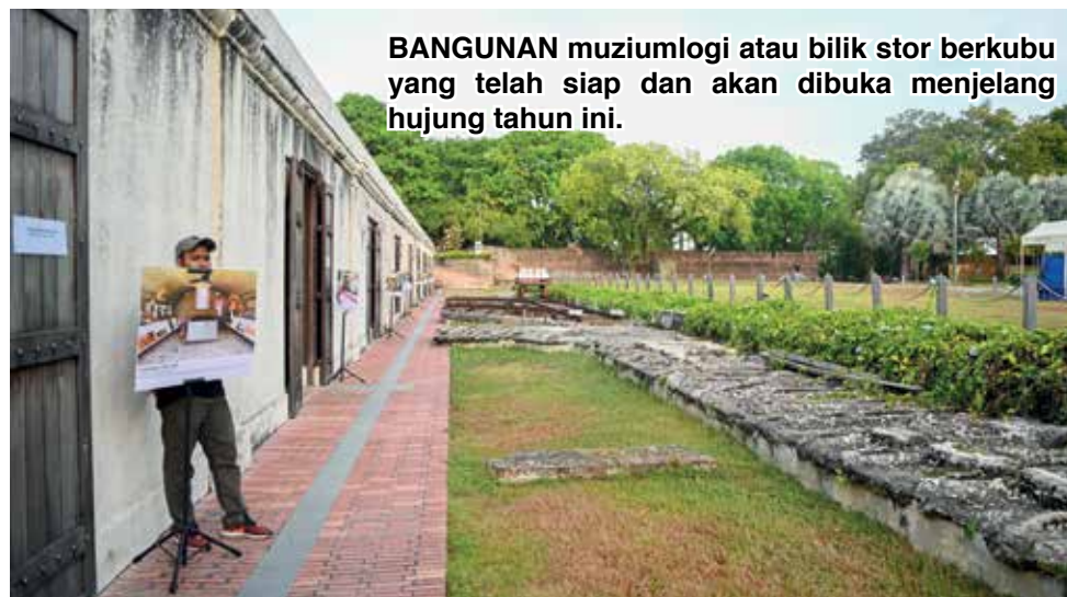
BANGUNAN muziumlogi atau bilik stor berkubu yang telah siap dan akan dibuka menjelang hujung tahun ini.

dan konservasi di sekitar kubu berparit tersebut, sementara RM10 juta lagi akan dibelanjakan bagi menyiapkan projek berkaitan.