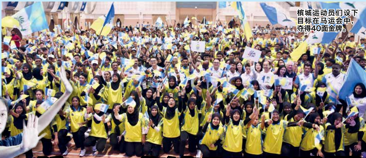
槟城运动员们设下目标在马运会中，夺得40面金牌。