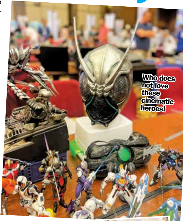
Who does not love these cinematic heroes!

"Malaysia International Miniature Hobby Show & Competition has long been Southeast Asia's largest annual miniature model exhibition, known for its repu-