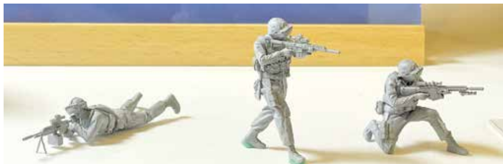
These miniature soldiers were one of the highlights of the show.

and competitions highlight artists' creativity and skills, which in turn support industries like tourism, education, and cultural exchange.