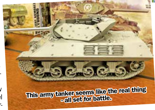
This army tanker seems like the real thing - all set for battle.