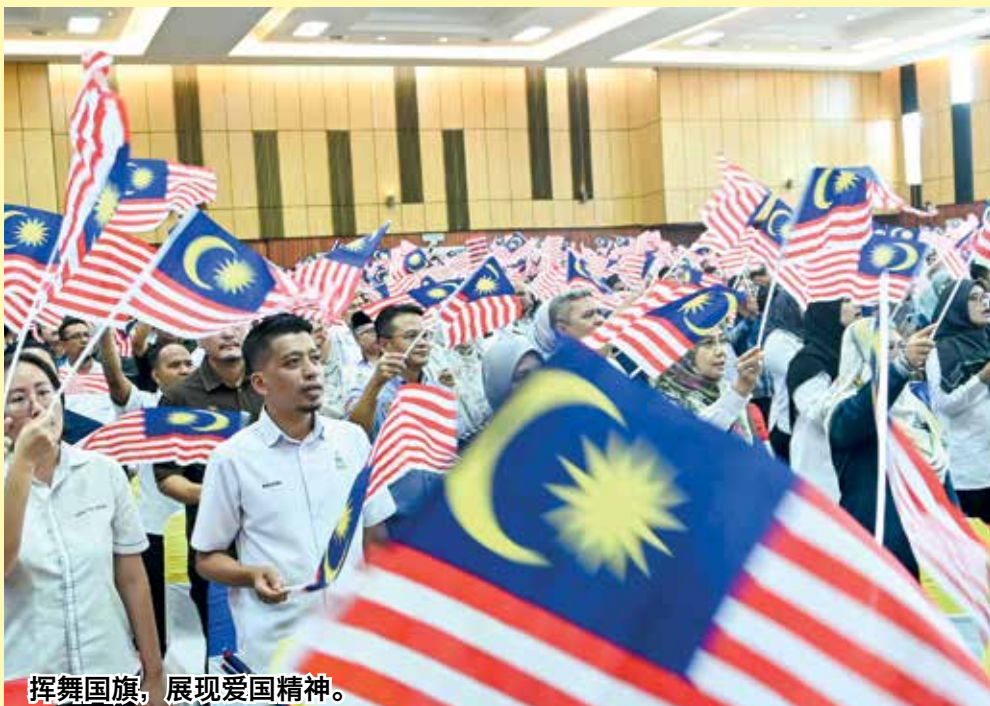
挥舞国旗，展现爱国精神。

“这项主题符合昌明大马所涵盖的理念，既通过思维、社会和经济的包容，加强马来西亚人民的团结及和谐，打造