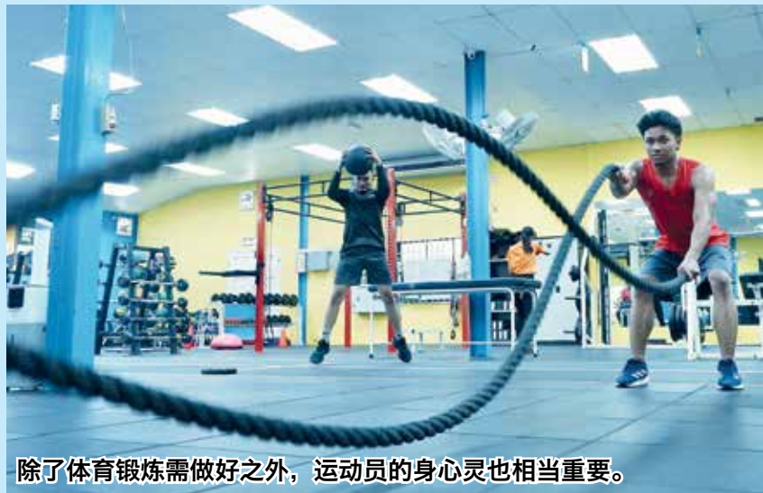
除了体育锻炼需做好之外，运动员的身心灵也相当重要。