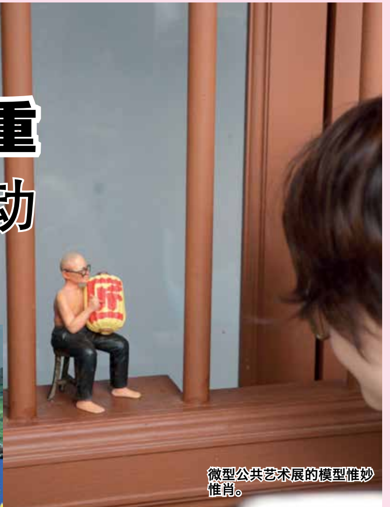
微型公共艺术展的模型惟妙惟肖。

他说，乔治市艺术节不仅仅是一场盛会，更是槟城精神的体现，是所有传统与创新和谐共存的地方，愿国内外人士好好享受今年的盛会。