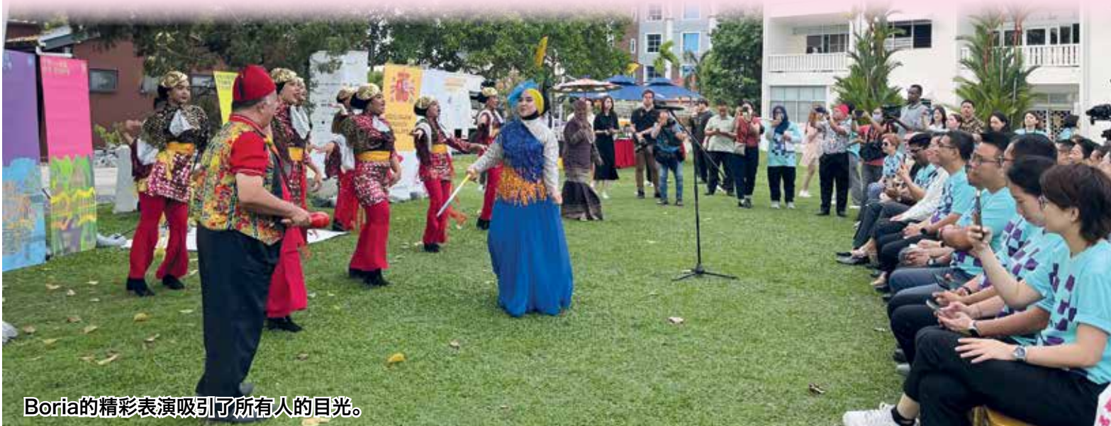
Boria的精彩表演吸引了所有人的目光。

在开幕仪式结束后，众人乘坐巴士前往位于头条路的GTF@Capri Penang 参观微型公共艺术展，进一步了解乔治市文化。