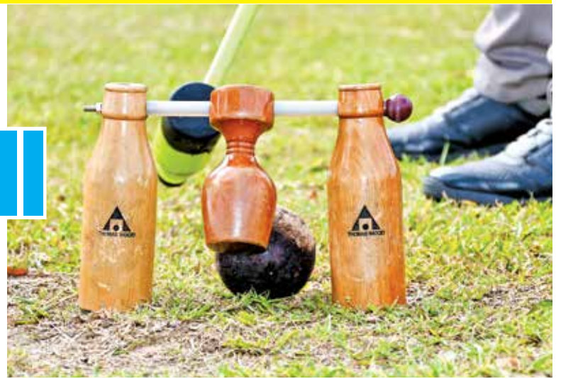
Described as a cross between croquet and golf, woodball is a sport where a mallet is used to pass a ball through gates. It can be played on grass, sand, or indoors, with rules similar to golf, including tee shots and putting strokes.

"Congratulations also to the winners. May this success serve as a stepping stone towards achieving even more in woodball," said Gooi, who