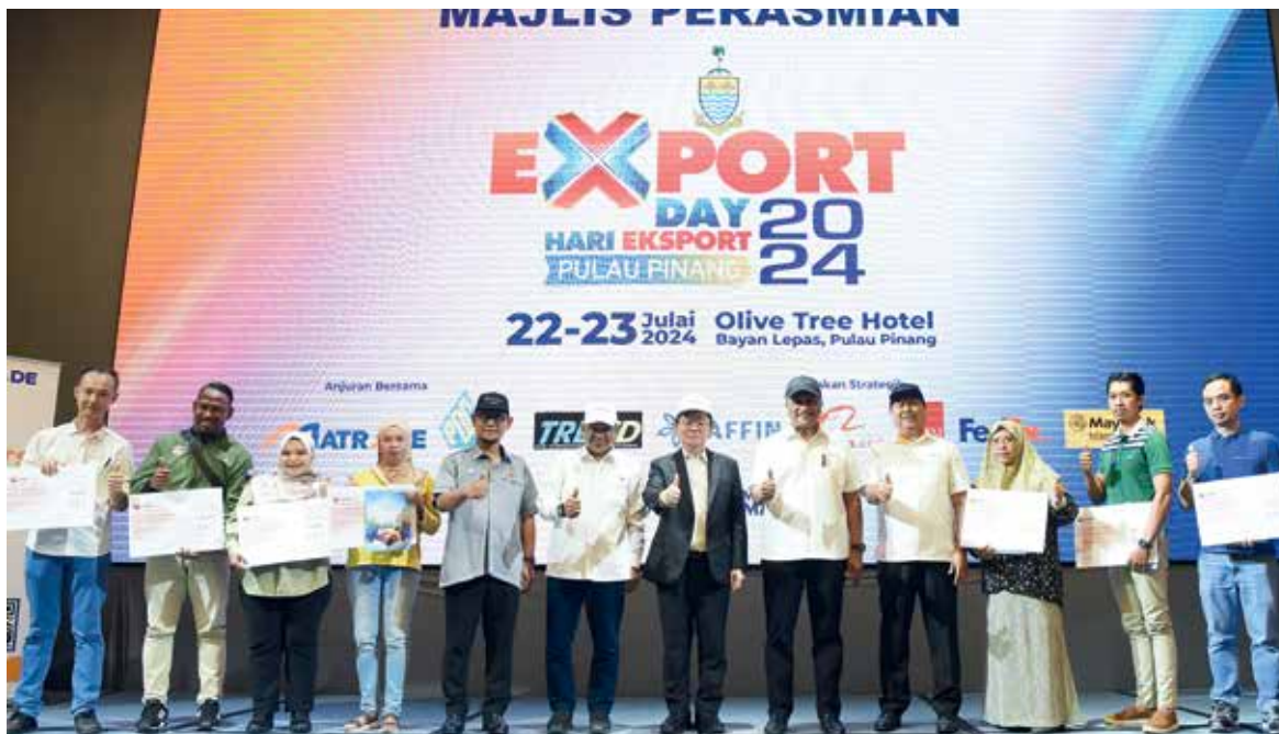
槟州出口额持续增长，曹观友（中）等人充满信心迈向更好的未来。

他重申，通过2030年槟城结构蓝图，希望有助于提高槟城的能力，以实现2025年国内生产总值（GDP）预计增长5.4