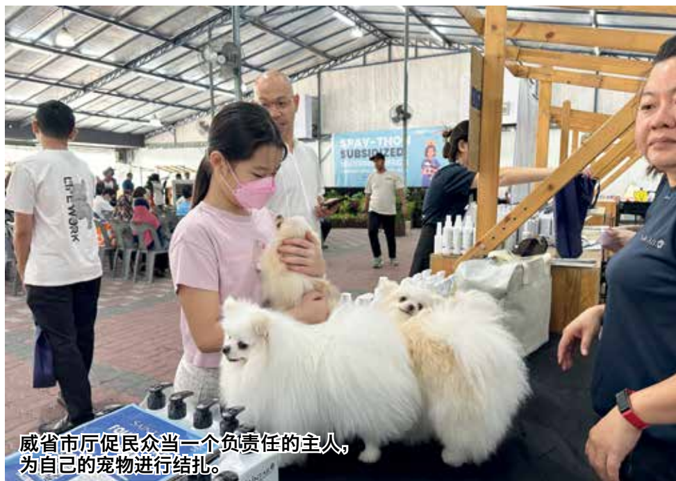
威省市厅促民众当一个负责任的主人，为自己的宠物进行结扎。