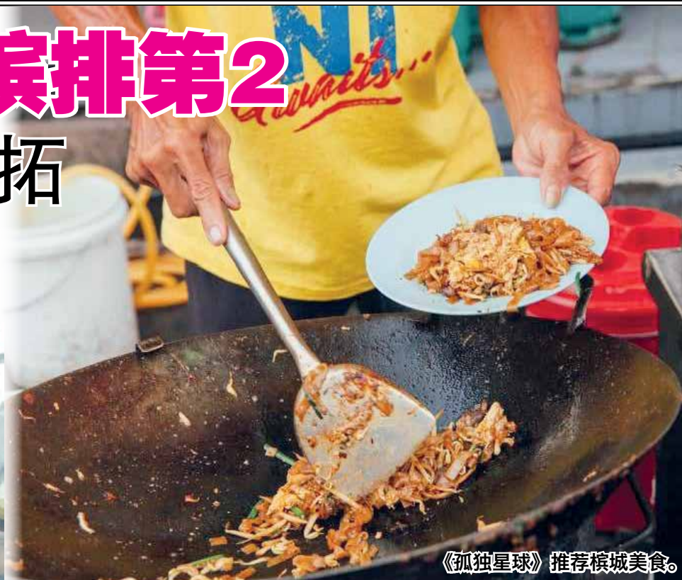
《孤独星球》推荐槟城美食。

“深圳槟城的直飞航线上周成为槟城的第17条国际航线，加入槟城现有的广州、厦门、上海、香港、迪拜、新加坡、曼谷、普吉岛、棉兰、雅加达、泗水、班达亚齐、台北、胡志明市、海口(包机)与重庆(包机)等