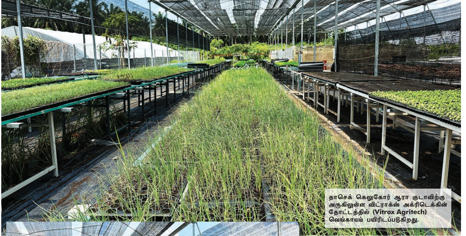
தாசெக் கெலுகோர் ஆரா குடாவிற்கு அருகிலுள்ள விட்ராக்ஸ் அக்ரிடெக்கின் தோட்டத்தில் (Vitrox Agritech) வெங்காயம் பயிரிடப்படுகிறது.