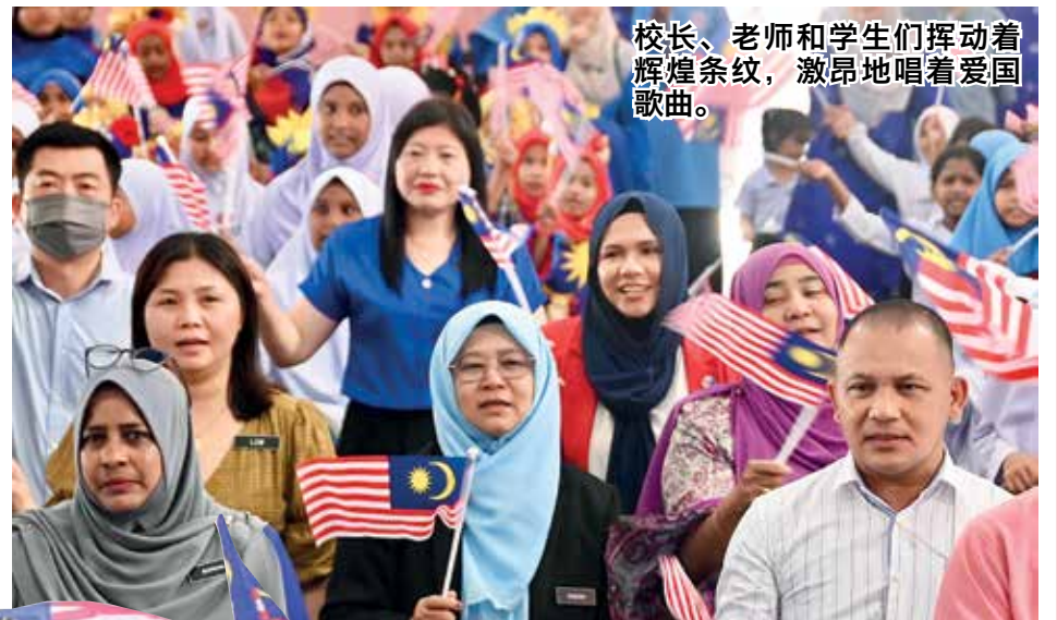
校长、老师和学生们挥动着辉煌条纹，激昂地唱着爱国歌曲。