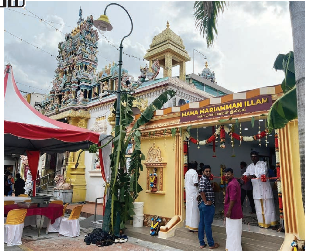
குயின் ஸ்ரிட் அருள்மிகு ஸ்ரீ மகா மாரியம்மன் ஆலயத்தின் அருகாமையில் புதிய பல்நோக்கு மண்டபம் அமைக்கப்பட்டுள்ளது.