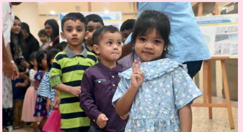
州政府增强儿童保育服务，并通过公共宣传活动，强调家庭的重要性的和生育的好处。

“我们共拨出90万4523令吉28仙，当中为新托儿所和幼儿园提供46万6484令吉30仙，提升计划则是43万8038令吉98仙，希望鼓励业者踊跃参与保育服务，从而减轻父母负担。”