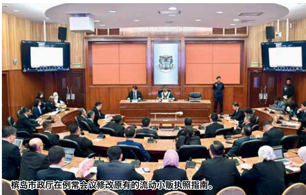
槟州市厅在例常会议修改原有的流动小贩执照指南。

至于餐车垃圾处理费方面，若是贩卖食物饮料，每个月征收225令吉；每日则是7令吉50仙；若是售卖货品及提供服务，则每个月的垃圾处理费为75令吉，或每日2令吉50仙。