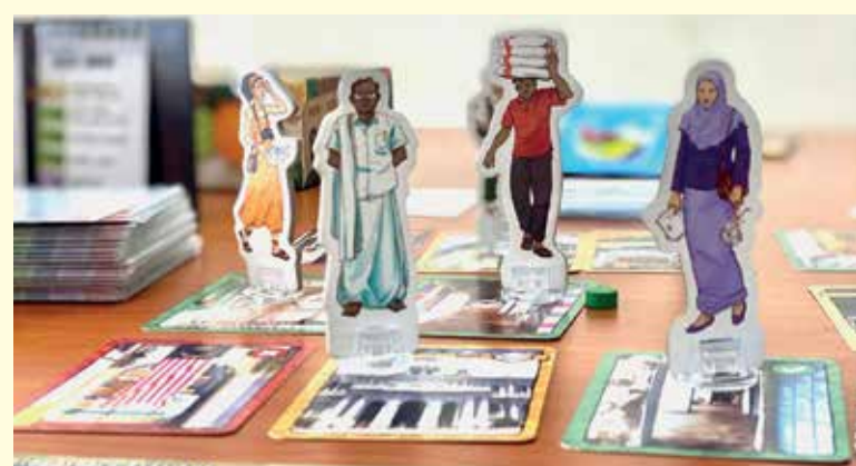
《Bansan》桌游的设计精致，内里的人物是日常中可见到的叔叔阿姨。

言，若相比于其他国家如新加坡、德国等，马来西亚的桌游领域仍处于很大的发展空间，需要大家的努力推动。