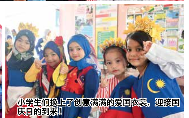
小学生们换上了创意满满的爱国衣裳，迎接国庆日的到来！

洽场景，尤其是在举办各项活动时，各族居民都会热情参与，这也包括此次所举办的国庆活动。