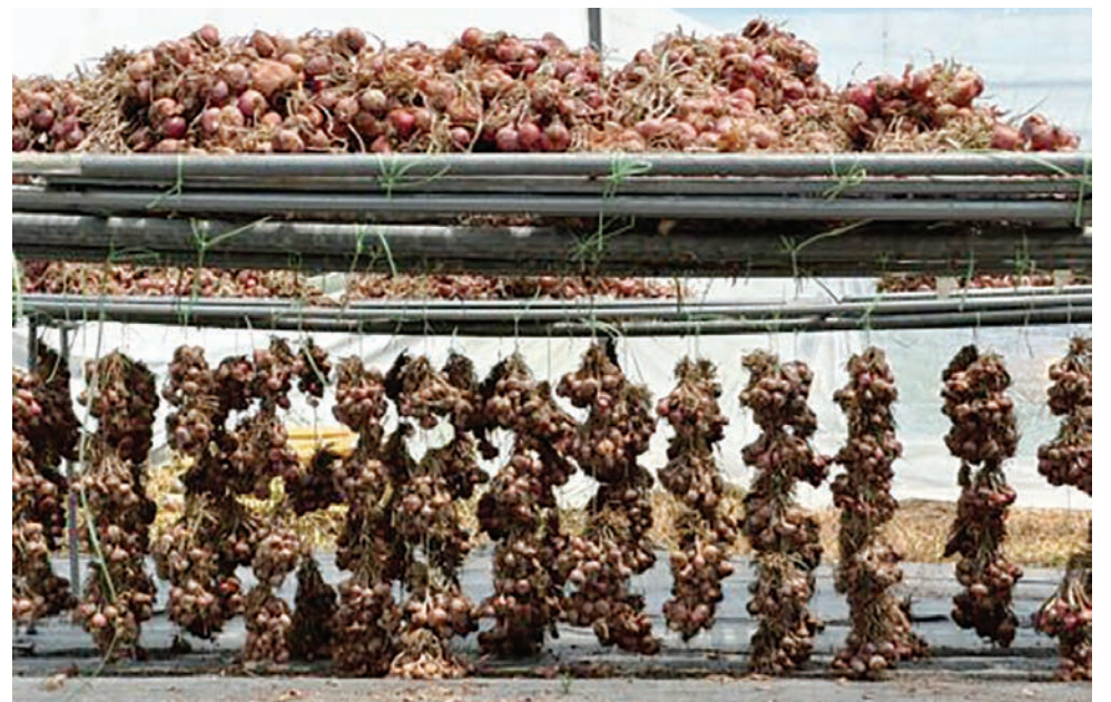
பினாங்கில் அறுவடை செய்யப்பட்ட வெங்காயங்களைப் படத்தில் காணலாம்.