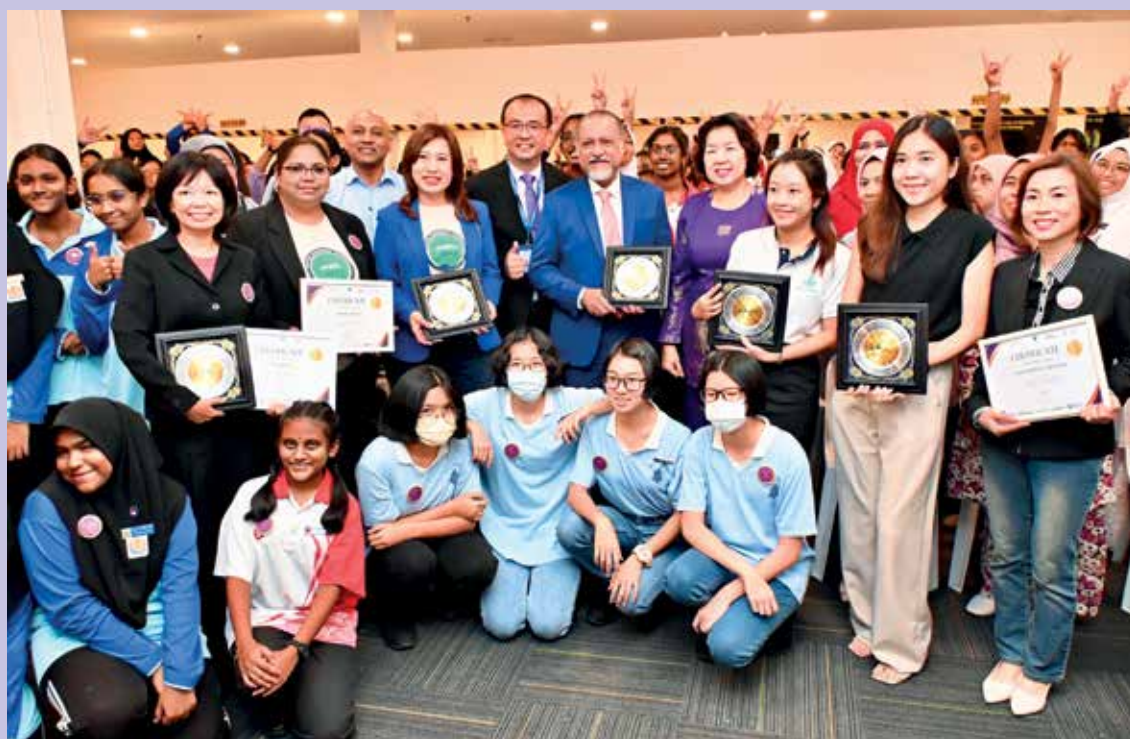
TIMBALAN Ketua Menteri II yang juga Exco Pembangunan Modal Insan dan Sains & Teknologi, Jagdeep Singh Deo (berkot biru, tengah) hadir menyempurnakan perasmian ‘Women in Zcience’ di Tech Dome Penang baru-baru ini.

“Di Jabil, kami meraikan kepelbagaian dan keterangkuman termasuk memperkasa wanita melalui program-program yang dianjurkan.