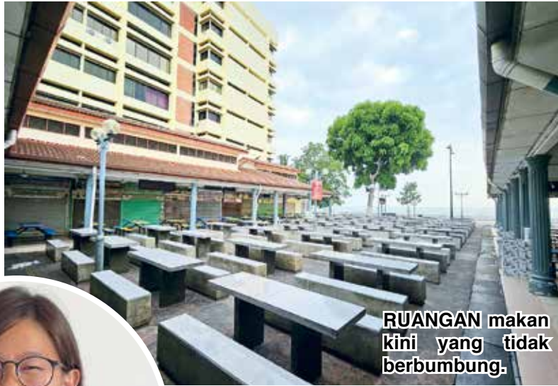
RUANGAN makan kini yang tidak berbumbung.