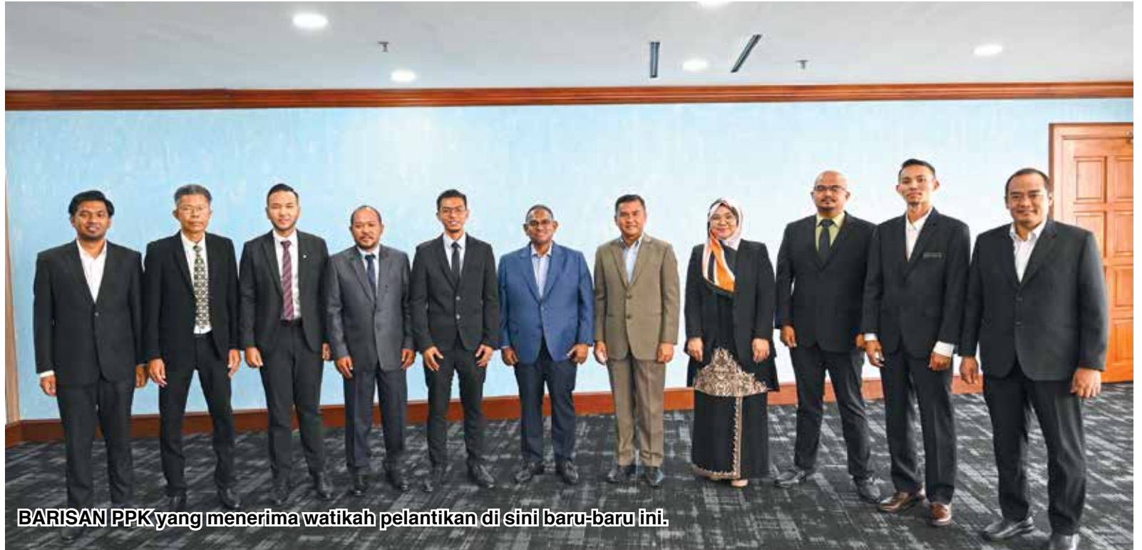
BARISAN PPK yang menerima watikah pelantikan di sini baru-baru ini.