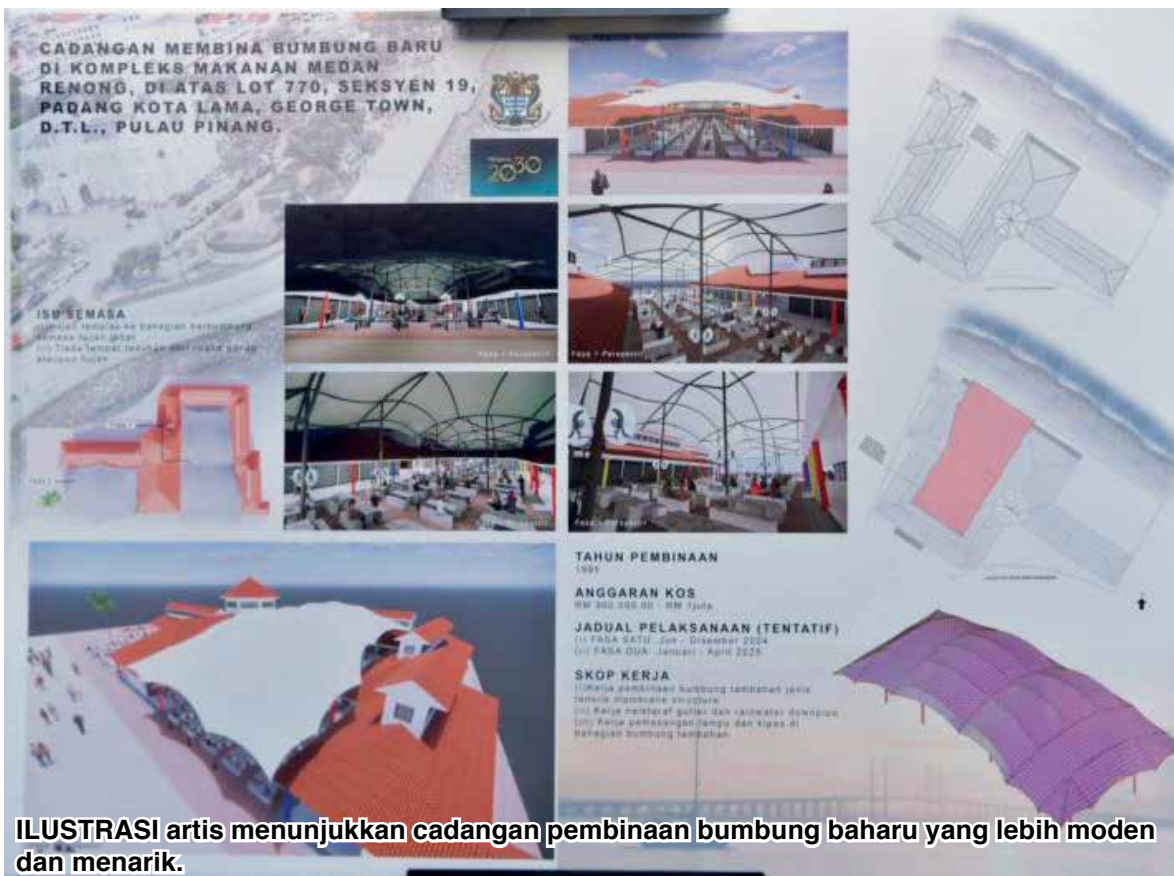
ILUSTRASI artis menunjukkan cadangan pembinaan bumbung baharu yang lebih moden dan menarik.

Dibina pada tahun 1995, Kompleks Makanan Medan Renong mempunyai 51 gerai yang mana 32 gerai jualan di bahagian halal; 17 di bahagian tidak halal dan dua gerai menjual barangan am.