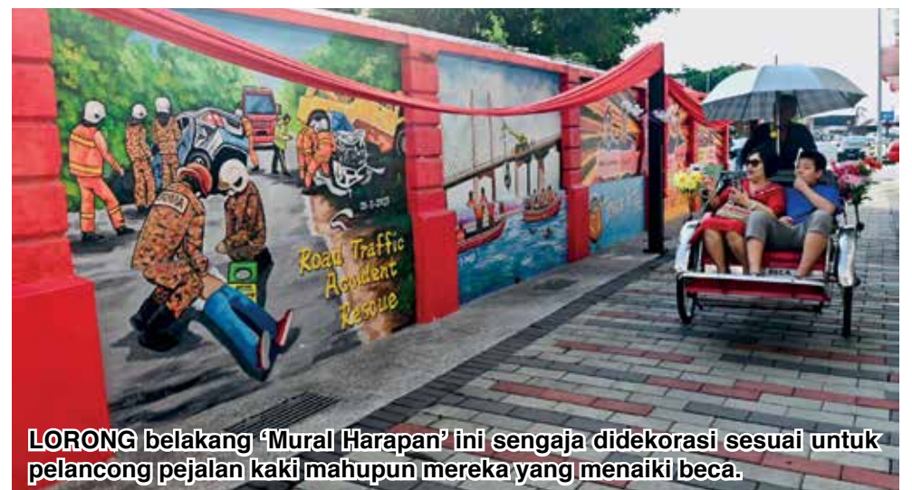
LORONG belakang ‘Mural Harapan’ ini sengaja didekorasi sesuai untuk pelancong pejalan kaki mahupun mereka yang menaiki beca.

Sesungguhnya, kewujudan lorong belakang ‘Mural Harapan’ menambahkan lagi daya tarikan pelancongan bukan sahaja di bangunan warisan Balai Bomba Lebuh Pantai, malah sekitar Tapak Warisan Dunia UNESCO George Town.