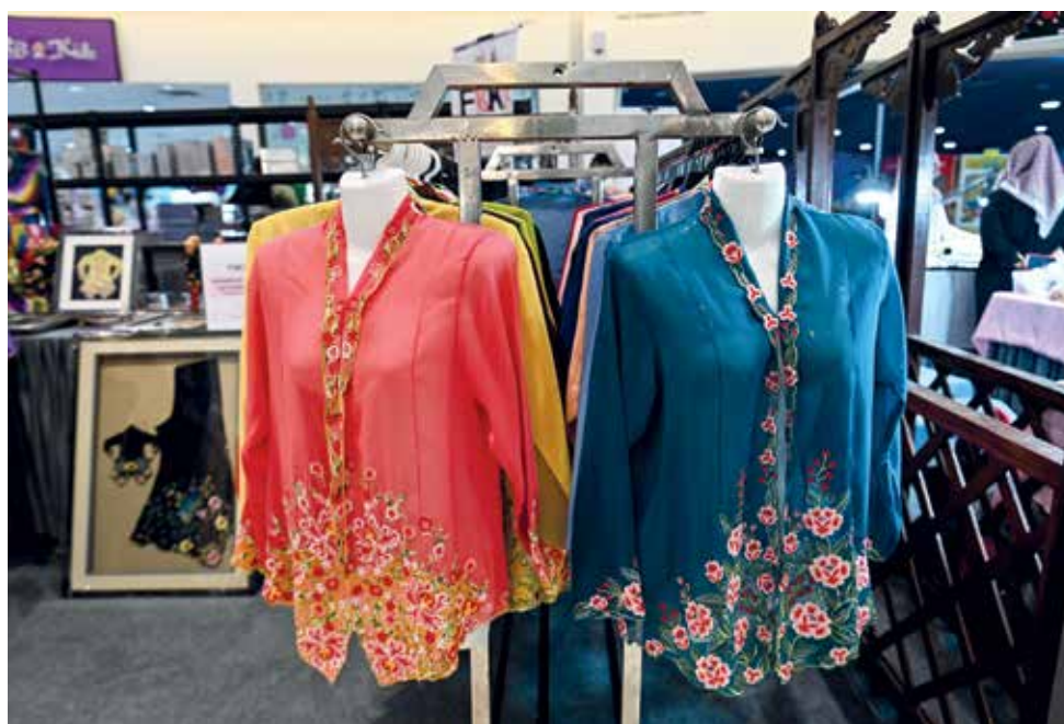
JAHITAN sulaman memerlukan ketelitian.

“Menerusi seni ini, mereka boleh membuat perniagaan berasaskannya dan saya jamin ia dapat menjana pendapatan,” serunya.