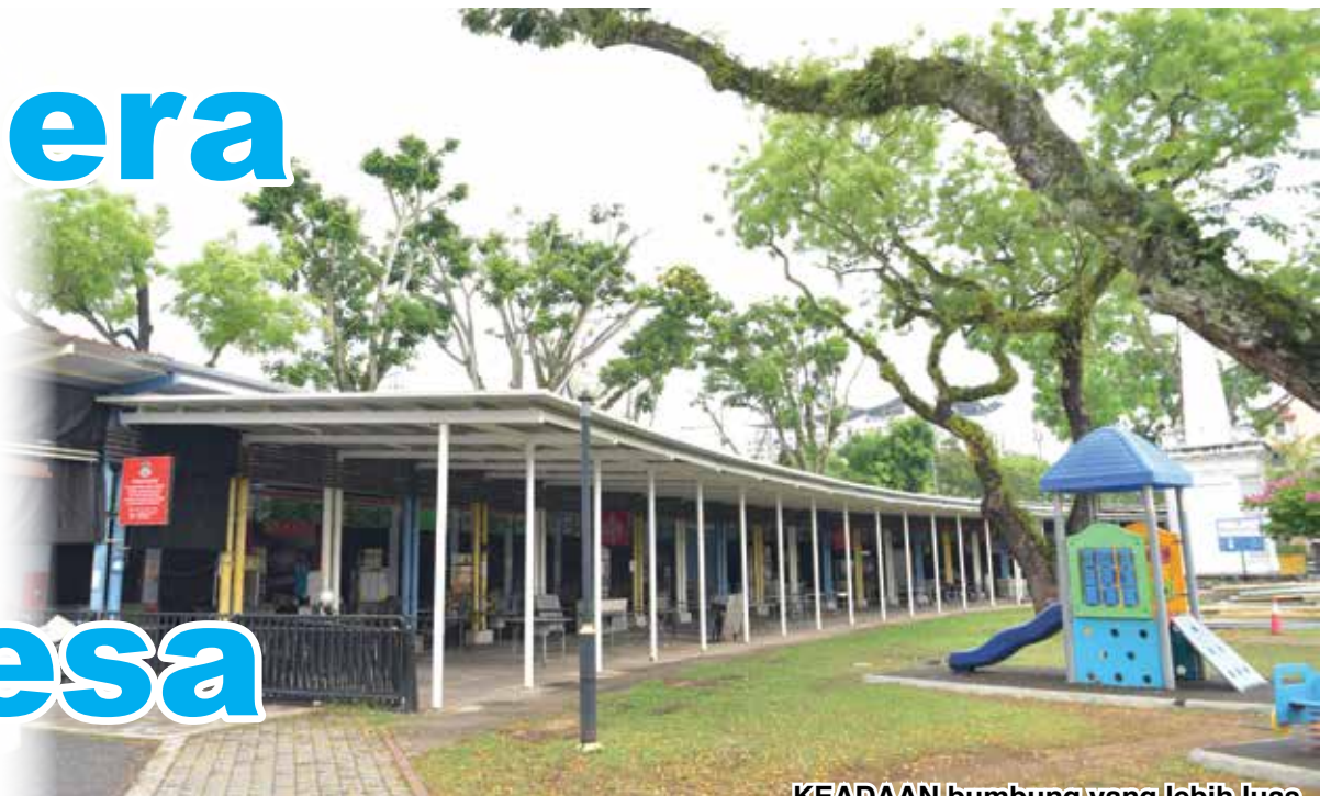
KEADAAN bumbung yang lebih luas.

Oleh : WATAWA NATAF ZULKIFLI