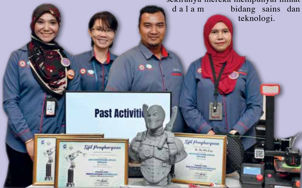
ANTARA penghargaan yang diperoleh melalui pertandingan bertemakan STEM.

Difahamkan, WiZ merupakan program hasil inisiatif Tech Dome Penang bersama-sama Perbadanan Pembangunan Wanita Pulau Pinang (PWDC) dan disokong oleh Bahagian Kejuruteraan Wanita, IEM.