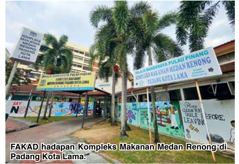
FAKAD hadapan Kompleks Makanan Medan Renong di Padang Kota Lama.

“MBPP percaya apabila projek ini selesai ia akan menarik lebih ramai pengunjung ke kompleks makanan tersebut apatah lagi reka bentuk bumbung yang pastinya lebih menarik.