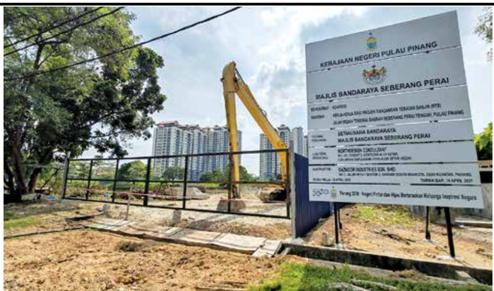
南美园登比盖路治水工程已展开，民众受促勿擅闯工地，以策安全。