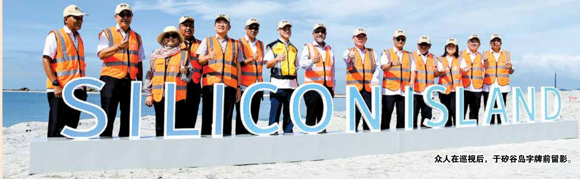
众人在巡视后，于矽谷岛字牌前留影。

全 长380公尺的海上高架桥预计将于2028年12月全面启用，以连接槟岛南部与矽谷岛。