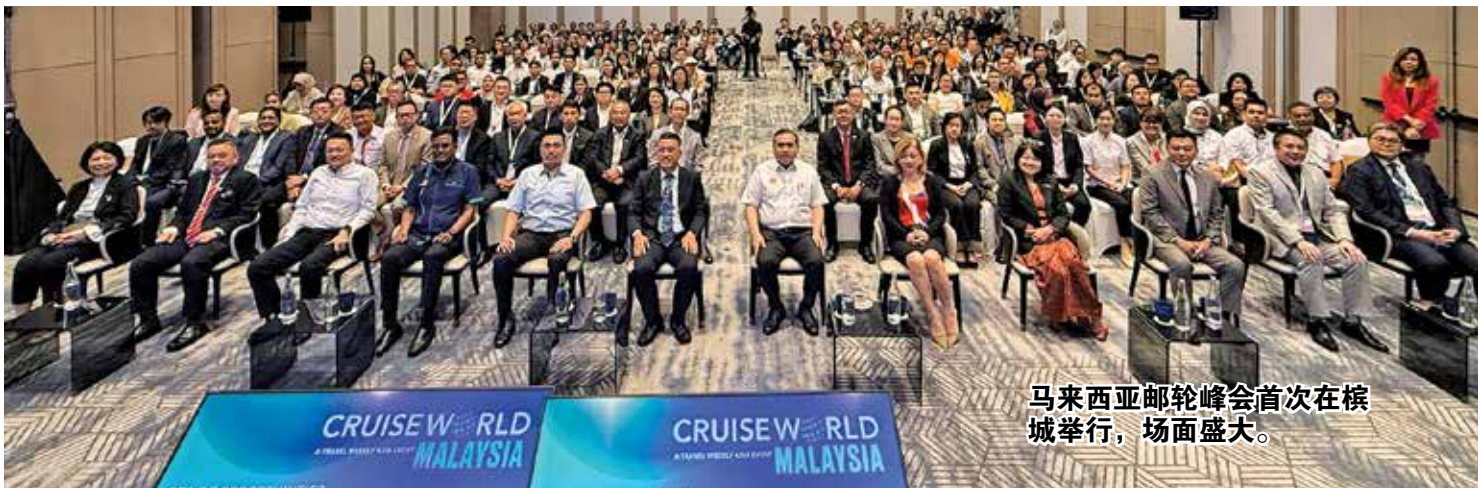
马来西亚邮轮峰会首次在檳城举行，场面盛大。

“我们支持东盟国家推动‘一签证走遍多国’的构想。若能通过制度简化和港口合作，将马来西亚、新加坡、泰国、印尼等地串联成统一邮轮旅游区域，将为东盟旅游带来爆炸性增长。”