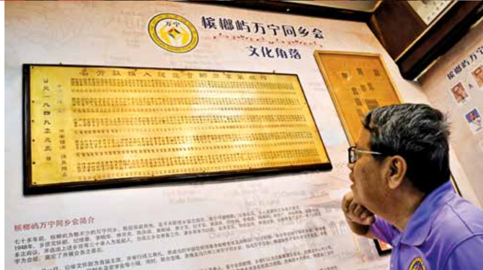
悬挂着订制于1949年的认捐牌匾，当中有趣的是牌匾中认捐记录方式。