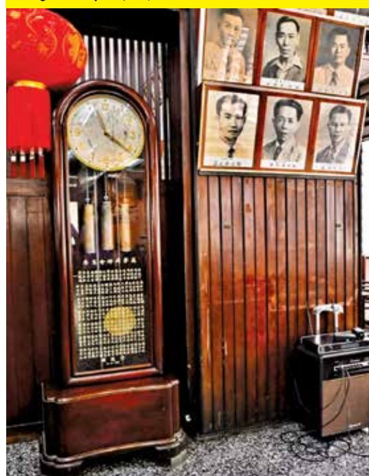
会馆大厅中有个年久失修的古老摆钟，经过维修后已重启。