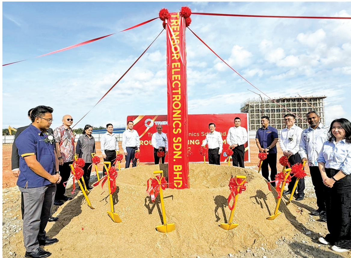
Chow (sixth from right) and other guests at the groundbreaking ceremony.

"It will focus on the production of automotive pressure sensors for export to markets such as North America