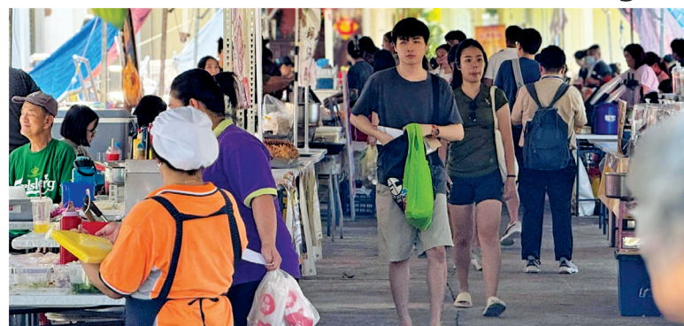
Visitors during the food fair all set to try the delicious dishes on offer.