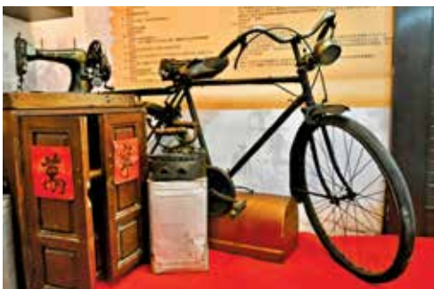
老式脚车是旧时代，秘书骑着去向会员收会费。旁为1912年出产的缝纫机。