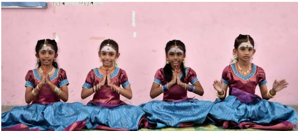
திருமுறை ஒதும் போட்டியில் கலந்து கொண்ட மாணவர்கள்.

70% உறுப்பினர்கள் மகளிர் என்பது வரலாற்று சாதனையாகும். இது பாலின சமத்துவத்துக்கான உறுதிப்பாட்டைப் பிரதிபலிக்கிறது.