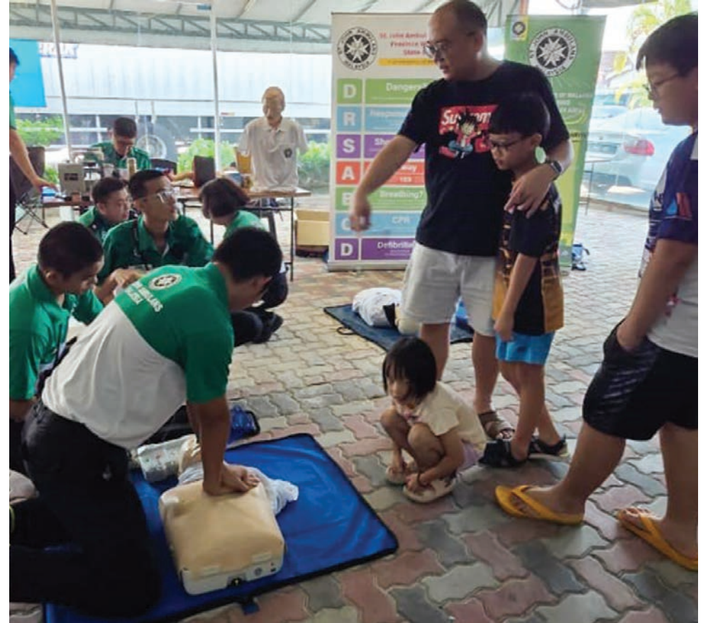
ரத்த தான முகாமில் சி.பி.ஆர் முதலுதவி அணுகுமுறை குறித்து கண்காட்சி இடம்பெற்றது.

மருத்துவமனைகள், அவசர சிகிச்சை பிரிவுகள், அறுவை சிகிச்சை, புற்றுநோய் மற்றும் டெங்கி நோயாளிகள் உட்பட