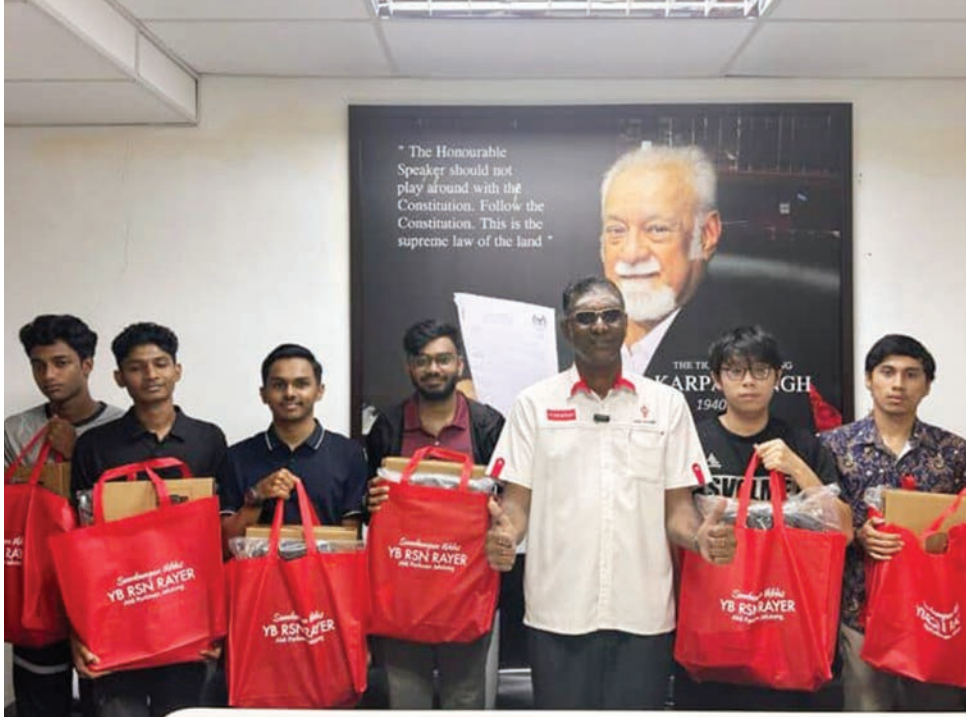
ஜெலுத்தோங் நாடாளுமன்ற உறுப்பினர் ஆர்.எஸ்.என் இராயர் மடிக்கணினி பெற்றுக்கொண்ட மாணவர்களுடன் குழுவும் எடுத்துக் கொண்டார்.

இந்த மடிக்கணினி வழங்கும் திட்டம், மேற்கல்வி தொடரும் மாணவர்களுக்குக் கல்வி சமத்துவத்தையும், தொழில்நுட்ப திறன்களையும் மேம்படுத்தும் முக்கியமான முயற்சியாக கருதப்படுகிறது.