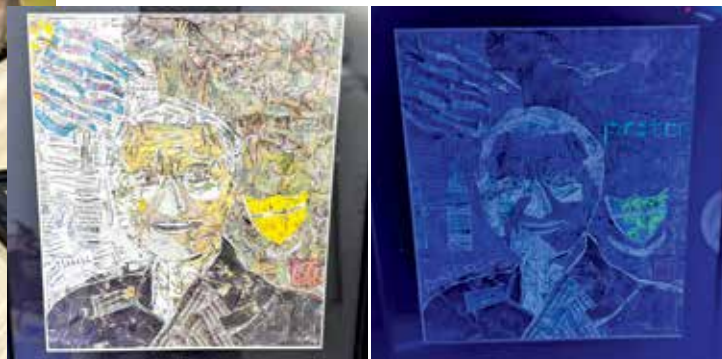
马哈迪的肖像画隐藏了宝腾汽车、老鹰、双峰塔，再经过紫外线灯光的照射下才一一显现。