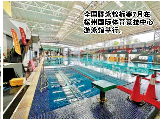
全国蹼泳锦标赛7月在槟州国际体育竞技中心游泳馆举行。