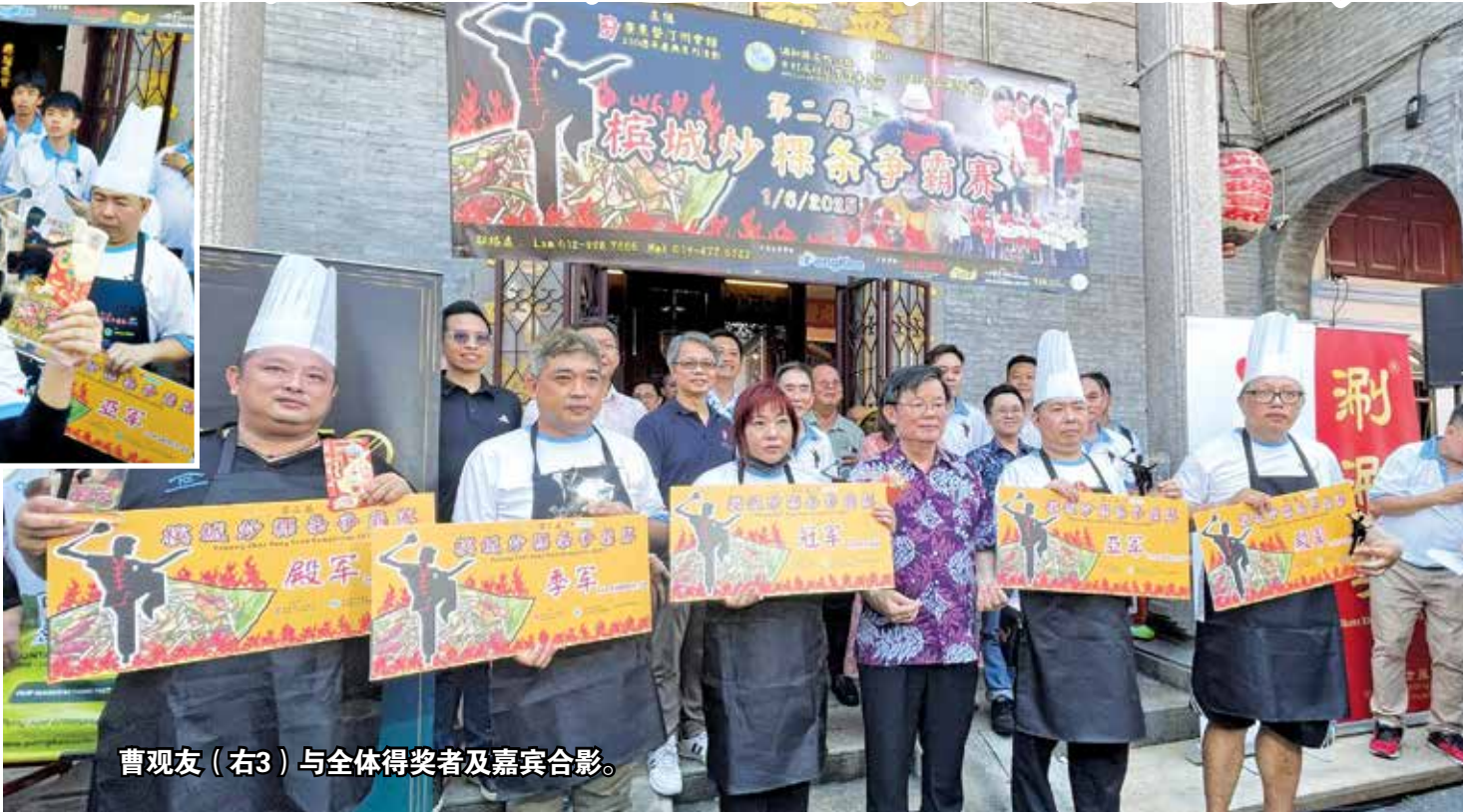
曹观友（右3）与全体得奖者及嘉宾合影。