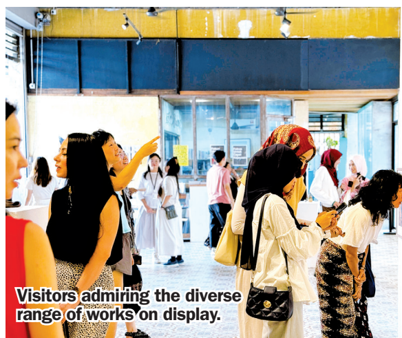
Visitors admiring the diverse range of works on display.

ists also travelled from various states to attend, celebrating the inclusive and nationwide spirit of the showcase.