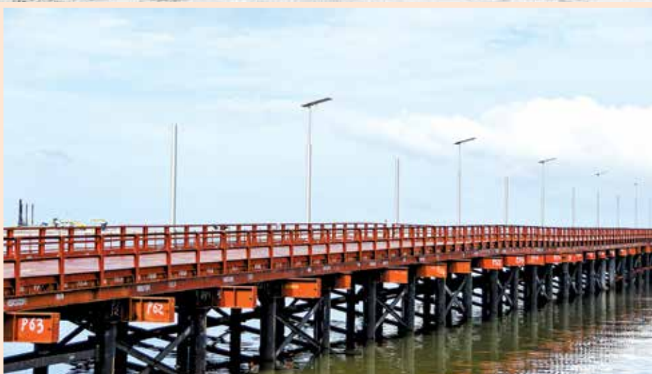
海上高架桥将在2028年取代目前的临时桥梁。

他也说，峇东美食坊（Medan Selera Matang）将设在面向矽谷岛的峇东，