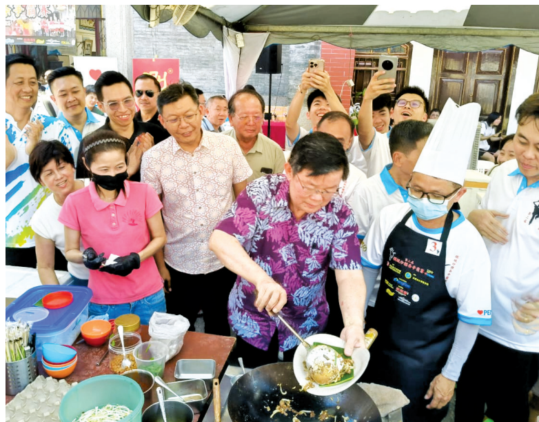
Not only is he a popular Chief Minister, but Chow shows he is no slouch either when it comes to serving up a sizzling plate of char koay teow.

"Thank you to the organisers and all the supporters. This is