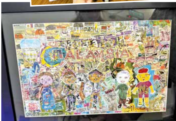
万人杰为《珍珠快讯》制作的邮票拼贴画。