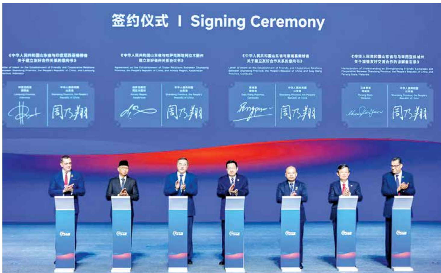
曹观友（右2）与其他5座省市代表签署加强友好谅解备忘录。

他建议，在签署备忘录后，双方应有定期的交流，加强经贸合作及深化人文交流，以探讨更多合作契机。