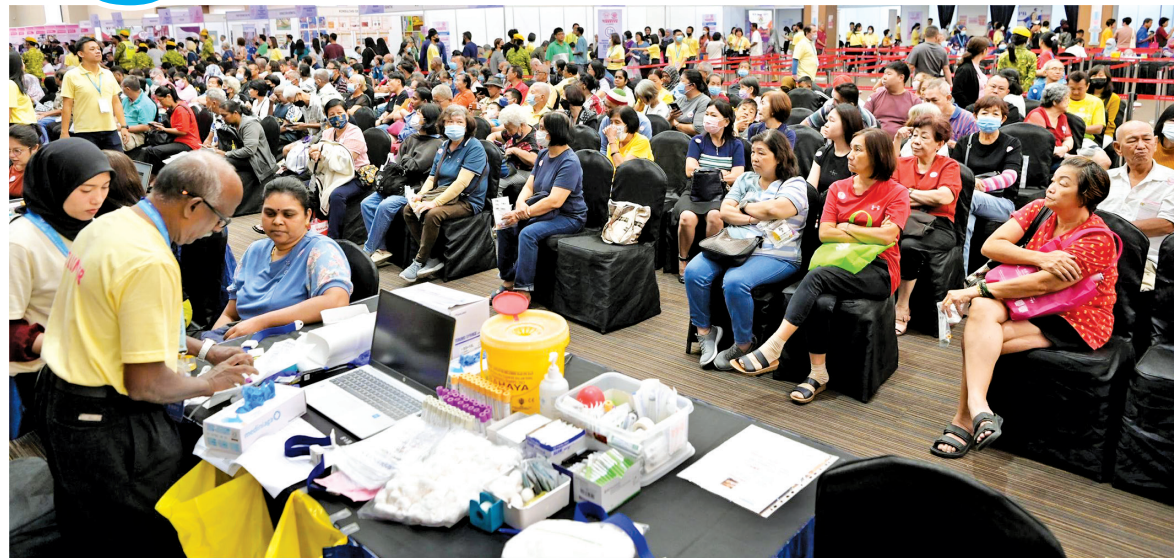
Part of the large crowd that turned up for the One Hope Charity Health Carnival.

He later presented mock cheques to hospital representa-