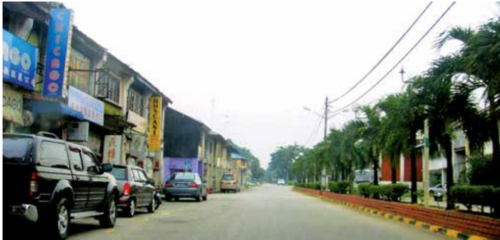
高渊大街的战前老屋是威南的瑰宝。

掌 管槟州地方政府事务行政议员方美铼建议威省市厅，拟定策略保护威南高渊大街两旁战前老屋原貌，以保留当地珍贵的历史资产。