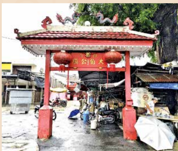
拥有138年历史的丁加奴律福德祠大伯公庙。