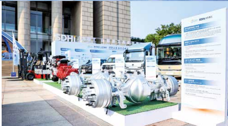
多家高质企业在国际友城合作交流周展示产品。