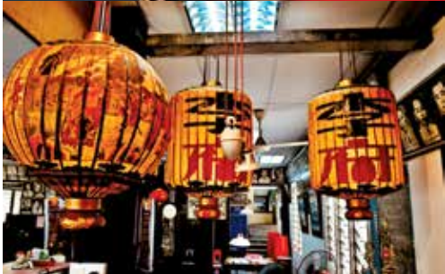
吉隆坡万宁同乡千里迢迢送来3个拥有约80年历史，以鱼皮做的传统灯笼，如今已很少见，几乎绝迹。