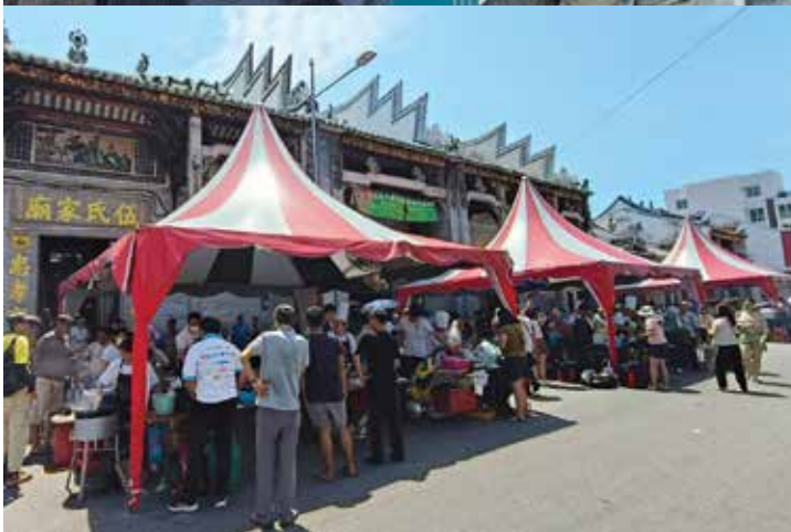
槟城炒粿条争霸赛在烈日下举行，无阻逾千民众热烈参与。美女游客津津有味享用炒粿条。