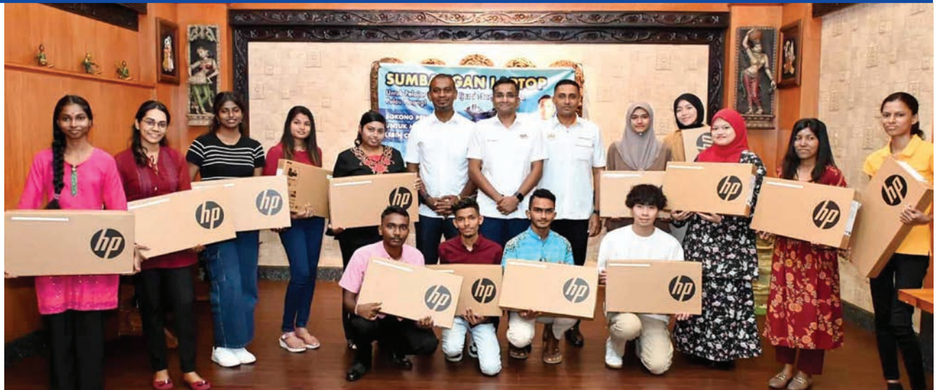
மடிக்கணினிகள் பெற்றுக்கொண்ட மாணவர்களுடன் செனட்டர் டாக்டர் லிங்கேஸ்வரன், பாகான் டாலாம் சட்டமன்ற உறுப்பினர் குமரன் மற்றும் எம்.பி.எஸ்.பி கவுன்சிலர் லிங்கேஸ்வரன்.

“இந்த முயற்சி வெறும் மடிக்கணினி வழங்குவது மட்டுமல்ல. இது மாணவர்கள் கல்வியில் இணையுழி