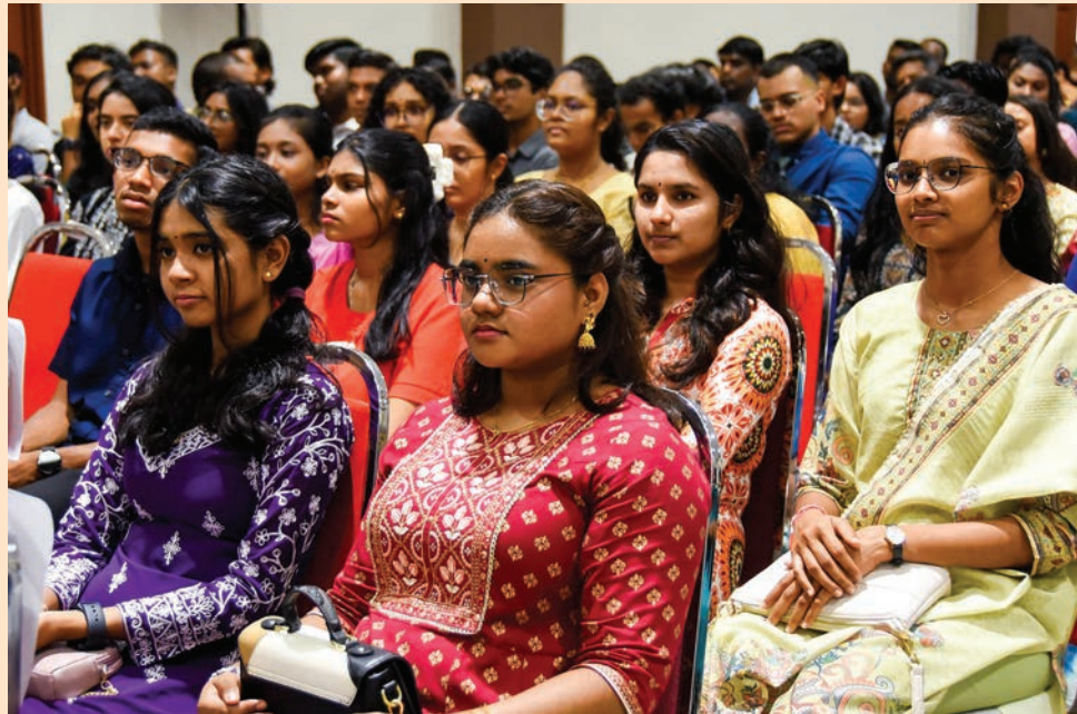
எஸ்.பி.எம் தேர்ச்சியில் சிறந்த தேர்ச்சிப் பெற்ற மாணவர்கள்.

“உங்கள் திறன்கள் வேலைக்கான காலியிடங்களை நிரப்புவதற்கு மட்டுமல்ல, புத்தாக்கத் திறனை வளர்க்கவும், பொருளாதாரத்தை மேம்படுத்தவும், நமது நாட்டில் வாழ்க்கைத் தரத்தை மேம்படுத்துவதும் அவசியமாகும்,” என்று அவர் கூறினார்.