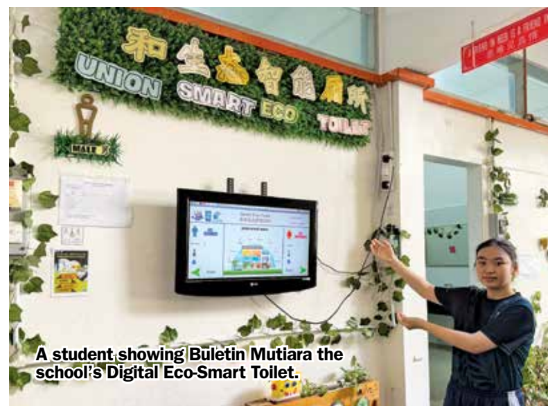
A student showing Buletin Mutiara the school's Digital Eco-Smart Toilet.