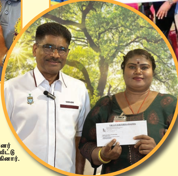
வீடமைப்பு மற்றும் சுற்றுச்சூழல் ஆட்சிக்குழு உறுப்பினர் டத்தோ ஸ்ரீ சுந்தராஜு முத்தியாரா வீடமைப்புத் திட்ட வீட்டு உரிமைக் கடிதத்தை அதன் பெறுநரிடம் வழங்கினார்.