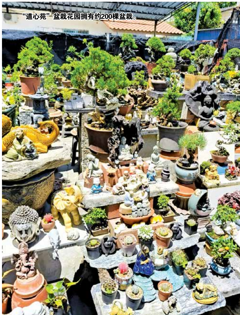
“道心苑”盆栽花园拥有约200棵盆栽。

“其实我们是抱着平常心种植，一切随缘。道心苑顾名思义，是修心和禅修之地，通过种植盆栽，寻求心里平静，洗涤心灵，这才是重点。”