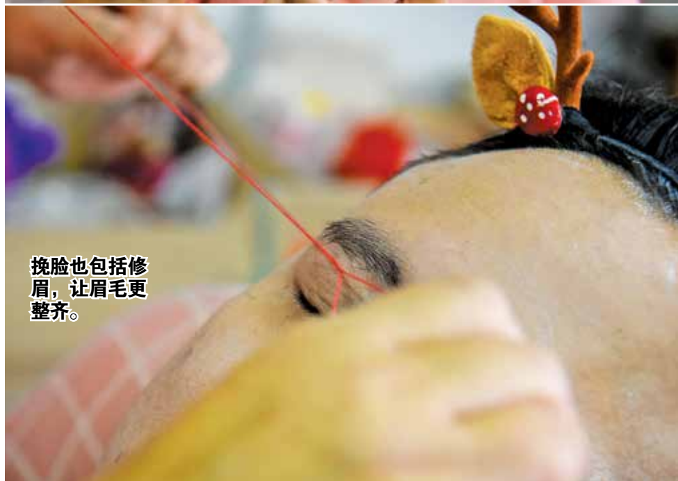
挽脸也包括修眉，让眉毛更整齐。