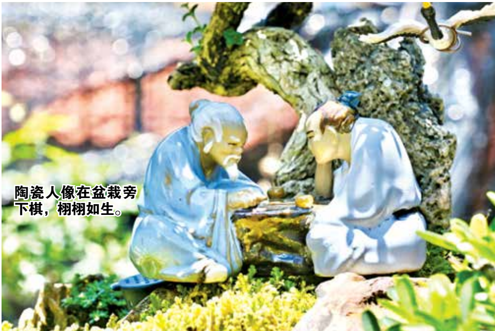
陶瓷人像在盆栽旁下棋，栩栩如生。