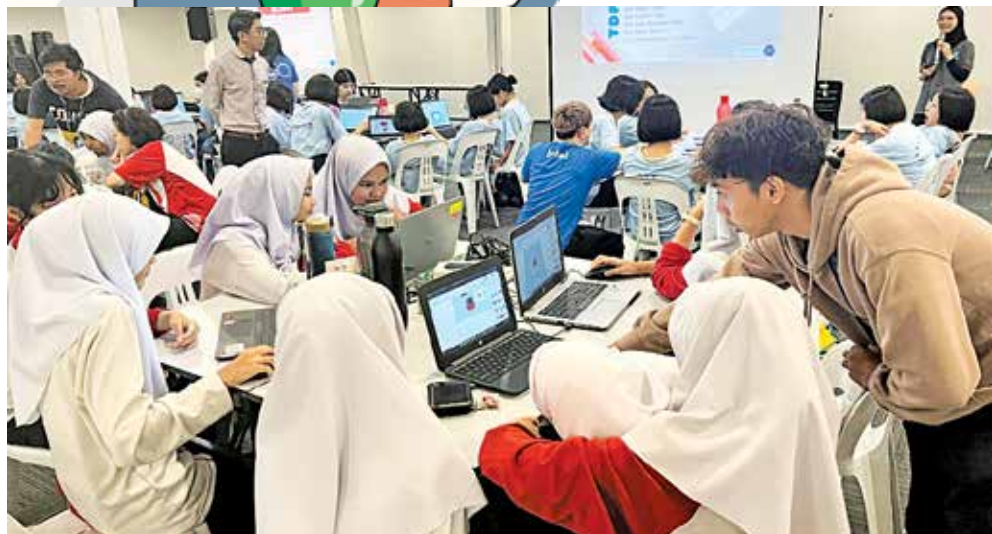
槟州女性科学工作坊为对科技感兴趣的学生提供学习机会。

■ 报导：李佳盈