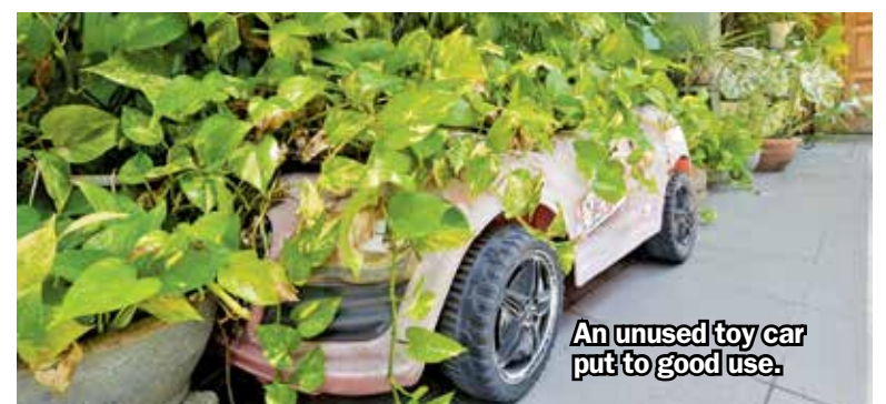
An unused toy car put to good use.