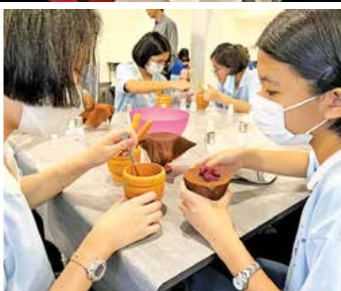
槟州女性科学工作坊的活动生动有趣，包含实验、参观工厂等，让她们亲身感受科学的魅力。

知识能帮助解释实验，而实验又能让抽象的概念变得生动具体，可说是相辅相成的学习方式。