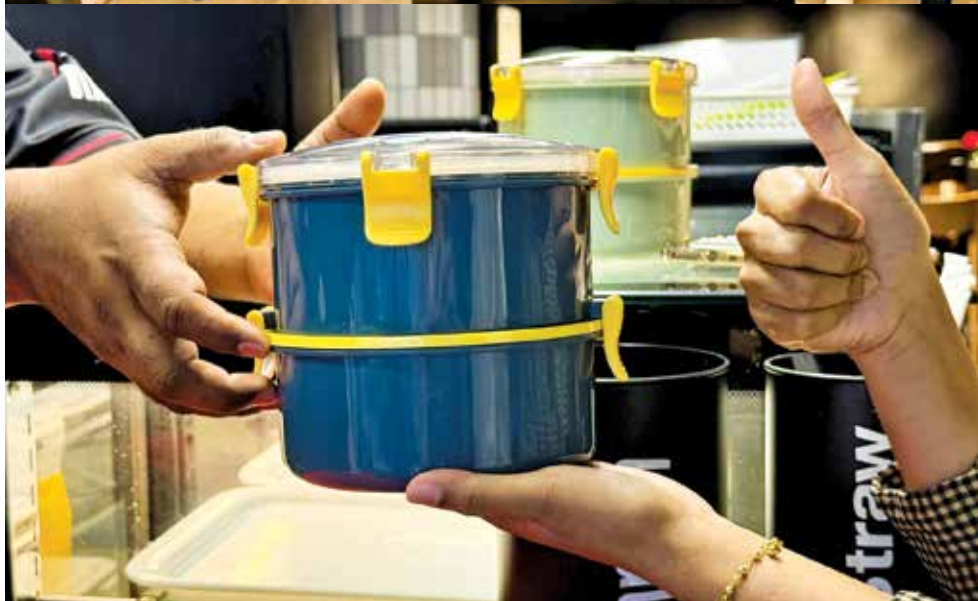
使用“碗盏”打包食物，干净又卫生。

境的影响。他说，槟城的垃圾回收率已达43.72%，远高于全国回收率35.38%。根据威南浮罗布弄垃圾填埋场的的数据，2023年填埋的塑料垃圾达5万216.29公吨，占总垃圾量（24万0325.20公吨）的21%。