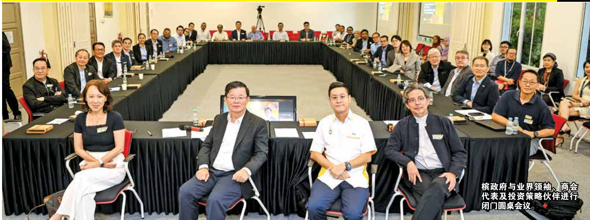
槟政府与业界领袖、商会代表及投资策略伙伴进行闭门圆桌会议。