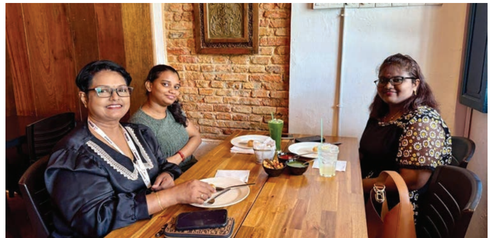
சர்தார்ஜி உணவகத்தின் வாடிக்கையாளர்கள் அதன் உணவின் சுவைக் குறித்து புகழாரம் சூட்டினர்.