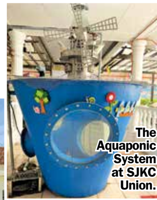
The Aquaponic System at SJKC Union.