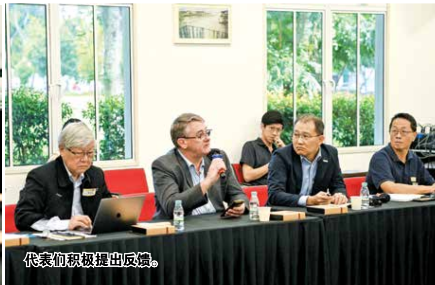
代表们积极提出反馈。