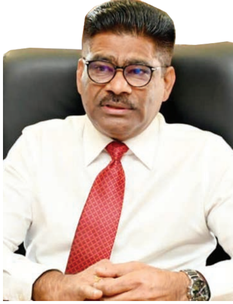
மாநில வீட்டுவசதி மற்றும் சுற்றுச்சூழல் ஆட்சிக்குழு உறுப்பினர் டத்தோ ஸ்ரீ சுந்தராஜு சோமு.

"இந்தத் திட்டத்தை நான் மதிப்பாய்வு செய்தப் பிறகும், அங்குள்ள உள்ளூர் இந்தியச் சமூகம் எதிர்கொள்ளும் சவால்கள் மற்றும் சிரமங்களைப்