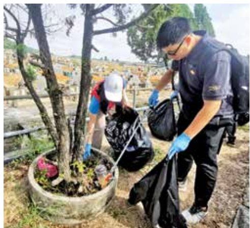
尽管整体上公民意识已有提升，但仍有民众贪图方便，随处丢垃圾。

今年槟州政府继续推动文明扫墓运动，并在多个地区展开环境卫生改善行动。槟州社会发展、福利及非伊斯兰教事务行政议员林秀琴表示，今年清明节期间，相较于去年，义山的环境整洁度已有显著改善。