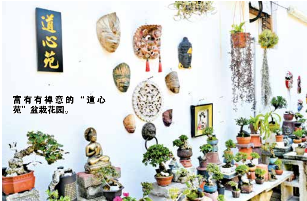
富有有禅意的“道心苑”盆栽花园。