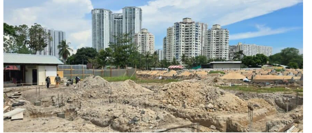
சுங்கை ஆராவில் இந்தியச் சமூகத்தினருக்காக ஈமச்சடங்கு மண்டப மேம்பாட்டுத் திட்டம் நிர்மாணிக்கப்படுகிறது.