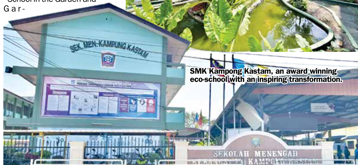
SMK Kampong Kastam, an award winning eco-school with an inspiring transformation.