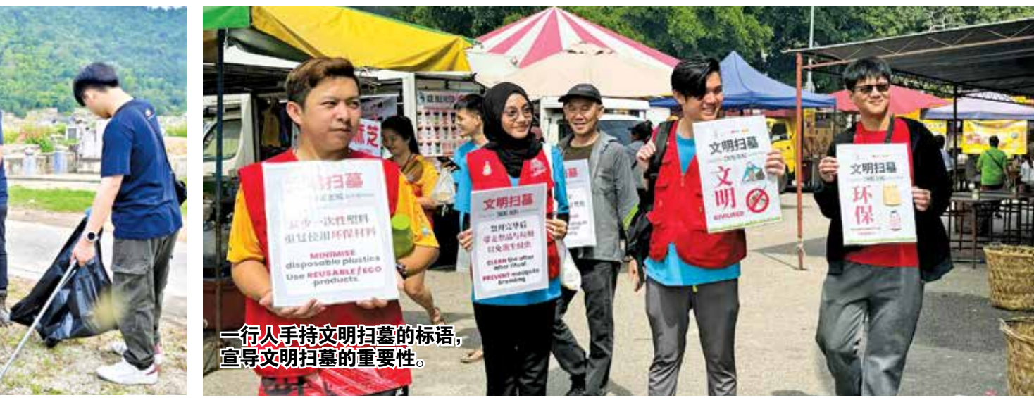
一行人手持文明扫墓的标语，宣导文明扫墓的重要性。