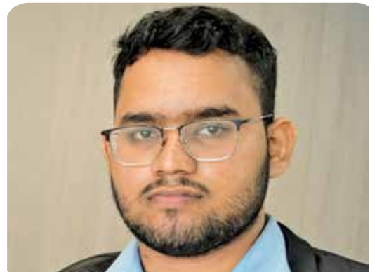
卡文尼斯 (理工大学UTM电脑数据工程系)

“获得这项奖学金是一个改变人生的机会。它减轻了高等教育的经济负担, 让我能够全心全意地学习、成长和回馈社会。这项奖学金不仅关乎学术成就; 它还关乎为槟城和马来西亚建设更美好的未来。”