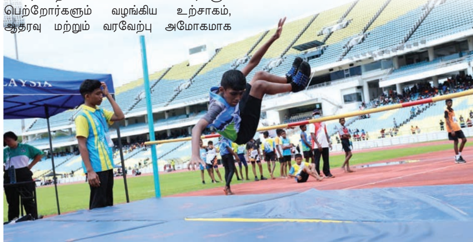
மாணவன் உயரம் தாட்டும் போட்டியில் பங்கேற்பதைப் படத்தில் காணலாம்.

இருந்தது. இது போன்ற ஒரு பெரிய அளவிலான போட்டியை ஏற்பாடு செய்வது என்னுடைய நீண்ட நாள் கனவாகும், இறுதியாக அது நனவாகியுள்ளது.