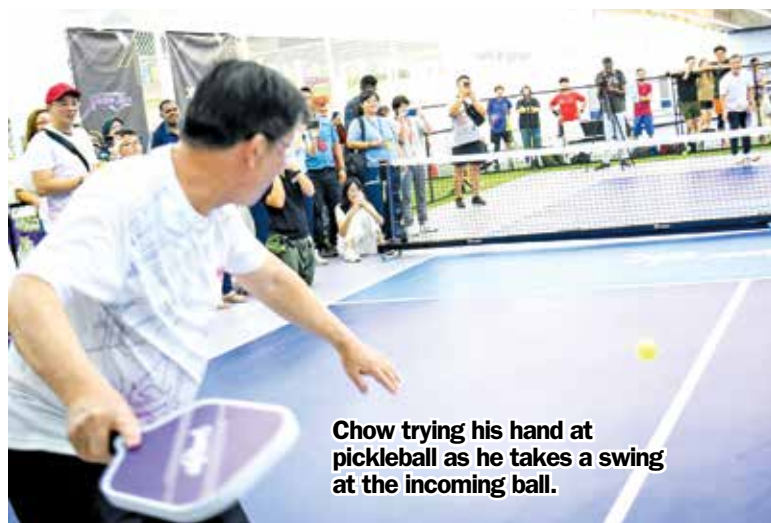
Chow trying his hand at pickleball as he takes a swing at the incoming ball.

RM50,000 and drew over 350 players from across the country.