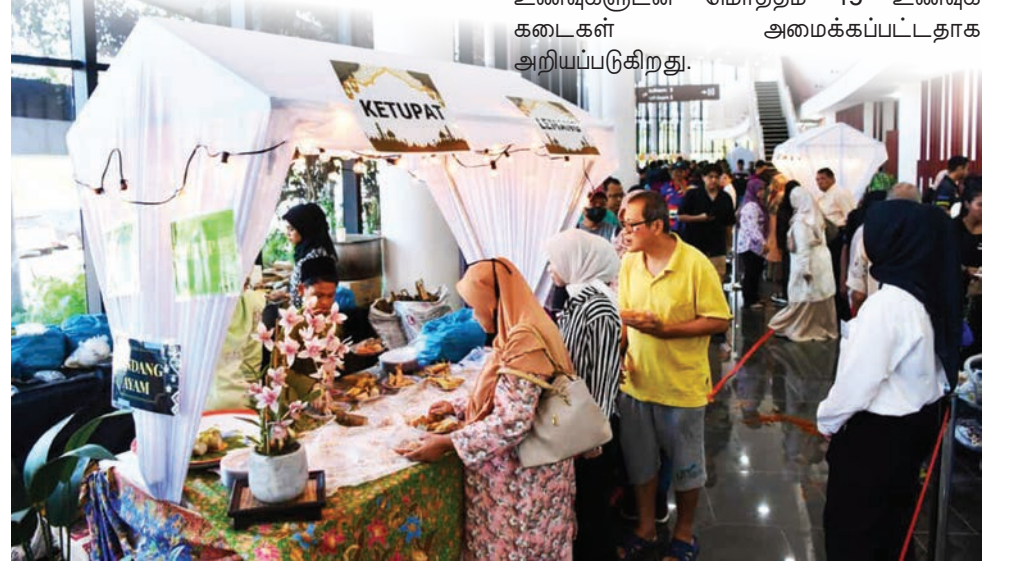
நோன்புப் பெருநாள் திறந்த இல்ல உபசரிப்பில் பொது மக்கள் பாரம்பரிய உணவுகளை உண்டு மகிழ்ந்தனர்.

மாநில அரசு ஆட்சிக்குழு உறுப்பினர்கள், சட்டமன்ற உறுப்பினர்கள், அரசுத் துறைத் தலைவர்கள் மற்றும் உள்ளூர் சமூகத்தினரிடமிருந்து விருந்தினர்களை வரவேற்க 20க்கும் மேற்பட்ட பாரம்பரிய உணவுகளுடன் மொத்தம் 15 உணவுக் கடைகள் அமைக்கப்பட்டதாக அறியப்படுகிறது.