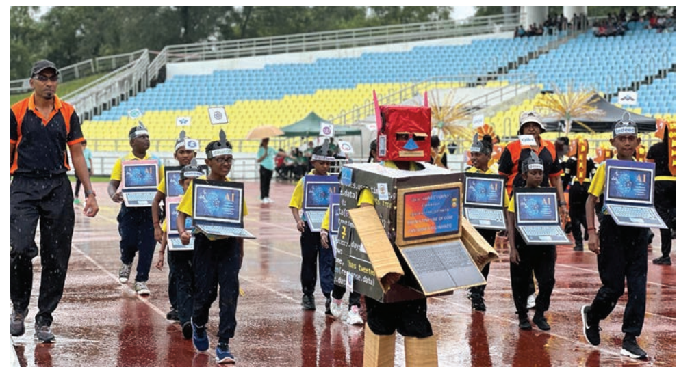
தொழில்நுட்பத்தை கருப்பொருளாகக் கொண்டு மாணவர்கள் அணிவகுப்பில் பங்கெடுத்தனர்.