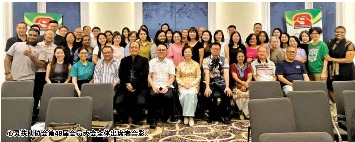
心灵扶助协会第48届会员大会全体出席者合影。