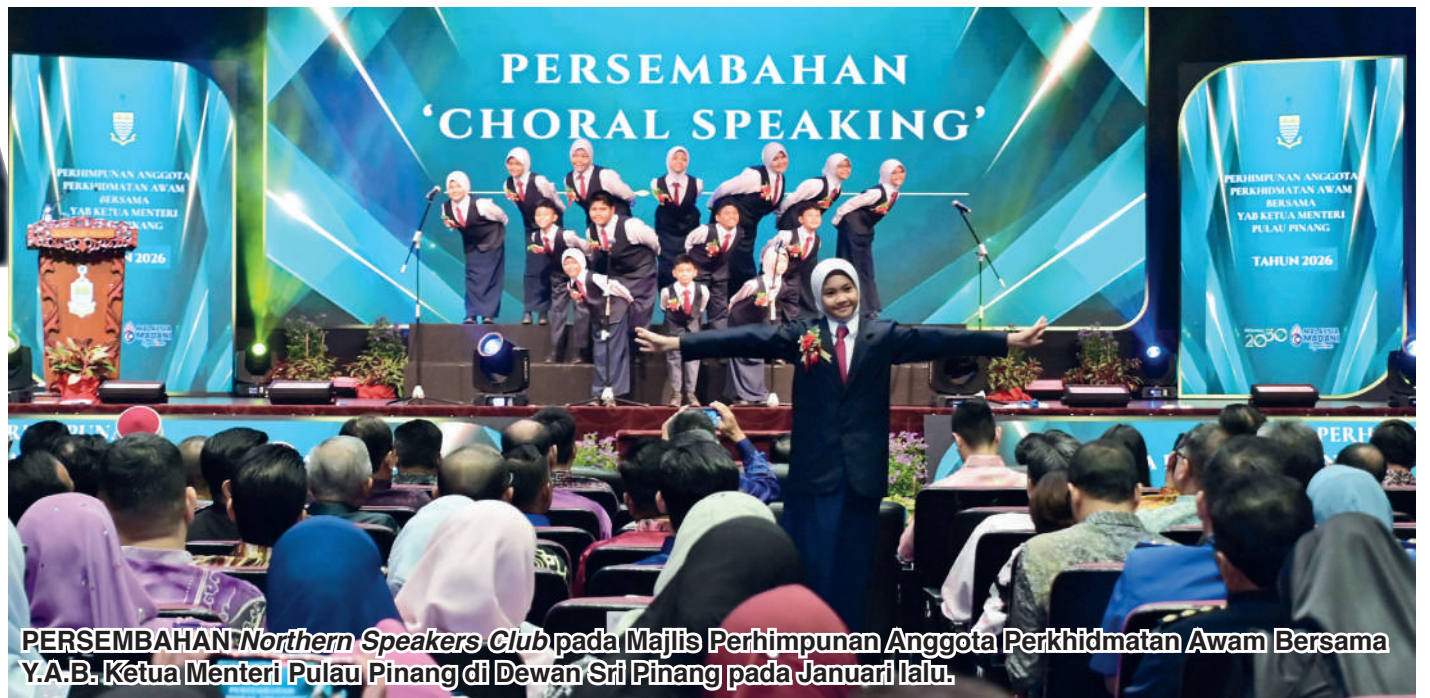
PERSEMBAHAN Northern Speakers Club pada Majlis Perhimpunan Anggota Perkhidmatan Awam Bersama Y.A.B. Ketua Menteri Pulau Pinang di Dewan Sri Pinang pada Januari lalu.

Mengulas mengenai undangan membuat persembahan choral speaking pada Majlis Perhimpunan Anggota Perkhidmatan Awam bersama Y.A.B. Ketua Menteri Pulau Pinang di Dewan Seri Pinang pada 22 Januari lalu, rata-rata guru SK Kongsi menyifatkannya sebagai satu penghormatan besar.