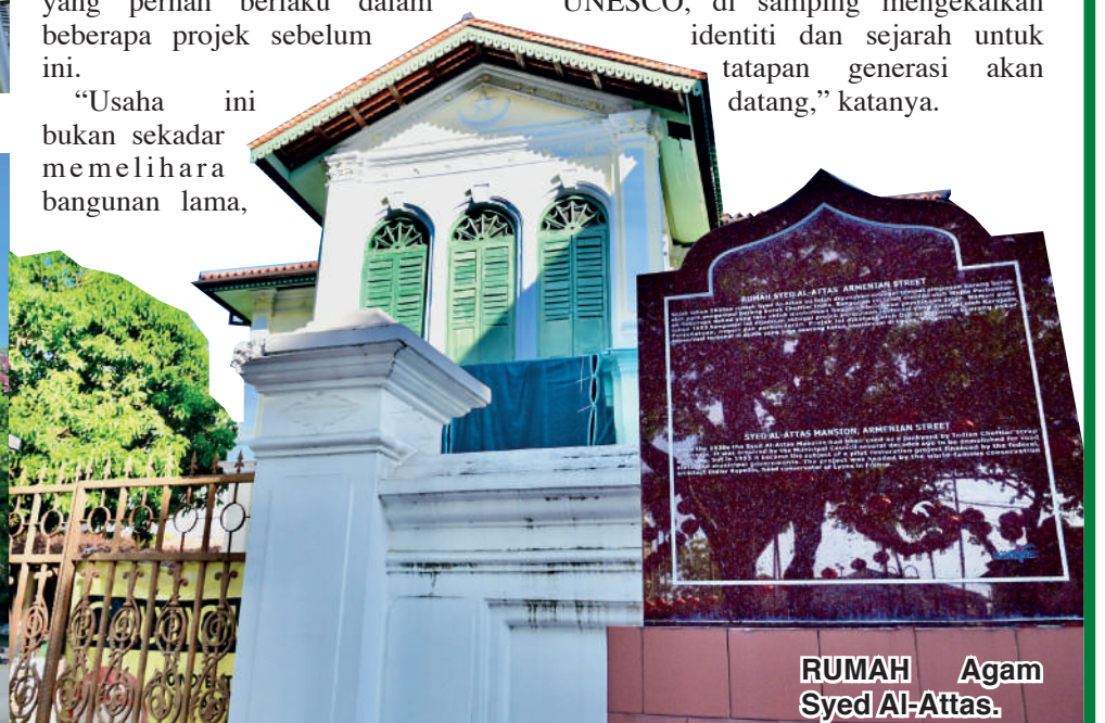
RUMAH Agam Syed Al-Attas.