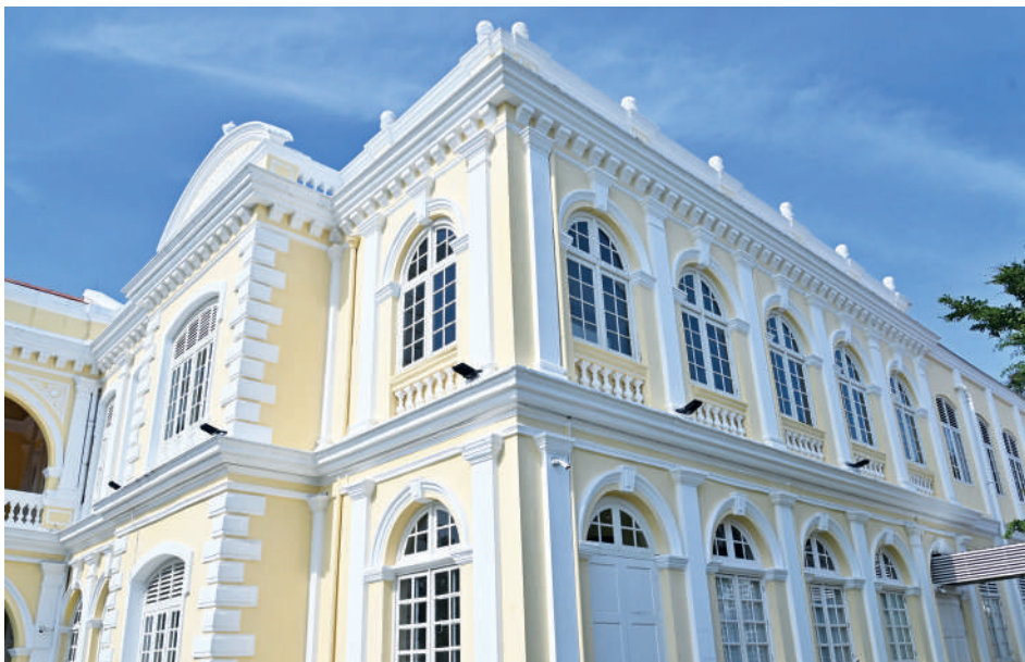
DEWAN Bandaran MBPP dekat Padang Kota Lama.

tetapi juga memartabatkan George Town sebagai Tapak Warisan Dunia UNESCO, di samping mengekalkan identiti dan sejarah untuk tatapan generasi akan datang,” katanya.