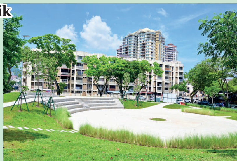
PEMANDANGAN Taman Kejiranan Lengkok Nipah yang ditambah baik dan menjadi kawasan riadah untuk semua lapisan usia.

“Jadi selepas perbincangan dengan MBPP, mereka bersetuju untuk naik taraf taman ini supaya lebih mesra warga emas serta merupakan yang pertama seumpamanya di Pulau Pinang dan mungkin juga di dalam negara,” ujarnya.