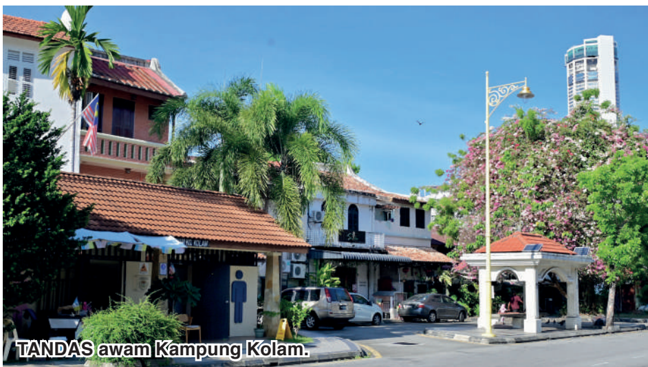
TANDAS awam Kampung Kolam.