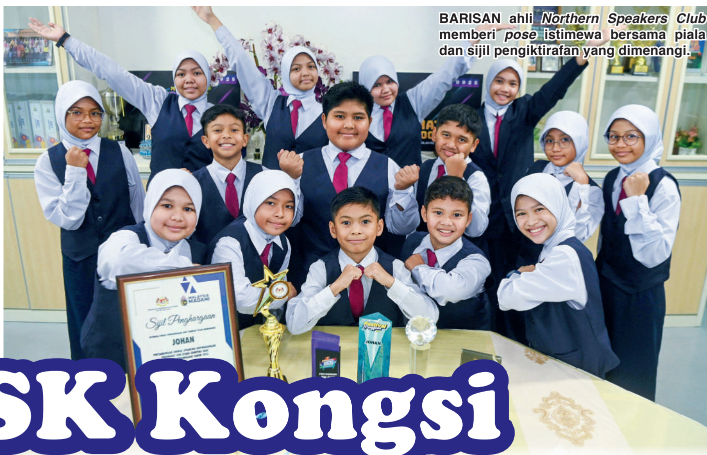
BARISAN ahli Northern Speakers Club memberi pose istimewa bersama piala dan sijil pengiktirafan yang dimenangi.

Sejak itu, sekolah berkenaan terus melakar kecemerlangan apabila turut unggul dalam pertandingan anjuran Kementerian Perdagangan Dalam Negeri dan Kos Sara Hidup (KPDN) serta Kementerian Pendidikan (KPM).