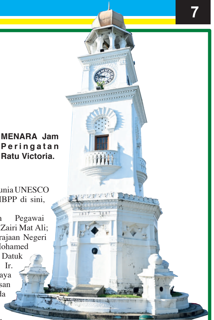
MENARA Jam Peringatan Ratu Victoria.

“Usaha ini bukan sekadar memelihara bangunan lama,