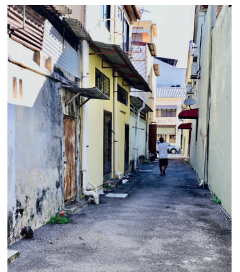
LORONG belakang Lebuhraya Carnarvon – Lebuhraya Melayu.

tetapi juga memartabatkan George Town sebagai Tapak Warisan Dunia UNESCO, di samping mengekalkan identiti dan sejarah untuk tatapan generasi akan datang,” katanya.