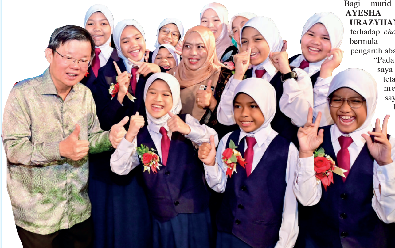
GAYA bersahaja ahli-ahli Northern Speakers Club bersama-sama Ketua Menteri yang sempat dirakam lensa baru-baru ini.

Kejayaan SK Kongsi membuktikan bahawa dengan bimbingan guru yang komited, sokongan ibu bapa dan kesungguhan murid, sekolah luar bandar juga mampu mencipta kecemerlangan di pentas kebangsaan.