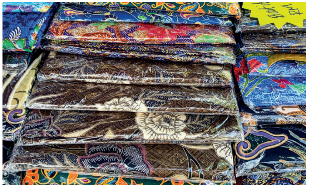
PELBAGAI corak kain batik yang menjadi koleksi jualan di reruai miliknya.