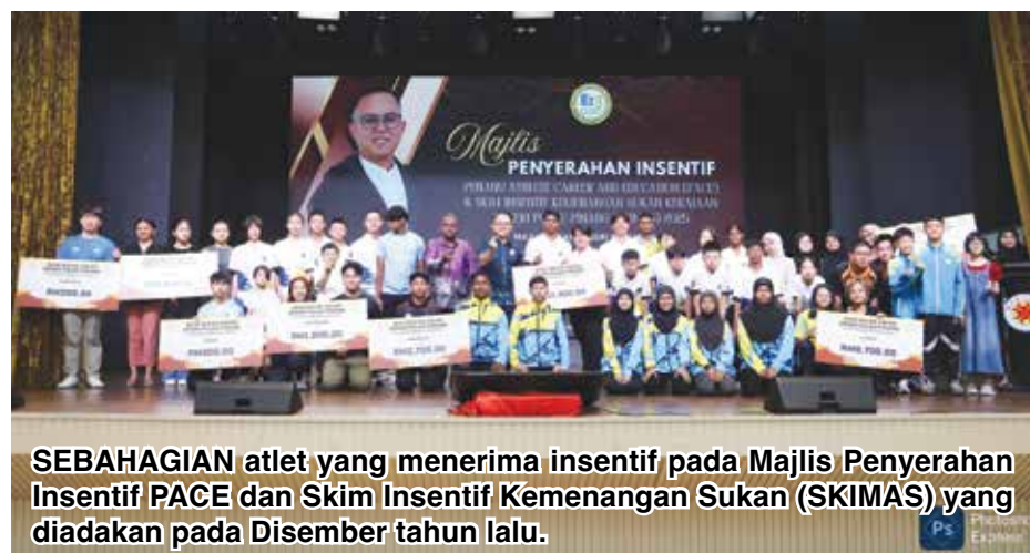
SEBAHAGIAN atlet yang menerima insentif pada Majlis Penyerahan Insentif PACE dan Skim Insentif Kemenangan Sukan (SKIMAS) yang diadakan pada Disember tahun lalu.

“Selain itu, penekanan turut diberikan kepada aspek pendedahan pertandingan, latihan intensif, ketahanan mental serta pemakanan yang seimbang, di samping pelaksanaan program pembangunan atlet secara berterusan,” ujar beliau kepada wartawan Buletin Mutiara, SUNARTI YUSOFF dan jurugambar, ALISSALA THIAN ketika ditemui di pejabat beliau