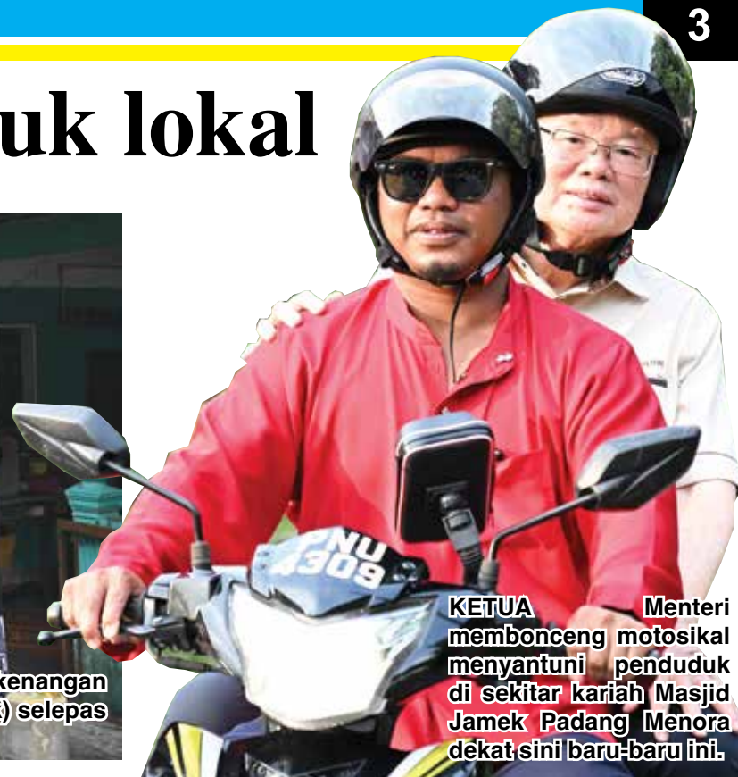
KETUA Menteri membonceng motosikal menyantuni penduduk di sekitar kariah Masjid Jamek Padang Menora dekat sini baru-baru ini.

Oleh : ZAINULFAQAR YAACOB