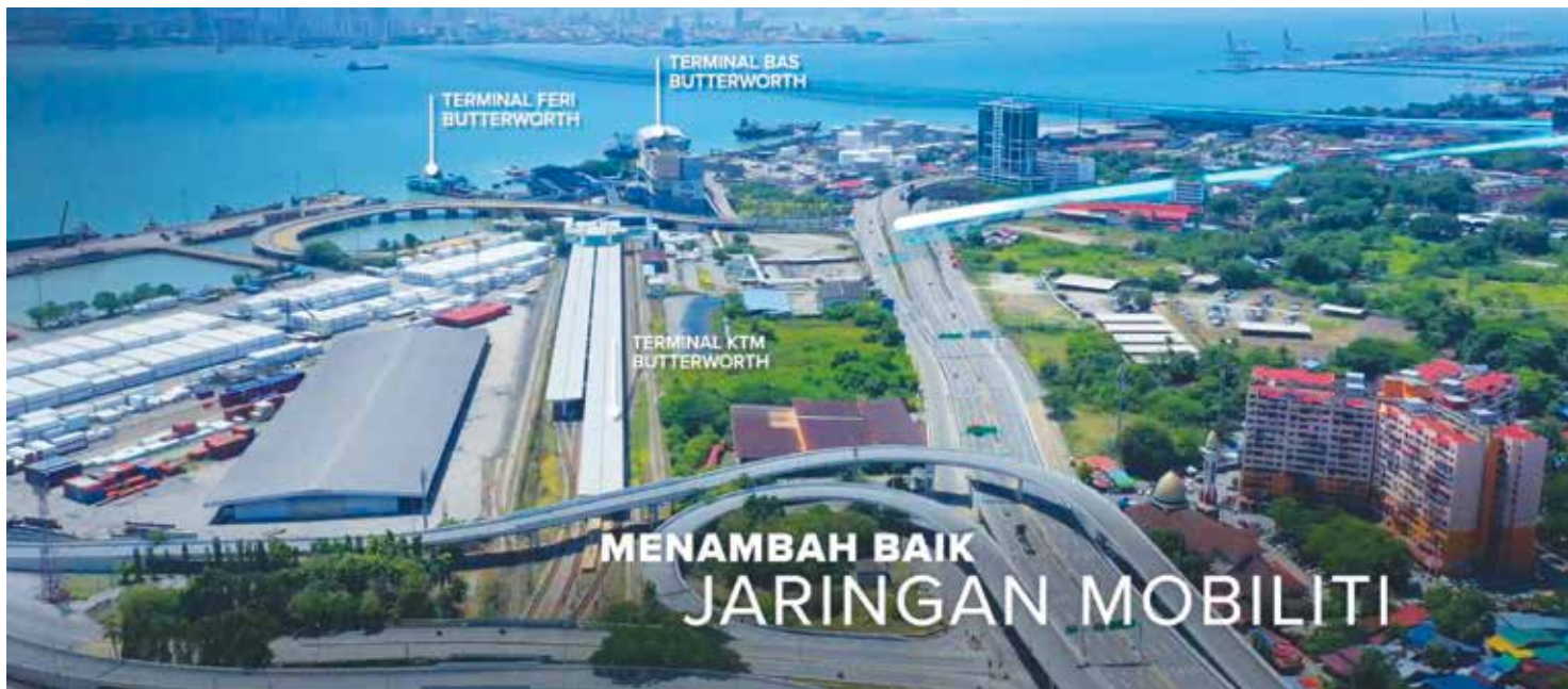
ILUSTRASI artis menunjukkan kedudukan terminal pengangkutan bersepadu di Butterworth yang akan menambah baik jaringan mobiliti di negeri ini.

Difahamkan, operasi LRT Laluan Mutiara disasarkan bermula pada Disember 2031, dengan Penang Sentral berperanan sebagai hab utama dan