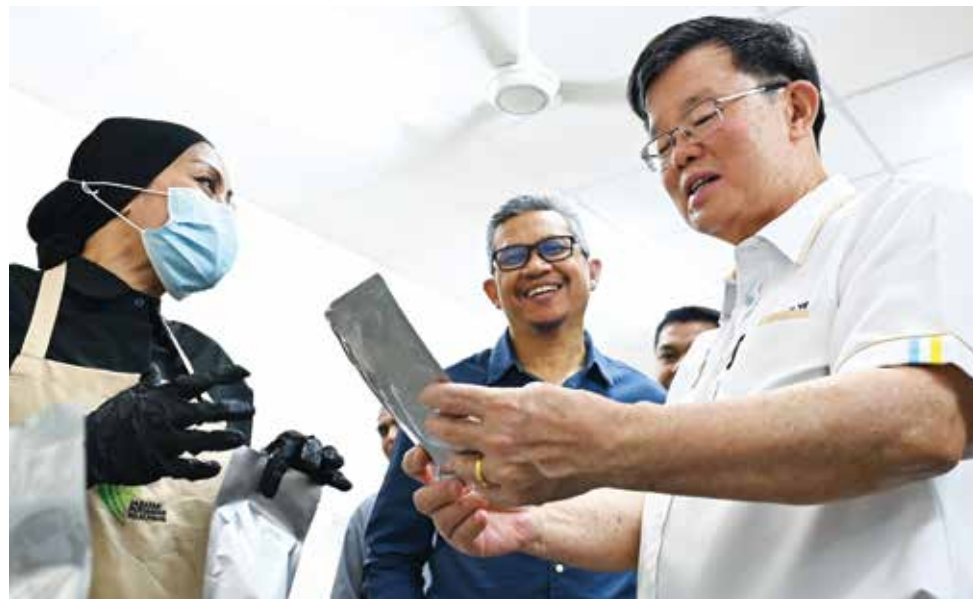
KETUA Menteri menyantuni salah seorang usahawan tempatan ketika sesi lawatan ke Dapur Sentral iTEKAD Daerah Timur Laut di sini pada 14 Mac lalu.

“Inisiatif ini bukan sekadar menyediakan ruang memasak, malah merangkumi ekosistem lengkap termasuk bimbingan teknikal daripada pakar industri serta latihan praktikal pembuatan makanan.