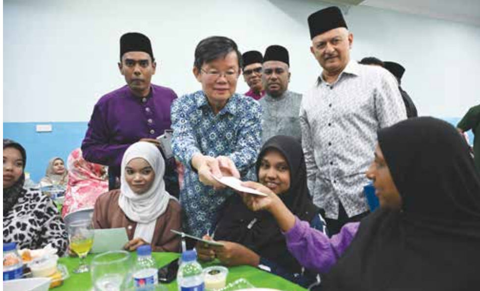
KETUA Menteri menyantuni dan menyampaikan duit raya kepada tetamu yang hadir pada Majlis Bantuan Hari Raya Aidilfitri dan Majlis Berbuka Puasa Gani Famous Pasembur Tahun 2026 di sini baru-baru ini.

" Gani Famous Pasembur merupakan antara contoh kejayaan perniagaan makanan warisan negeri yang kini diwarisi generasi ketiga, membuktikan komitmen tinggi dalam mengekalkan keaslian serta kualiti makanan tradisi yang menjadi kebanggaan kita," jelas beliau semasa berucap pada Majlis Bantuan Hari Raya Aidilfitri dan Majlis