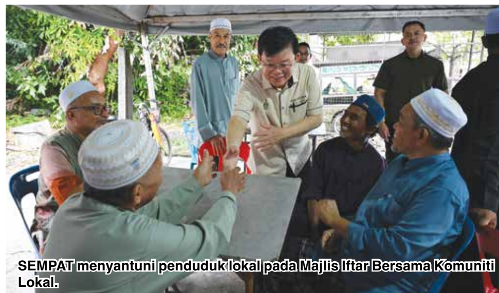
SEMPAT menyantuni penduduk lokal pada Majlis Iftar Bersama Komuniti Lokal.

“Mana-mana agensi berkaitan perlu mengambil langkah penyelesaian secara pantas dan berhemah apabila timbul sesuatu isu pada peringkat akar umbi,”