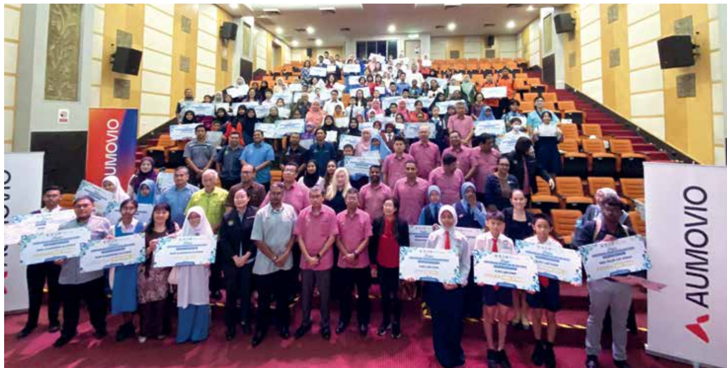
BARISAN pelajar dan guru yang menerima pengiktirafan sempena penganjuran Anugerah Sekolah Hijau Peringkat Seberang Perai 2025 merakam momen bersama penganjur sejurus majlis berkaitan di sini.

Tambah beliau, kerjasama erat antara murid, guru dan kakitangan sekolah