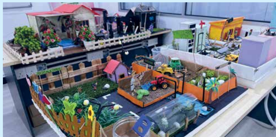
MODEL rekaan yang dipertaruhkan pada WRG 2025 di Taiwan.

"Berdasarkan pengalaman Pulau Pinang sejak 2008, sekolah SJKT