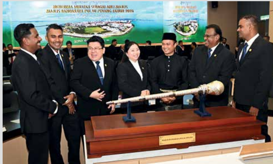
BARISAN muka baharu Ahli Majlis MBPP 2026 bersedia menggalas amanah.

Tambah beliau, bagi lantikan ini, fokus utama adalah kepada pengurusan dan pembangunan