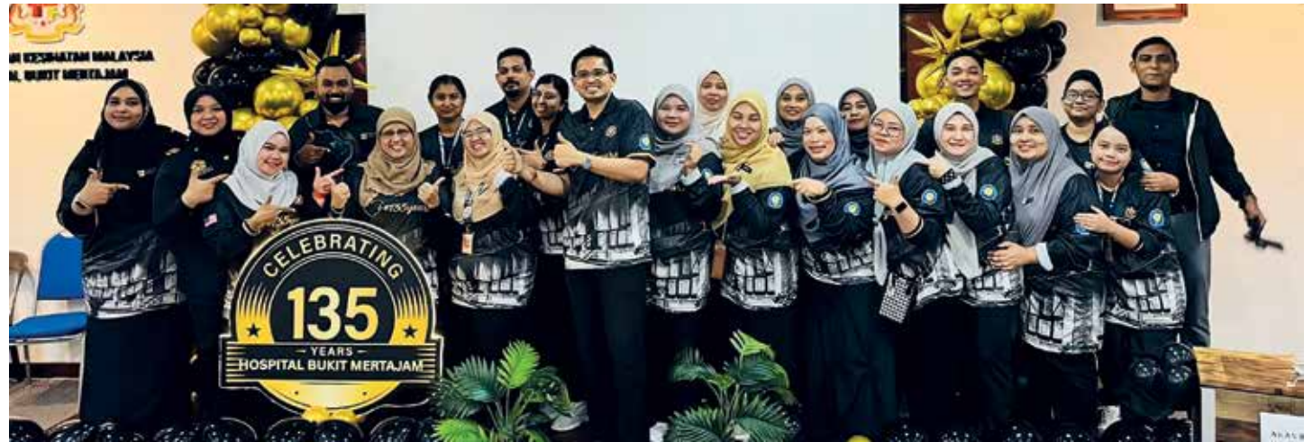
MERAIKAN ulang tahun ke-135 Hospital Bukit Mertajam baru-baru ini.