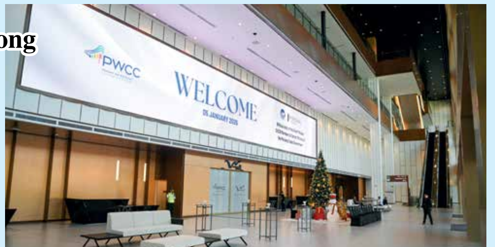
SALAH satu sudut menarik dan selesa yang terdapat di PWCC.

"Ia (pembukaan pusat membeli belah di PWCC) bukan isu lambakan kerana setiap lokasi mempunyai