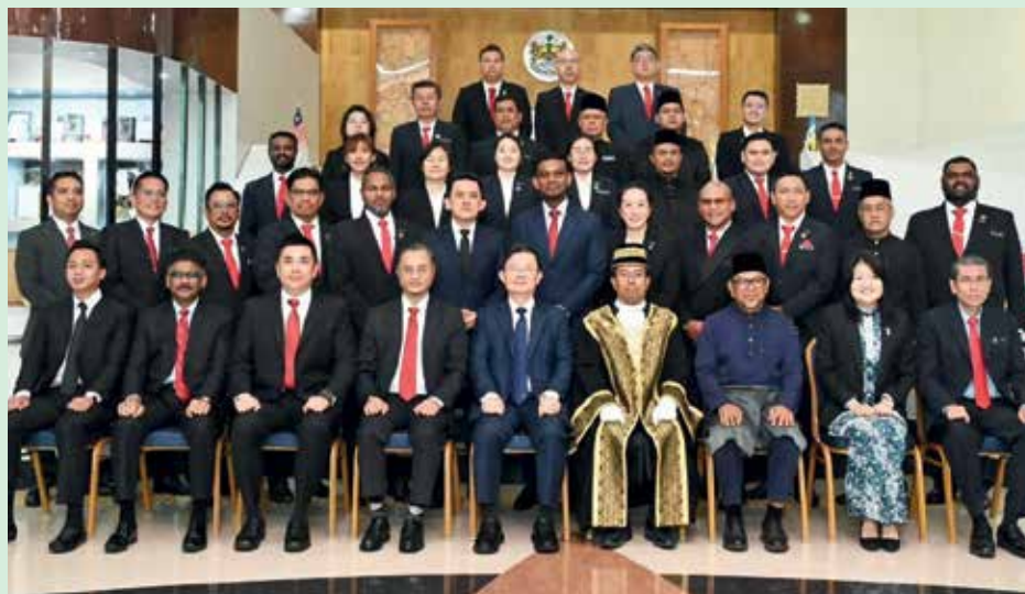
BARISAN Ahli Majlis MBSP 2026 merakam gambar kenangan bersama Ketua Menteri dan barisan kepimpinan negeri pada Majlis Angkat Sumpah dan Penerimaan Jawatan Ahli Majlis, 2 Januari lalu.