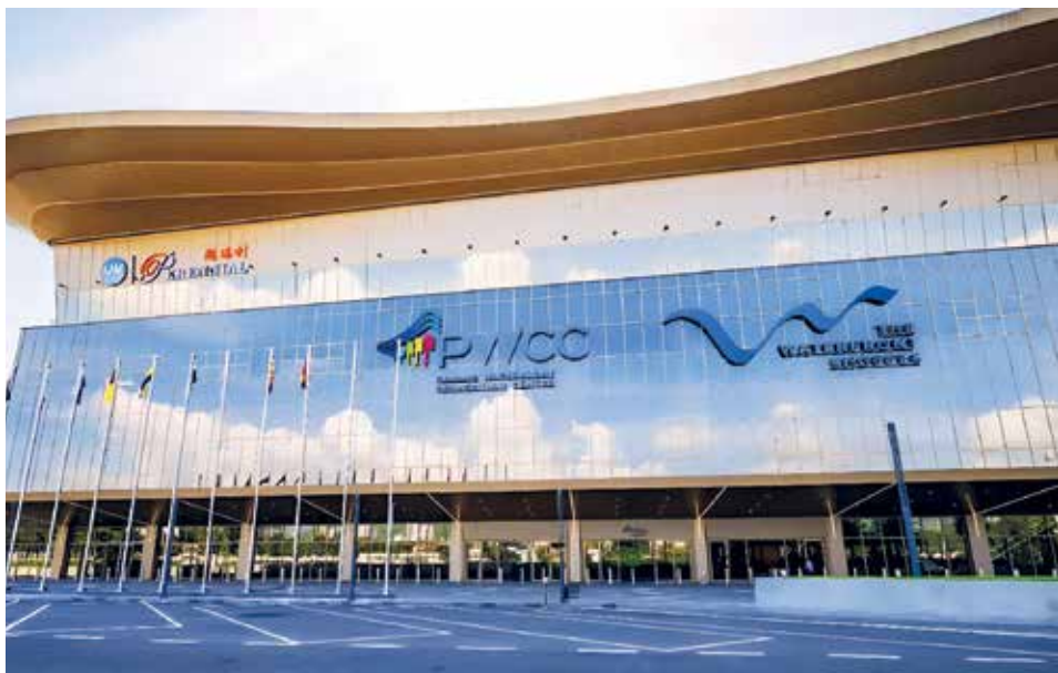
PWCC kini menjadi fasiliti penganjuran acara MICE terbaharu di negeri ini.