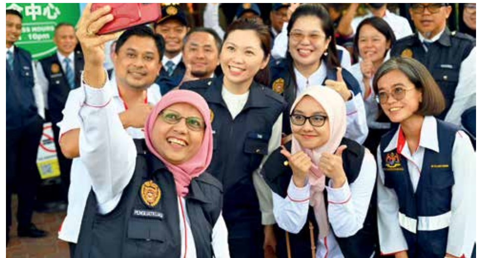
POSE santai bersama pasukannya ketika menyertai salah satu acara turun padang pada tahun lepas..

“Jangan bersendirian kerana kita perlu ada sokongan, dan sebab itu saya selalu berpesan supaya kita kena ada masa untuk orang lain, kita tidak tahu bila pula