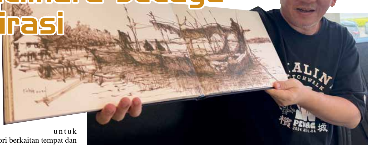
FRANKIE Chin Swee Ching menunjukkan salah satu karya seni yang dihasilkan ketika ditemui baru-baru ini.

tempatan yang tidak selesa jika kita melukis rumah mereka tanpa kebenaran.