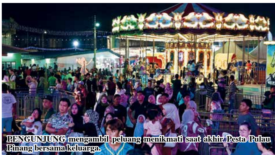
PENGUNJUNG mengambil peluang menikmati saat akhir Pesta Pulau Pinang bersama keluarga.

pun saya sedang menunggu anak dan cucu tiba untuk berjalan sama-sama, jadi suasana pesta ini memang meriah untuk dinikmati ramai.