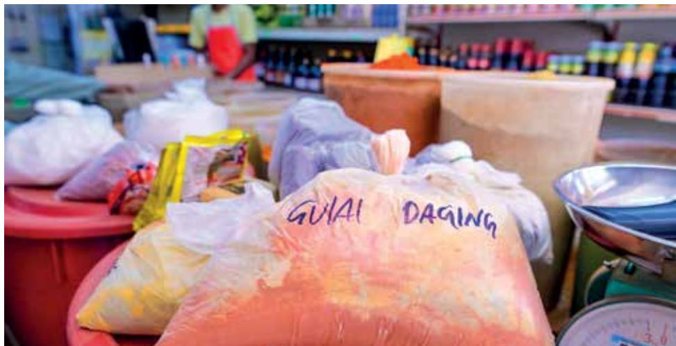
REMPAH yang telah siap dibungkuskan mengikut kehendak pelanggan.

Tambah beliau, semua campuran rempah-ratus masih menggunakan sukatan dan resipi asli arwah ayahnya yang kekal digemari sehingga kini, selain beberapa resipi baharu hasil inovasi sendiri.