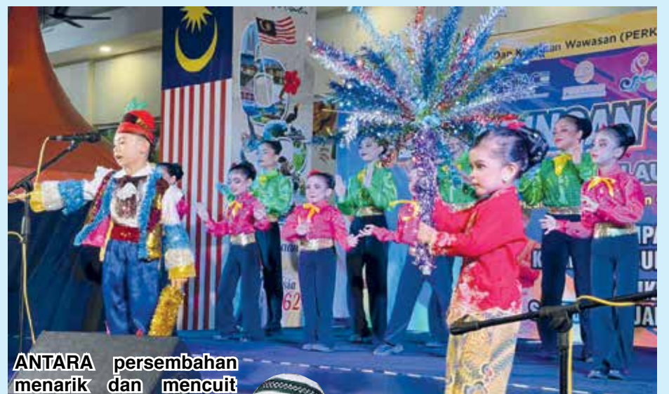
ANTARA persembahan menarik dan mencuit hati yang dipamerkan oleh peserta yang mengambil bahagian.

kumpulan boria veteran Boria Klasik Mutiara. Beliau juga aktif sebagai pelakon sketsa boria dan sering dijemput sebagai juri pertandingan boria.