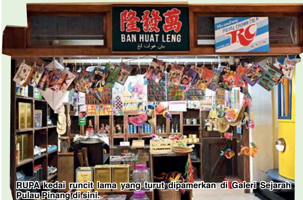
RUPA kedai runcit lama yang turut dipamerkan di Galeri Sejarah Pulau Pinang di sini.

"Usaha berterusan ini diharap dapat memastikan galeri tersebut kekal relevan sebagai pusat rujukan sejarah serta tarikan pelancongan berteraskan pendidikan di negeri ini," ujarnya menutup bicara.