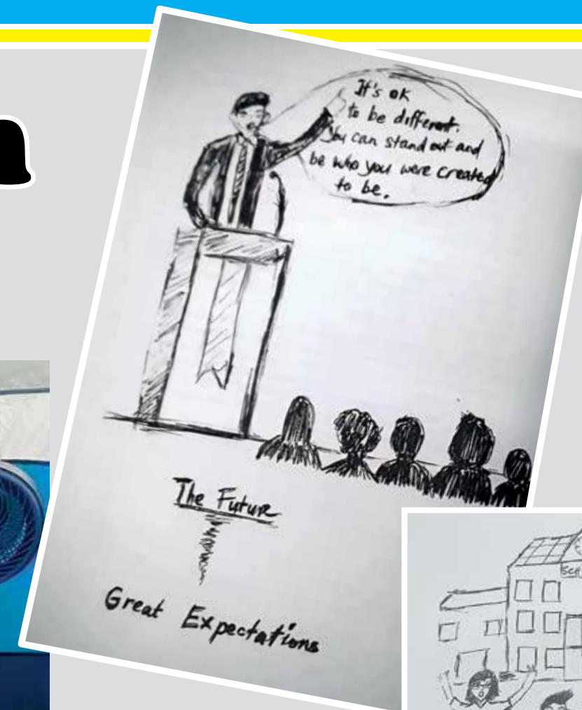
ANNTARA ilustrasi yang terdapat di dalam buku From Anne to Zac .