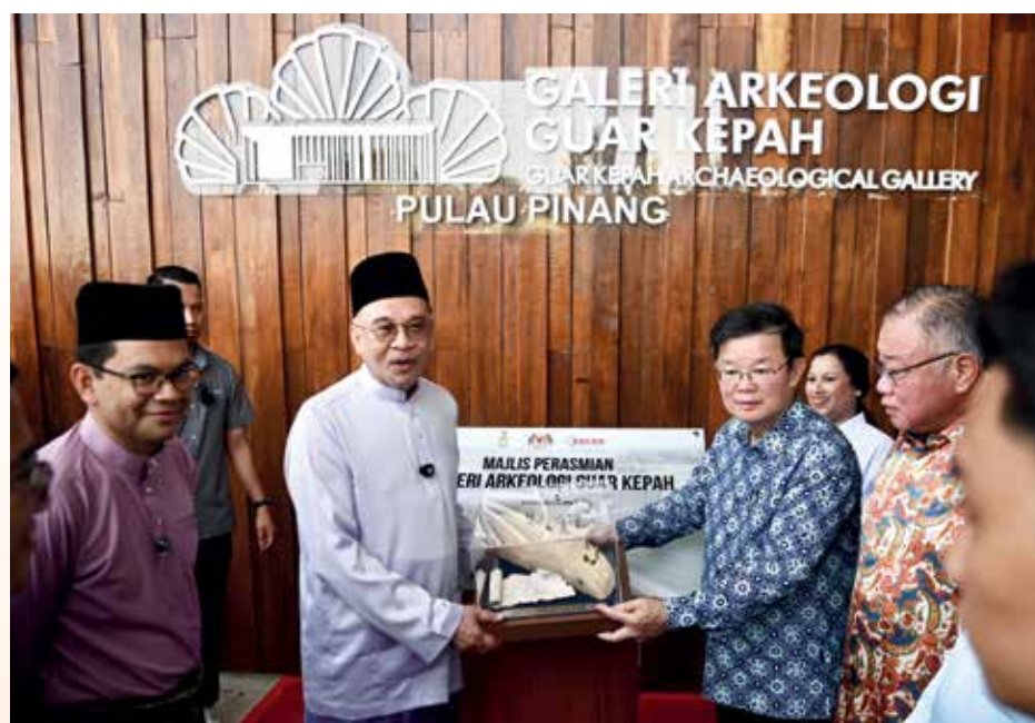
KETUA Menteri (berbatik biru) menyerahkan replika artifak warisan arkeologi Bukit Cengkerang kepada Perdana Menteri (tiga dari kiri) sebagai simbolik pada Majlis Perasmian Galeri Arkeologi Guar Kepah di sini baru-baru ini.