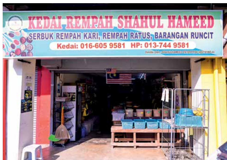
KEDAI Rempah Shahul Hameed yang terletak di Kepala Batas.

"Fleksibiliti ini mungkin menjadikan kedai kami sebagai pilihan utama pelanggan, bukan sahaja untuk kegunaan harian, malah untuk