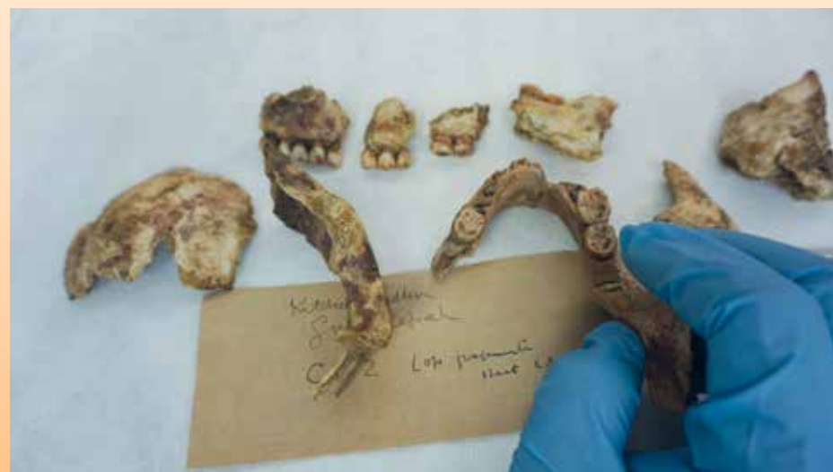
ARTIFAK berbentuk rahang manusia yang ditemui di tapak arkeologi Guar Kepah turut dipamerkan di galeri tersebut.

“Tapak Arkeologi Guar Kepah juga merupakan tapak arkeologi pertama negara yang diwartakan di bawah Akta Warisan Kebangsaan 2005 dan wajar dipelihara mengikut piawaian antarabangsa.