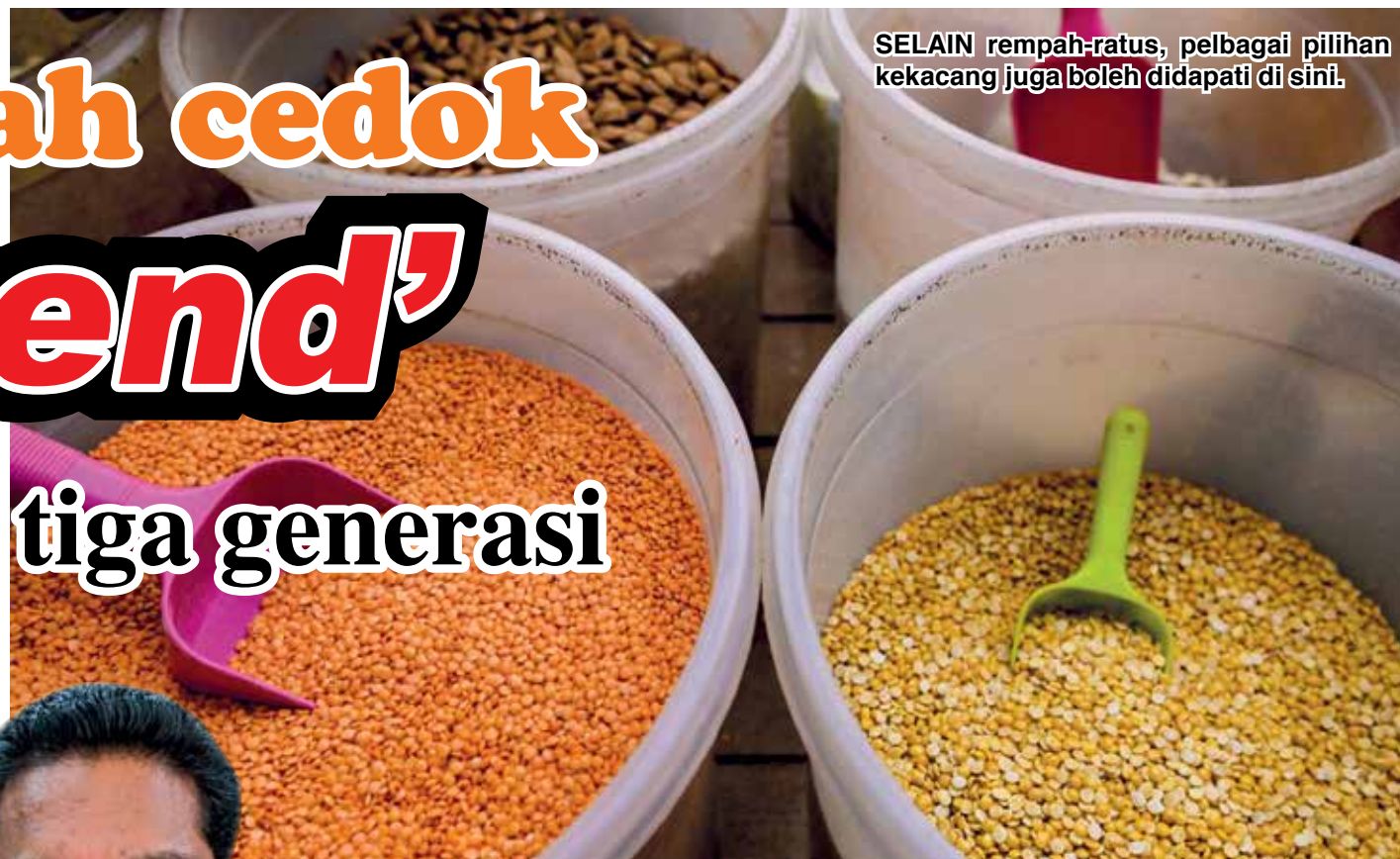
SELAIN rempah-ratus, pelbagai pilihan kekacang juga boleh didapati di sini.

"Pelanggan hanya perlu memaklumkan jenis masakan serta kuantiti yang ingin dimasak, dan pihak kami akan menyediakan set rempah