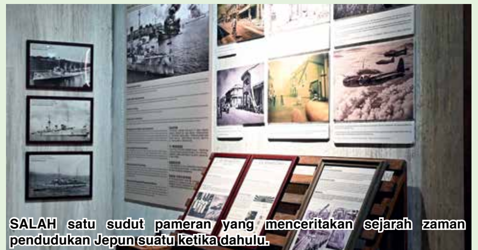
SALAH satu sudut pameran yang menceritakan sejarah zaman pendudukan Jepun suatu ketika dahulu.

Mengulas mengenai tarikan utama, beliau menyatakan bahawa Galeri Sejarah Pulau Pinang menawarkan pengalaman perjalanan sejarah imersif dengan menggabungkan penggunaan teknologi, elemen interaktif dan visual yang menarik.