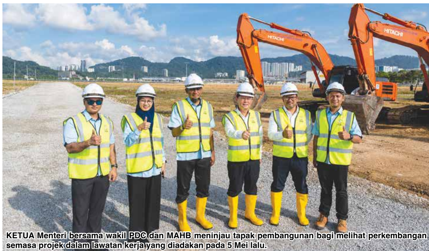
KETUA Menteri bersama wakil PDC dan MAHB meninjau tapak pembangunan bagi melihat perkembangan semasa projek dalam lawatan kerja yang diadakan pada 5 Mei lalu.

Menurut Kon Yeow, meskipun berdepan cabaran global, sektor perindustrian termasuk sektor elektrik dan elektronik (E&E) dan semikonduktor terus menunjukkan pertumbuhan positif susulan peningkatan permintaan terhadap