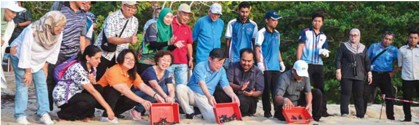
KETUA Menteri dan isteri (duduk, tiga dari kiri) bersama-sama tetamu kehormat lain tidak melepaskan peluang menyempurnakan pelepasan anak penyu ketika lawatan ke Pusat Konservasi dan Penerangan Penyu Pantai Kerachut pada 15 Mei lalu.

“Penyu mungkin tidak mampu berkata-kata, namun melalui usaha inilah kita membuktikan Pulau Pinang mempunyai rasa tanggungjawab tinggi dalam memelihara permata alam yang tidak ternilai ini,” katanya.