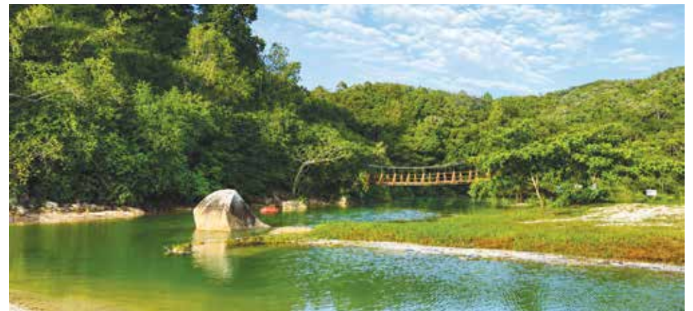
TASIK Meromiktik menjadi salah satu tarikan pengunjung yang ingin berkunjung ke Pusat Konservasi dan Penerangan Penyu melalui jalan darat.

Menurut beliau, sepanjang tempoh 2021 hingga April 2026, pusat konservasi tersebut menerima seramai 109,351