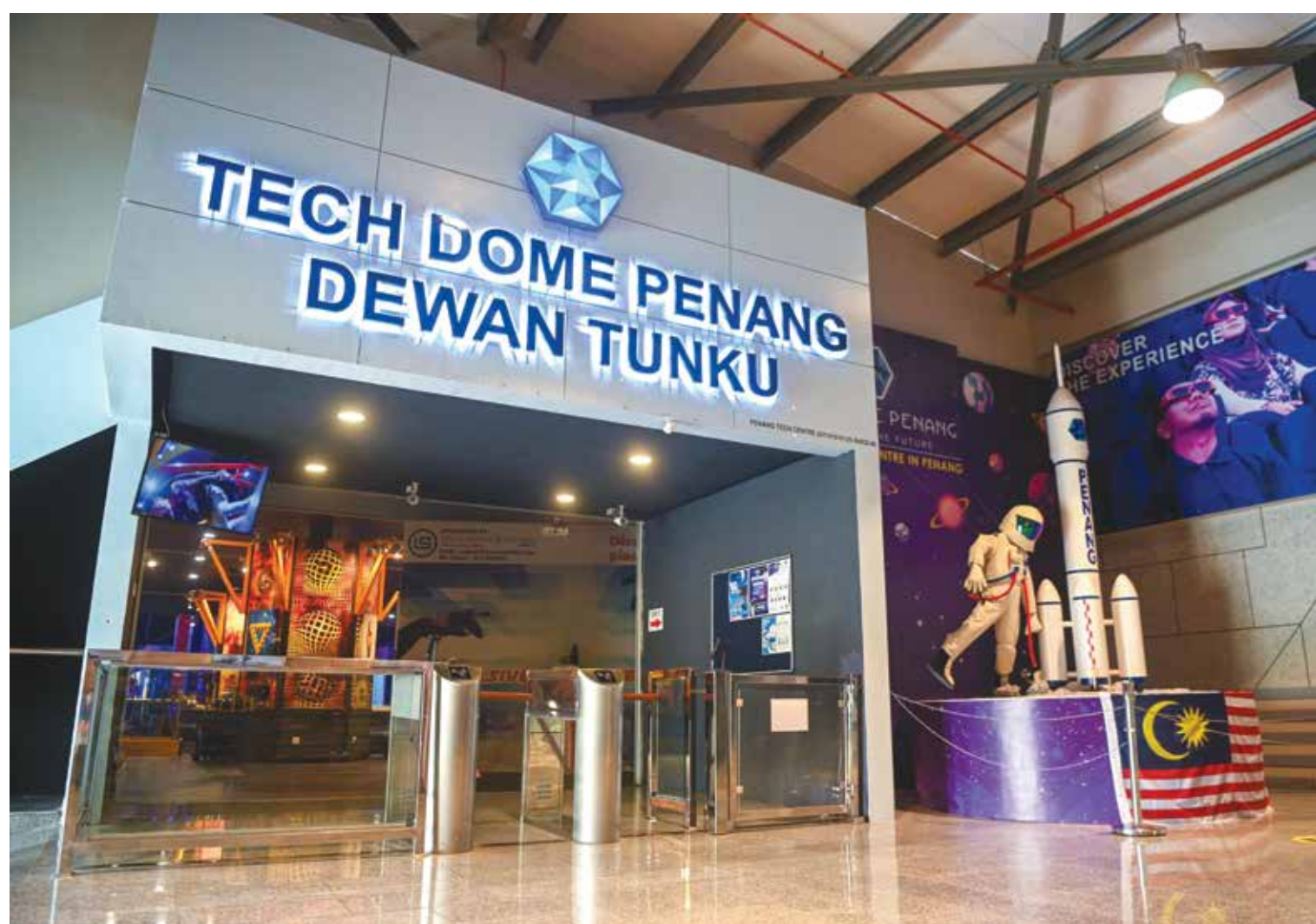
TECH Dome Penang bakal menyambut ulang tahun ke-10 tahun ini, sekali gus menandakan sedekad perannya sebagai pusat sains pertama di negeri ini.

percuma sepanjang 10 hari bermula 9 hingga 18 Julai 2026.