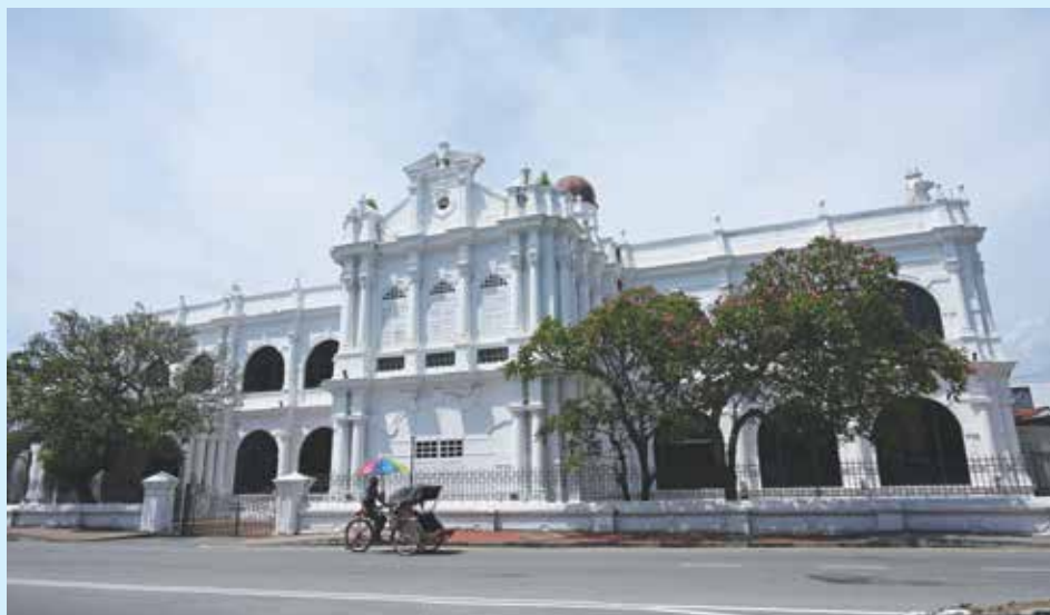
BANGUNAN Lembaga Muzium Pulau Pinang di Lebuhraya Farquhar kekal tersergam indah, mencerminkan keunikan seni bina dan nilai warisan yang tidak ternilai.