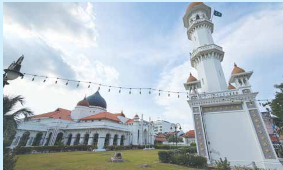
MASJID Kapitan Keling yang terletak di tengah-tengah bandar raya George Town.

Negeri yang dipengerusikan oleh Y.A.B. Ketua Menteri sebelum dibawa ke Mesyuarat Majlis Kerajaan (MMK) Negeri untuk diluluskan.