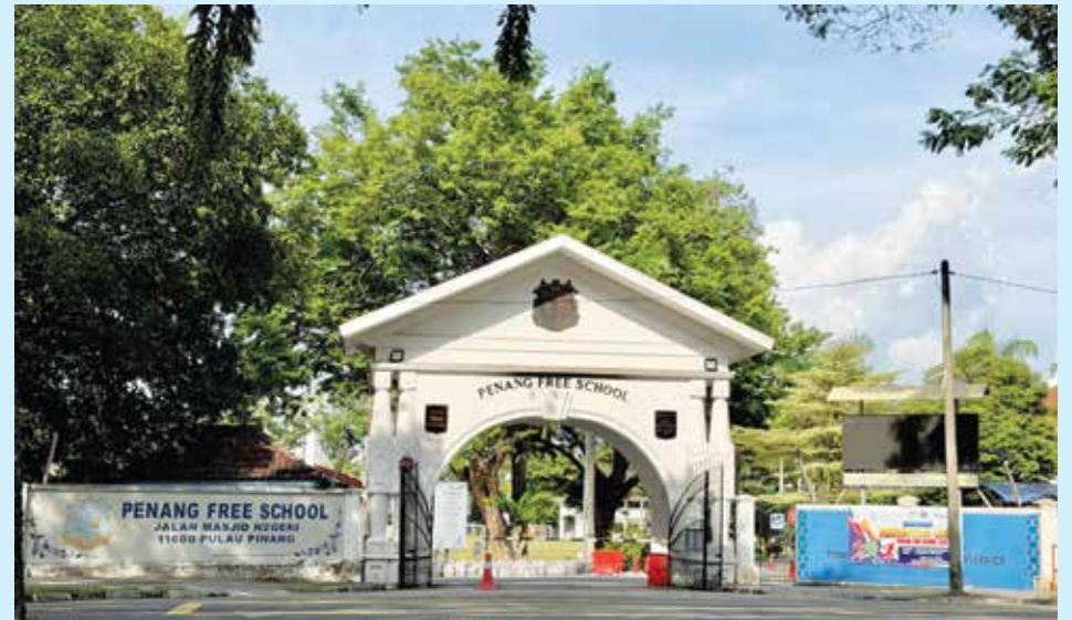
PENANG Free School, sekolah tertua di Asia Tenggara yang diasaskan pada tahun 1816, turut termasuk dalam senarai tapak warisan.