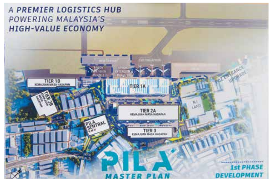
ILUSTRASI Pelan Induk PILA di Bayan Lepas yang sedang dibangunkan sebagai hab logistik moden dan strategik bagi menyokong pertumbuhan ekonomi Pulau Pinang.

Mengulas lanjut, Kon Yeow menyatakan bahawa projek berkenaan