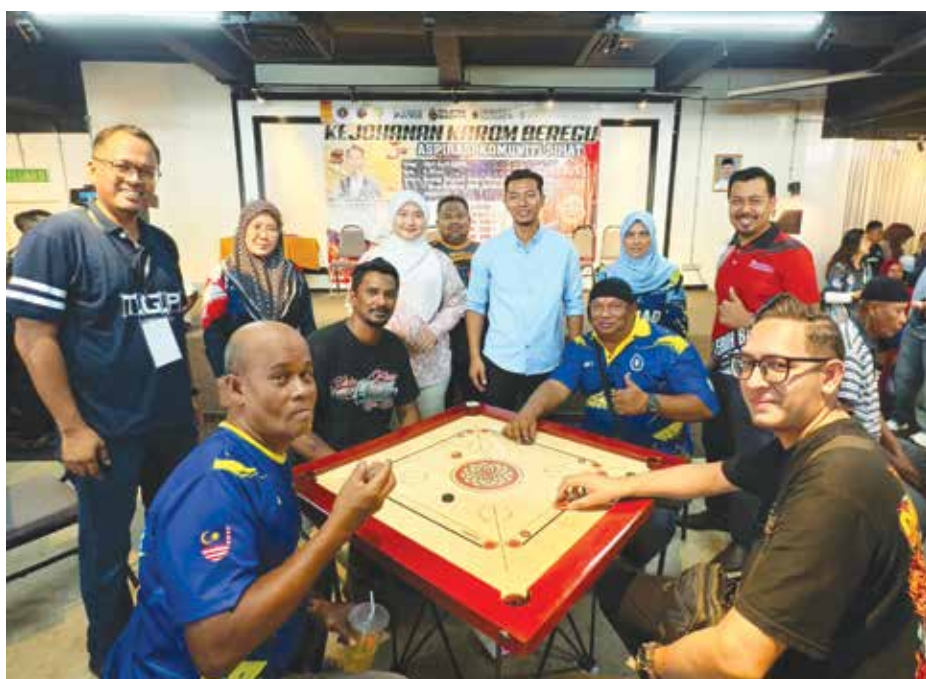
KEJOHANAN karom sempena Aspirasi Komuniti Sihat yang diadakan di Penanti pada April lalu bertujuan menggalakkan penglibatan komuniti dalam aktiviti riadah yang sihat.