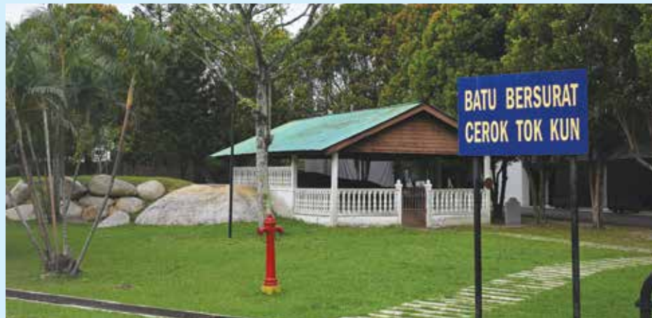
BATU Bersurat Cherok To' Kun antara 15 lokasi yang bakal diwartakan sebagai tapak warisan.

“Pelan Pengurusan ini akan bertindak sebagai garis panduan, setiap cadangan pembangunan di dalam atau di sekitar tapak warisan perlu dirujuk dan mendapat ulasan teknikal daripada Pesuruhjaya Warisan Negeri.