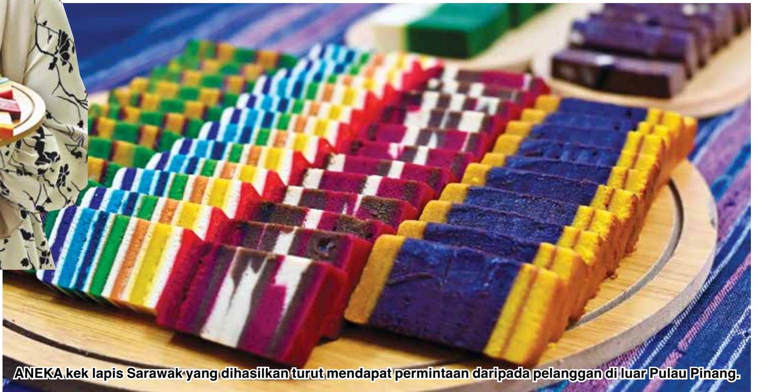
ANEKA kek lapis Sarawak yang dihasilkan turut mendapat permintaan daripada pelanggan di luar Pulau Pinang.