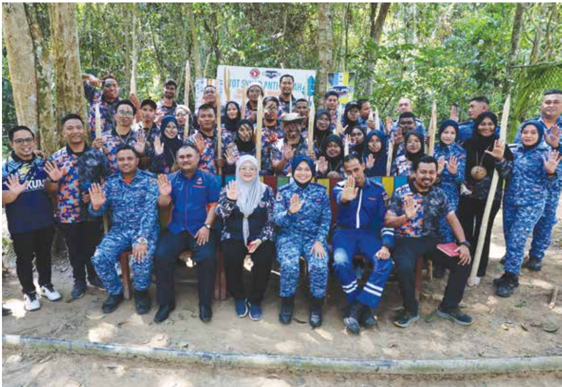
SUNGAI Muda Fun Walk yang diadakan di Bumbung Lima merupakan antara program di bawah Skuad ADK dalam usaha memupuk budaya hidup tanpa dadah.

“Pendaftaran sebagai sukarelawan boleh dibuat melalui https://skuad.aadk.gov.my , manakala untuk mengetahui program-program kesukarelawan yang kita anjurkan, boleh ke laman Facebook Skuad Antidadah Pulau Pinang,” ujarnya.