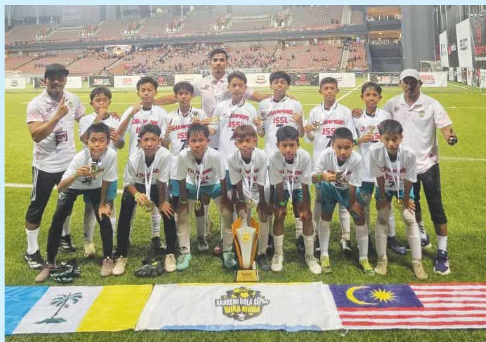
BARISAN pemain Akademi Wira Muda yang mengambil bahagian dalam kejohanan berkaitan.

“Justeru, latihan intensif sehingga empat hingga lima kali seminggu dilaksanakan, termasuk ketika bulan Ramadan,” katanya.