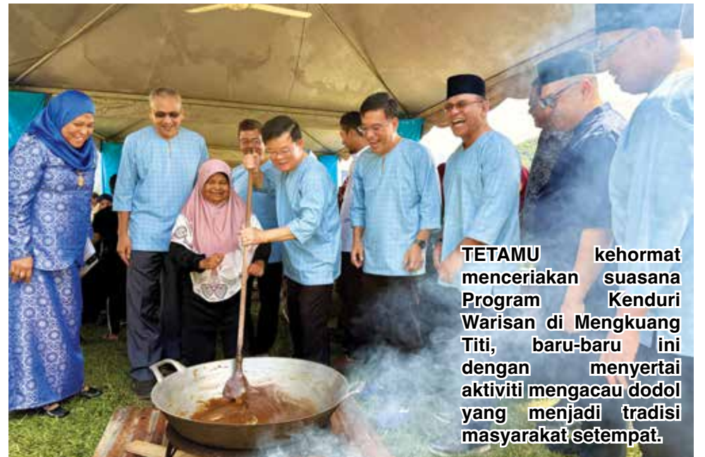
TETAMU kehormat menceriakan suasana Program Kenduri Warisan di Mengkuang Titi, baru-baru ini dengan menyertai aktiviti mengacau dodol yang menjadi tradisi masyarakat setempat.

Relic (GTH-Relic) di Gat Lebuh Acheh kini berada pada fasa akhir dan bakal menjadi hab penyelidikan warisan bertaraf antarabangsa di rantau ini.