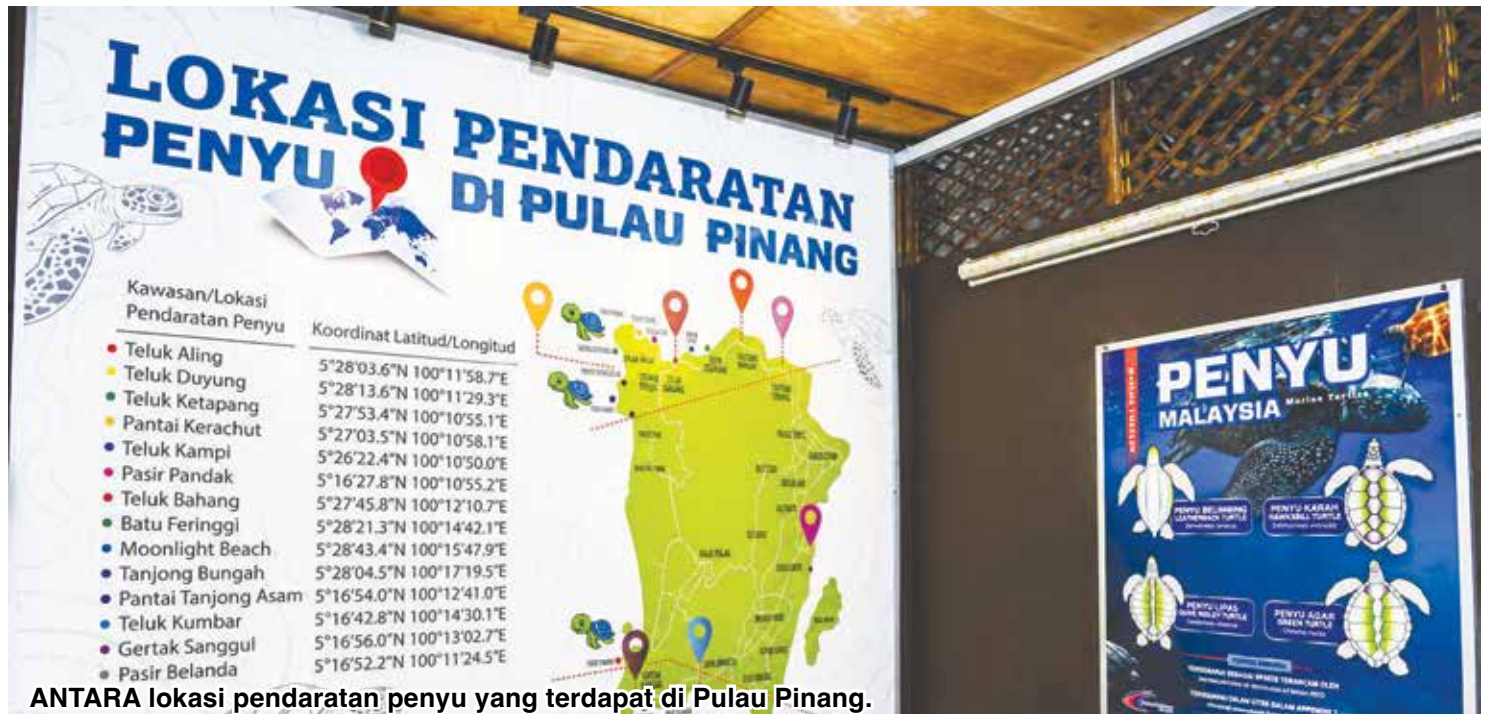
ANTARA lokasi pendaratan penyu yang terdapat di Pulau Pinang.

Buletin Mutiara dimaklumkan bahawa Jabatan Perikanan Malaysia melalui Pusat Konservasi dan Penerangan Penyu Pantai Kerachut telah menjalankan usaha