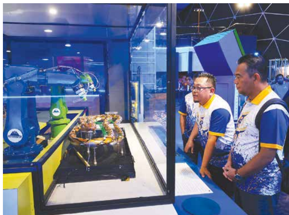
KEMUDAHAN interaktif yang disediakan membolehkan pengunjung berinteraksi secara langsung dengan bahan pameran.

Sebagai penghargaan kepada rakyat negeri ini yang telah menyokong Tech Dome sejak penubuhannya, Boo Wooi memberitahu bahawa pusat sains tersebut menawarkan 10,000 tiket kemasukan