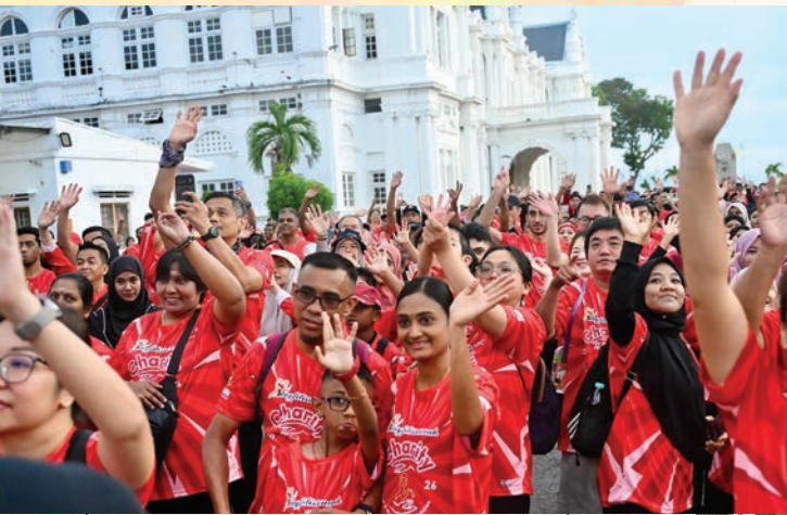
பாடாங் கோத்தாவில் நடைபெற்ற சிறுவர்கள் புற்றுநோய் 2.0 தொண்டு நடைப்பயணம், சமூகத்தை ஒன்றிணைத்து மீள்திறன் மற்றும் ஆதரவு உணர்வை ஊக்குவித்தது.