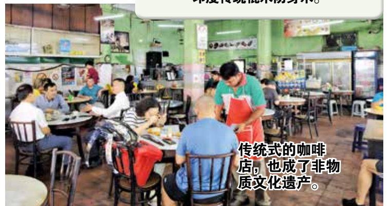
传统式的咖啡店，也成了非物质文化遗产。