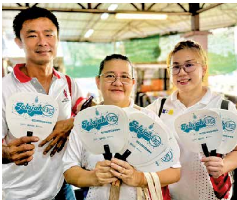
ALL SET: Some help to keep away the heat. Volunteers ready to distribute fans to marketgoers at Taman Berjaya Public Market in Nibong Tebal as they wait for the ‘Jelajah CM Chow’ event to begin.

“With continued support from the state government, plans are underway to develop another central kitchen in Central Seberang Perai, which is expected to serve all three districts in Seberang Perai and potentially be larger in scale,” he said.