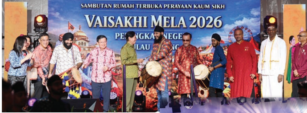
பினாங்கு மாநில அனவிலான வைசாக்கி கொண்டாட்டத்தை மாநில ஆளுநர் ரம்லி நா தாலிப், மாநில முதலமைச்சர் மேதகு சாவ் கொன் இயோவ், இரண்டாம் துணை முதலமைச்சர் ஜக்தீப் சிங் டியோ, ஆட்சிக்குழு உறுப்பினர்கள் மற்றும் முக்கிய பிரதிநிதிகள் தொடக்கி வைத்தனர்.

மலேசியாவின் உற்பத்தித் திறன் மேம்பட்டாலும், நிலையான வளர்ச்சிக்காக கூடுதல் முயற்சிகள் தேவை என அவர்