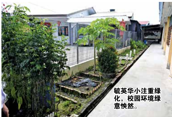
毓英华小注重绿化，校园环境绿意盎然。

放眼未来，他强调，学校将持续推动环境永续教育，毕竟学生已经具备基本的环保概念，但是最重要的是将之转化为行动。