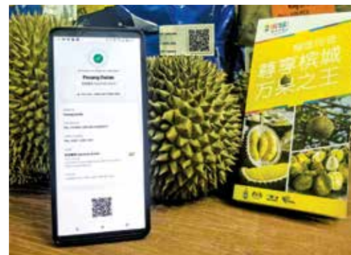
槟城榴梿二维码认证与榴梿宣传手册相辅相成，加强推广槟城榴梿旅游。

“手册内所收录的各类榴梿品种整体图与剖面示意图，真实还原其外观特征与果肉状态，方便消费者在现场摊位进行直观比对，从而更精准