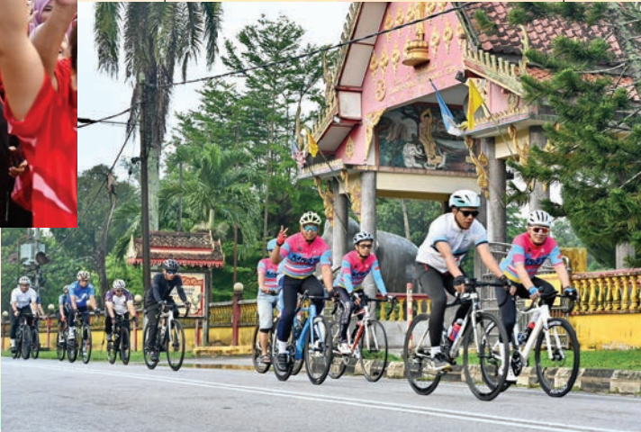
செபராங் பிறை மாநகர் கழகத்தின் ஏற்பாட்டில் நடைபெற்ற மிதிவண்டி ஓட்ட நிகழ்ச்சியில், பல்வேறு வயதினரும் ஆர்வத்துடன் கலந்து கொண்டு உற்சாகமான சூழலை உருவாக்கினர்.