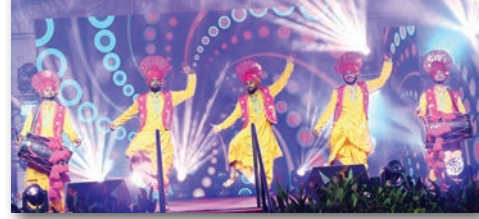
வைசாக்கி கொண்டாட்டத்தில் சீக்கியர்களின் பாரம்பரிய நடனம் இடம்பெற்றது.

ஆகியவை இதில் தென்படுகின்றன,” என்று அவர் கூறினார்.