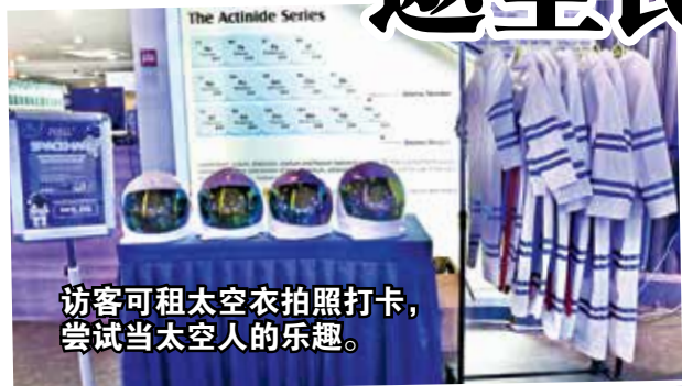
访客可租太空衣拍照打卡，尝试当太空人的乐趣。