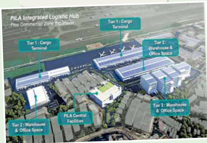
Location plan of the PILA project.

Chow said a formal launch ceremony for PILA is being planned and is expected to be officiated by Prime Minister Datuk Seri Anwar Ibrahim.