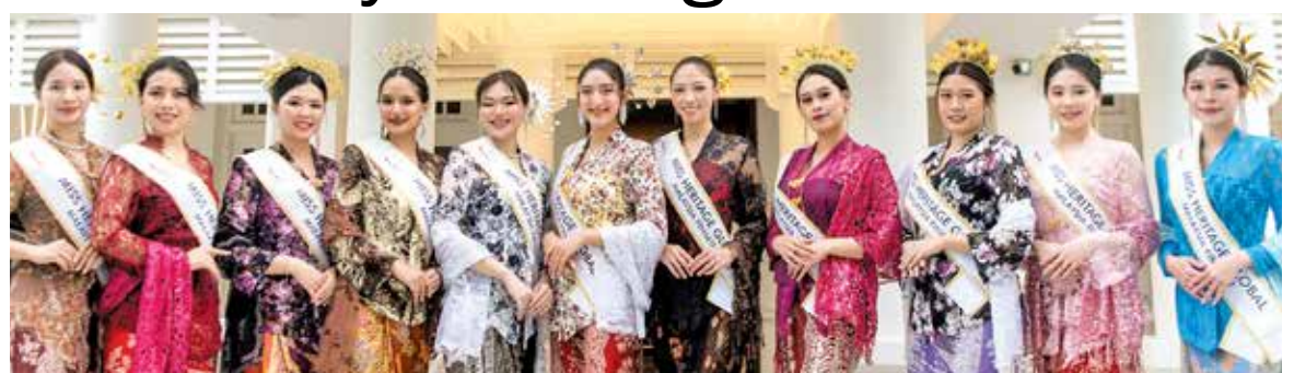
All the finalists for the Miss Heritage Global Malaysia 2026.