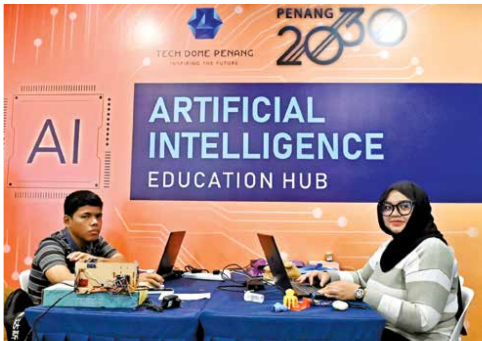
圆顶科学馆常主办工作坊，启发民众对科学的兴趣。