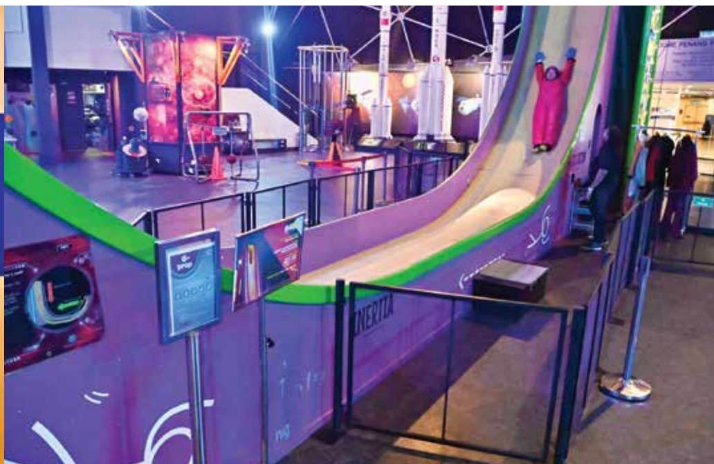
自由落体是圆顶科学馆的标志性项目。