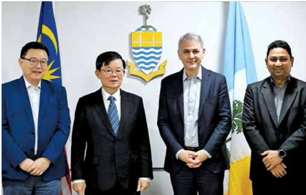
菲力斯（右2）日前礼貌拜会槟州首长曹观友（左2）。

西亚半导体生态系统发展作出贡献，尤其是在推动人工智能电力效率及数据通讯相关的化合物半导体领域。