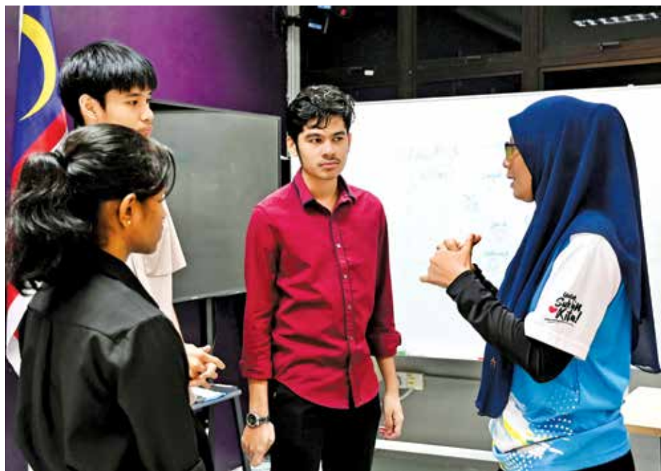
阿祖拉常给予支持与鼓励，确保学生在追求体育成绩的同时，不忽略学业基础。

她强调，这些措施的目标，是确保学生在追求体育成绩的同时，不忽略学业基础，为未来发展建立更稳固的道路。