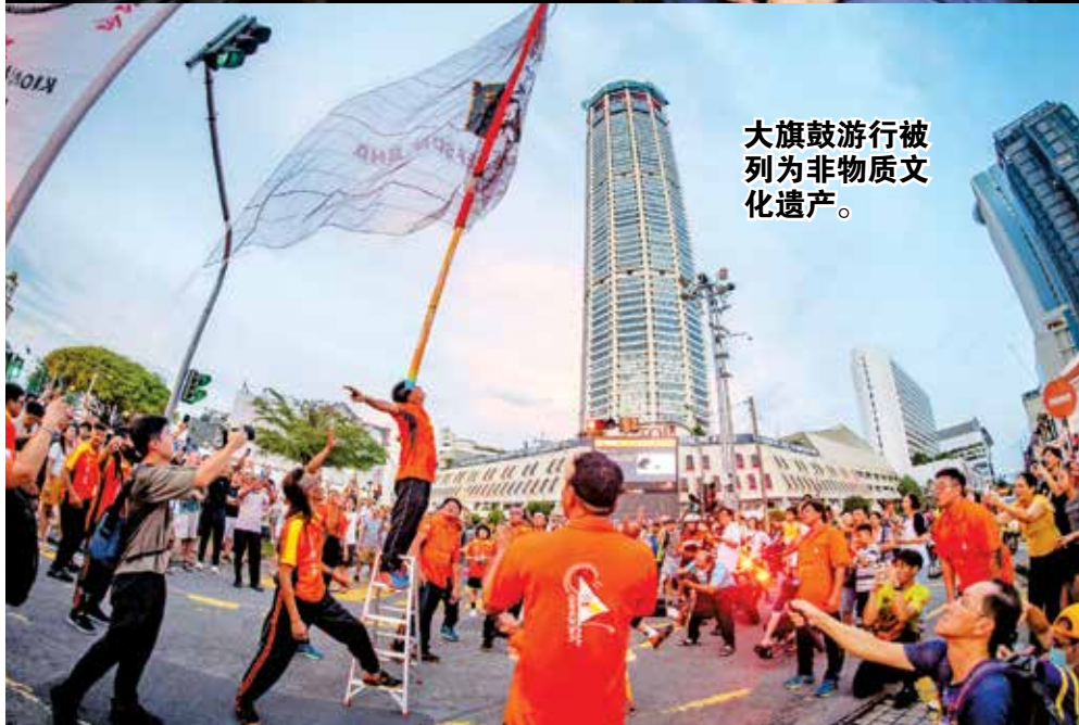
大旗鼓游行被列为非物质文化遗产。

质文化遗产》及《槟州遗产地》书籍，作为记录及整理州内文化遗产的重要文献，希望更多人能够认识，并珍惜本地丰富多元的文化遗产。无论如何，她强调，文化遗产保护工作将持续进行，积极将更多具有潜力的文化遗产、自然及考古遗址列入州级文化遗产名录。