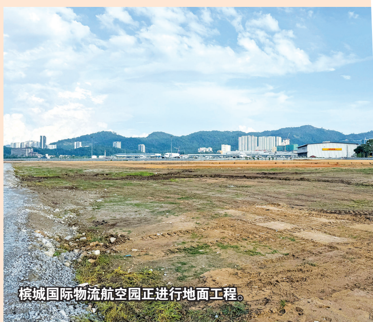
槟城国际物流航空园正进行地面工程。