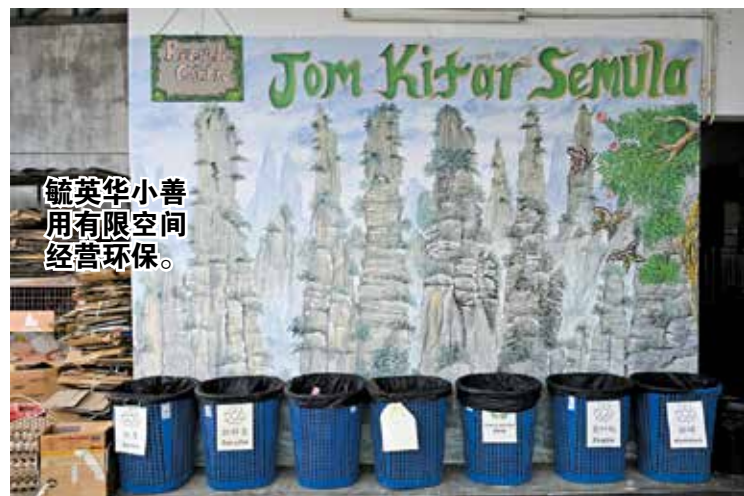
毓英华小善用有限空间经营环保。