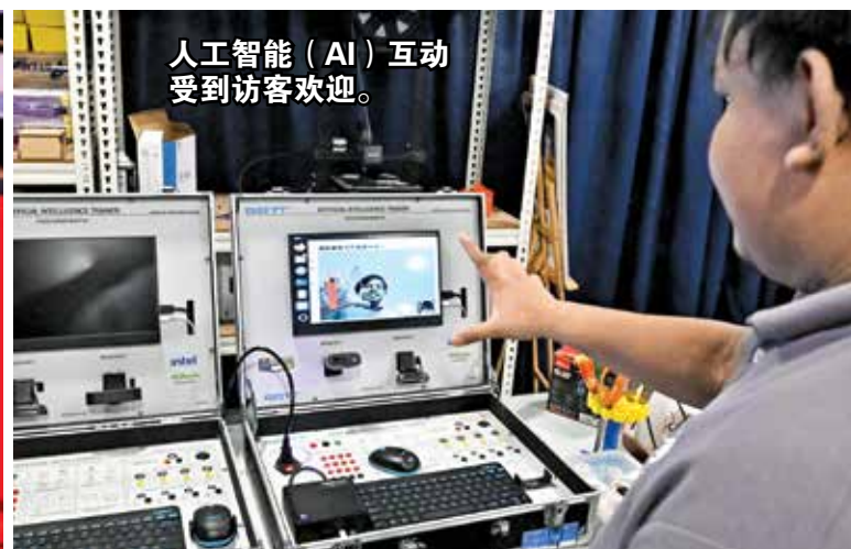
人工智能（AI）互动受到访客欢迎。