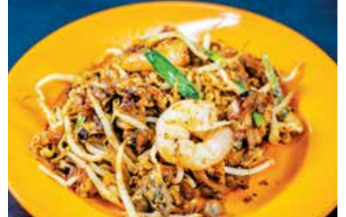
福建面、亚参叻沙、炒粿条是文化遗产美食之一。