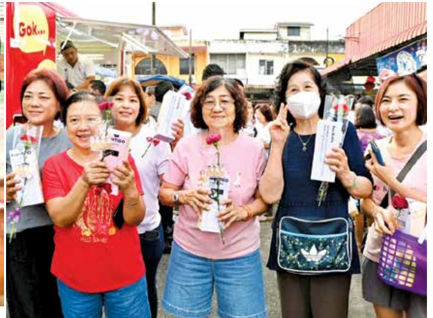
适逢母亲节，妇女们喜获康乃馨和保温瓶等礼物，喜上眉梢。

槟州首席部长曹观友表示，尽管全球局势动荡，包括中东战争等因素带来挑战，但槟州经济发展依然保持强稳，投资表现持续增长，展现州内经济基础稳固及抗压能力。