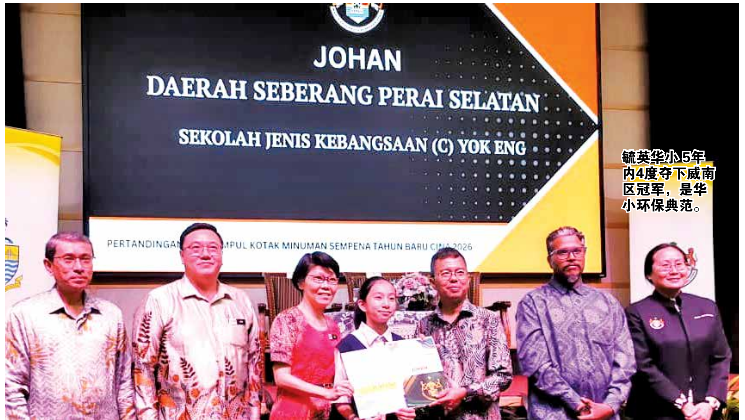
毓英华小5年内4度夺下威南区冠军，是华小环保典范。

“我们不是鼓励学生多喝饮料，只是平日或佳节期间，喝了之后不要随意乱丢，而是收集起来，绝非为了比赛而刻意多喝饮料。”