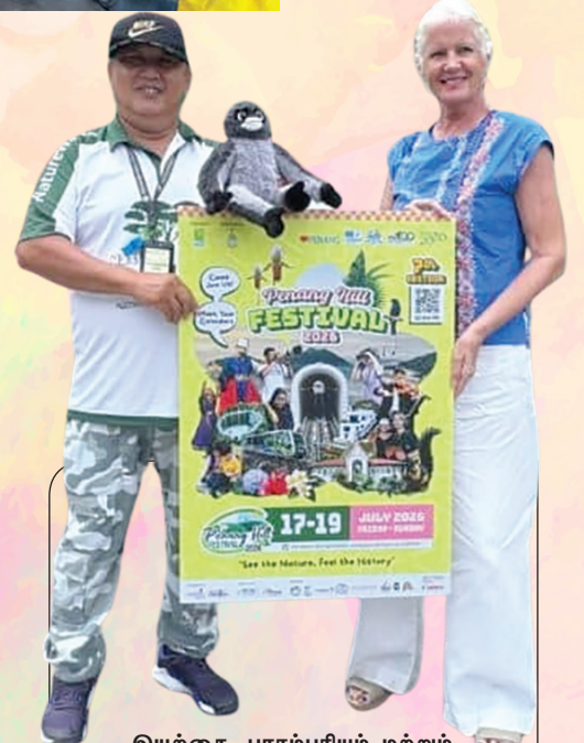
இயற்கை, பாரம்பரியம் மற்றும் கல்வி சார்ந்த விழிப்புணர்வுகளை ஒருங்கிணைக்கும் நிகழ்ச்சியாக, 2026-ஆம் ஆண்டு நடைபெறவுள்ள 7-வது பினாங்கு கொடிமலை விழா (PHF) திகழ்கிறது.