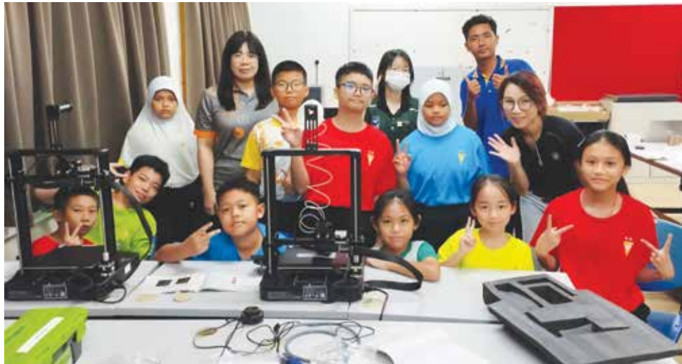
MAKERLAB menjadi platform pemangkin inovasi dalam kalangan pelajar sekolah. (Ihsan: Penang Science Cluster ).

membabitkan pra-Akademi Dalam Industri (ADI) pada peringkat menengah atas, pelajar Tingkatan Empat dan Lima dengan tempoh pelaksanaan selama dua tahun yang mengintegrasikan silibus Standard Kemahiran Pekerjaan Kebangsaan (NOSS) serta pengiktirafan daripada Jabatan Pembangunan Kemahiran (JPK),” katanya.