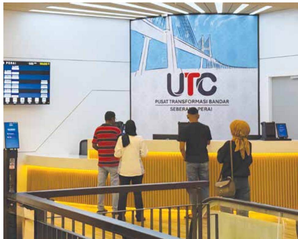
UTC Seberang Perai terus menjadi pemudah cara kepada rakyat dalam mengakses pelbagai perkhidmatan kerajaan di bawah satu bumbung.

Dalam perkembangan sama, Siew Khim yang juga ADUN Sungai Pinang turut memaklumkan bahawa kadar