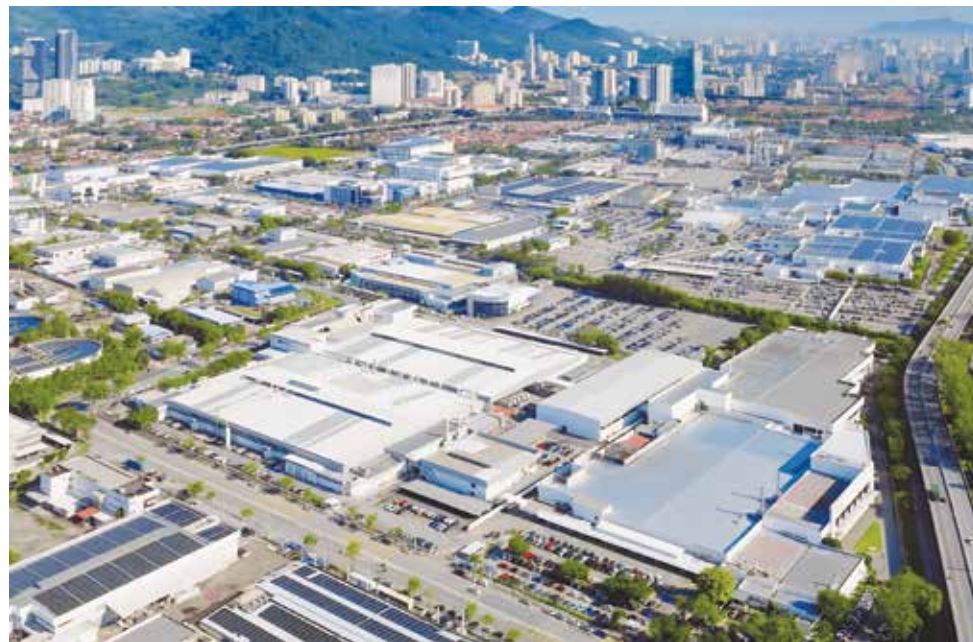
INDUSTRI digalakkan mengadaptasi teknologi, automasi dan tenaga solar bagi mengurangkan kebergantungan kepada bahan api.

(FREPENCA), Federation of Malaysian Manufacturers (FMM) , Small and Medium Enterprises Association (SAMENTA) serta Association of Malaysian Medical Industries (AMMI) .