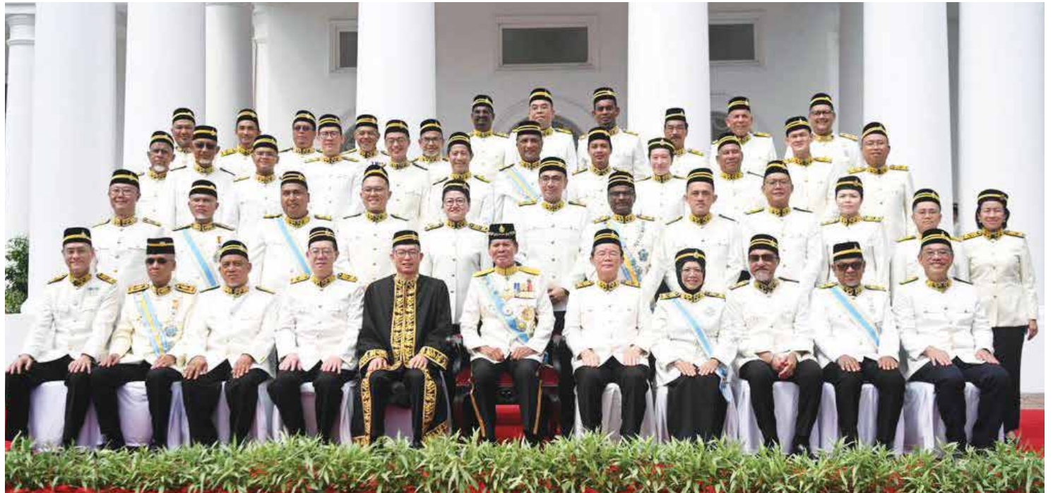
BARISAN kepimpinan Kerajaan Negeri Pulau Pinang bergambar kenang-kenangan bersama Tun Ramli Ngah Talib (duduk, tengah) selepas istiadat perasmian Mesyuarat Pertama Penggal Keempat Dewan Undangan Negeri Pulau Pinang Ke-15 di sini baru-baru ini.

Beliau berkata demikian ketika menyampaikan ucapan perasmian Mesyuarat Pertama Penggal Keempat