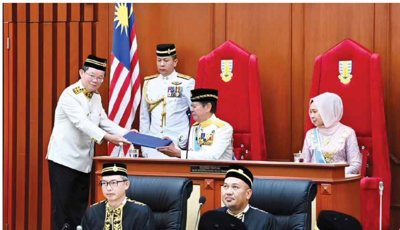
KETUA Menteri menyerahkan teks ucapan perasmian kepada Yang Dipertua Negeri, Tuan Yang Terutama (TYT) Tun Ramli Ngah Talib sempena Mesyuarat Pertama Penggal Keempat Dewan Undangan Negeri Ke-15 yang berlangsung di sini pada 8 Mei lalu.

“Keadaan ini menunjukkan amalan disiplin fiskal yang berterusan dalam memastikan setiap ringgit dibelanjakan secara terkawal dan berhemah bagi memastikan kelestarian baki akaun negeri,” ujarnya pada Mesyuarat Pertama Penggal Keempat Dewan Undangan Negeri Pulau Pinang Yang