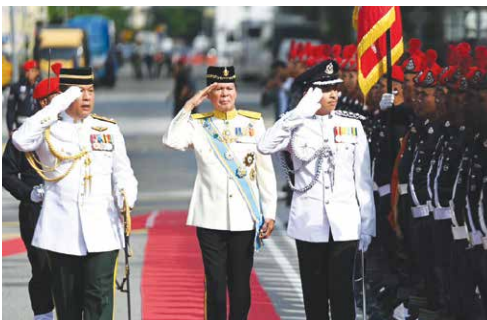
TUN Ramli Ngah Talib (tengah) menyempurnakan istiadat kawalan kehormat sempena perasmian Mesyuarat Pertama Penggal Keempat Dewan Undangan Negeri Pulau Pinang Ke-15 pada 8 Mei lalu.

“Kita harus sentiasa mengingatkan diri bahawa tutur kata yang tidak wajar boleh membawa kesan negatif,” pesannya sebelum mengakhiri ucapan.