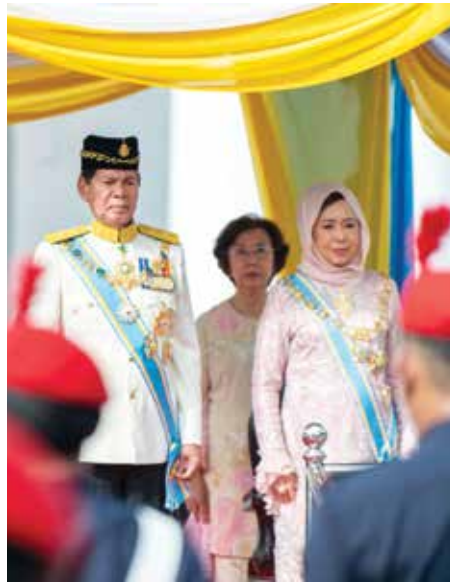
槟州元首敦南利达立日前为州议会主持开幕，旁为夫人杜潘诺拉阿希金。

要由电子与电气（E&E）产业带动；服务业则录得约412亿2000万令吉，其中以资讯与通讯科技（ICT）子领域贡献最为显著。