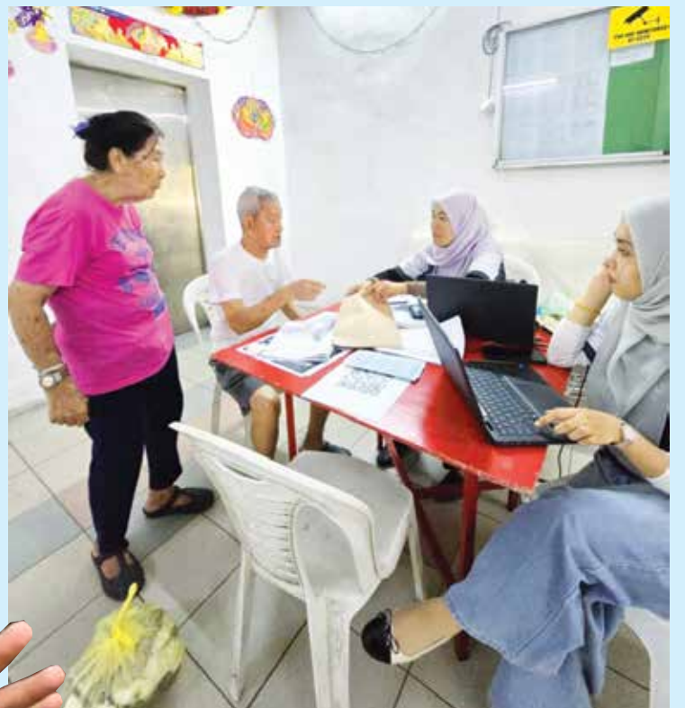
东北县土地局职耐心为长者解释所面对问题。

他呼吁民众善用流动柜台服务，尤其是处理地税及分层地税相关事务，并提醒民众携带身份证件