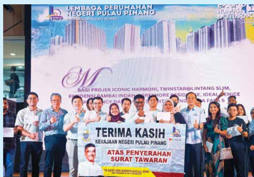
槟州政府积极协助人民居者有其屋。

他说，任何涉及稀土的开采建议，都不会仓促批准，特别是涉及森林保留地、环境敏感区、水源及高价值农业地时，必须经过环境影响评估（EIA）及严格技术审核。