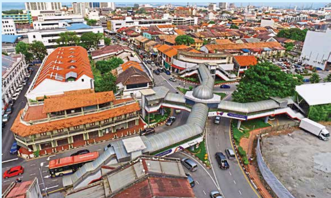
地税检讨可重组土地税务制度及其更现代化，图为槟岛市区。

曹观友补充，自2024年以来，州政府已处理232宗延长租赁地契申请，显示州政府持续协助租赁地地主保障土