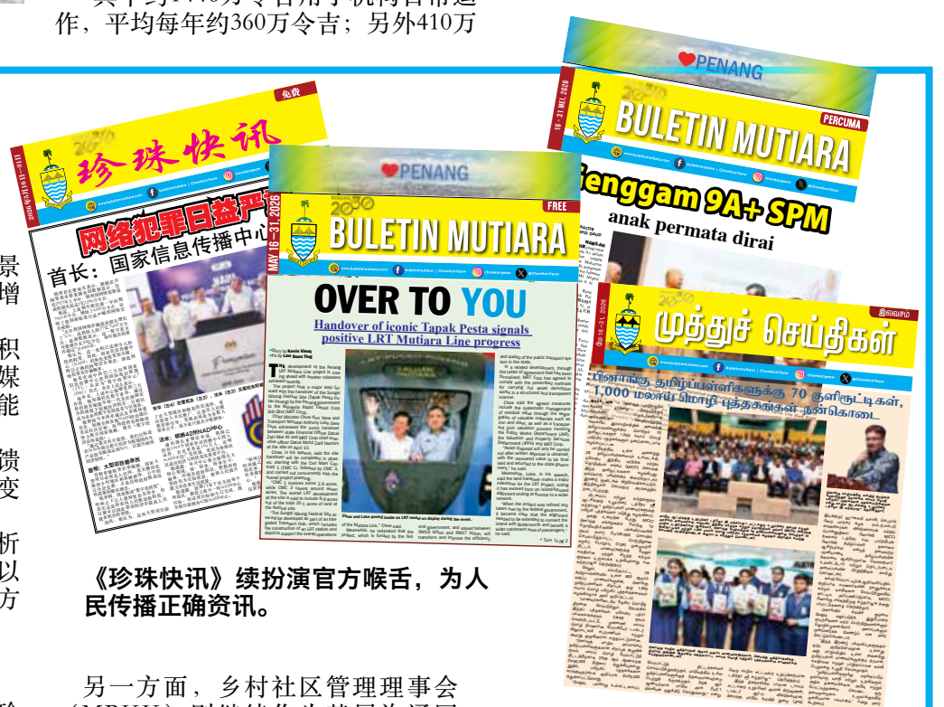
《珍珠快讯》续扮演官方喉舌, 为人民传播正确资讯。

此外, 他说, 州政府官方媒体《珍珠快讯》 (Buletin Mutiara) 继续扮演重要角色, 为人民提供正确、可靠及具权威性的资讯, 同时协助遏止假新闻及不实消息传播。