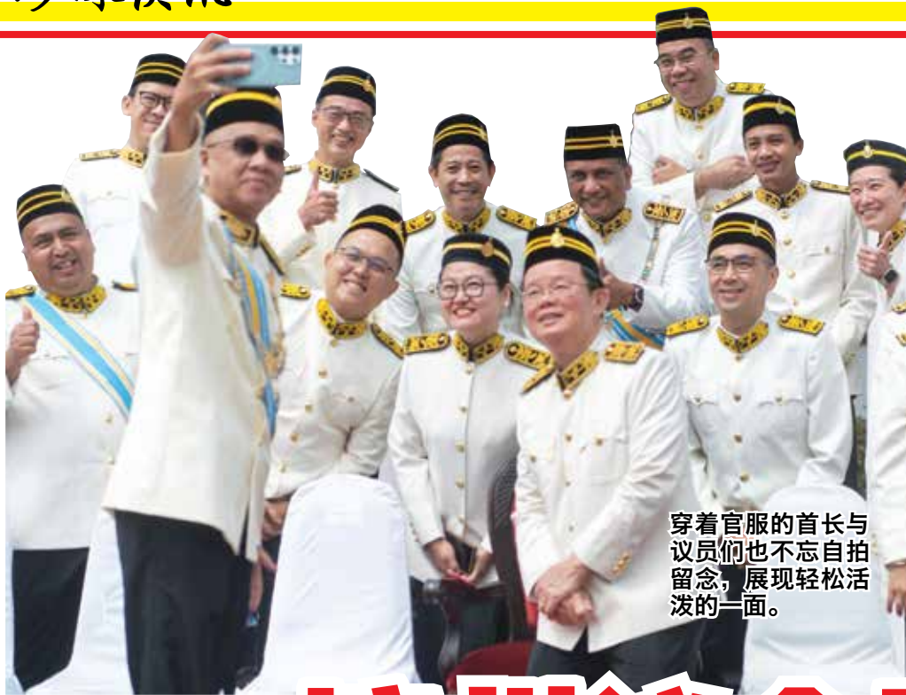
穿着官服的首长与议员们也不忘自拍留念，展现轻松活泼的一面。