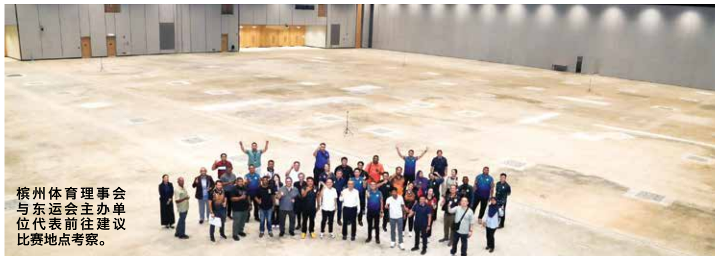
槟州体育理事会与东运会主办单位代表前往建议比赛地点考察。