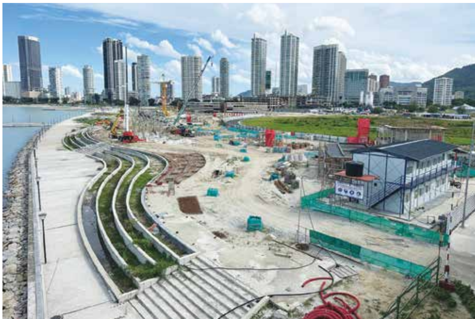
葛尼湾小贩中心工程预计2027年首季竣工。