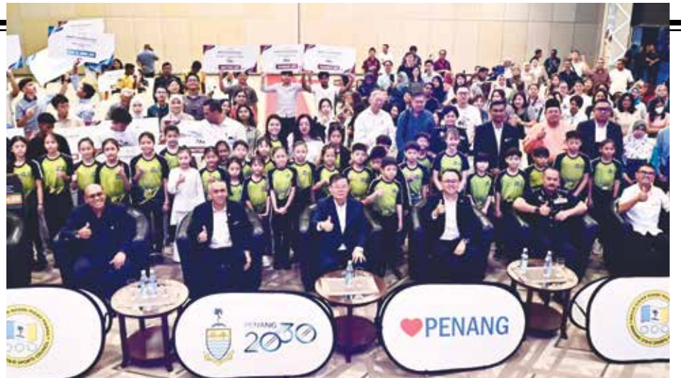
槟州政府有信心办好明年东运会, 运动员也摩拳擦掌准备大展身手!

无论如何, 他说, 州政府目前正积极争取赞助, 并与相关单位保持配合, 因为宣传及市场推广工作等仍需遵循既定条规。