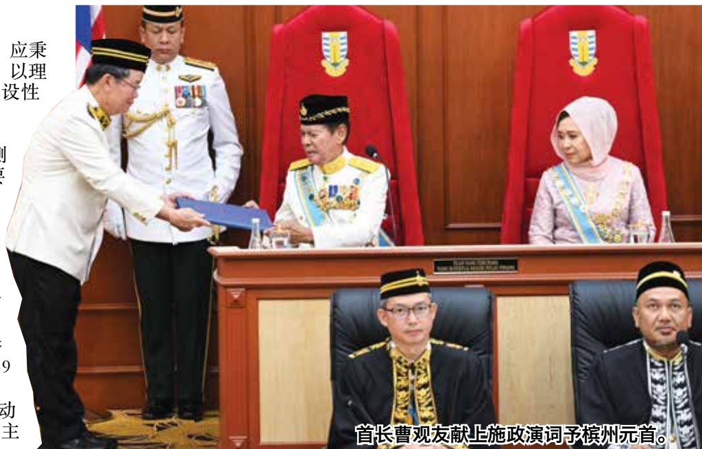
首长曹观友献上施政演词予槟州元首。

阁下强调，这些成果充分体现槟城投资生态体系的竞争力与稳定性，并持续获得国内外投资者的信赖，进一步巩固其作为国家经济增长重要引擎的地位。