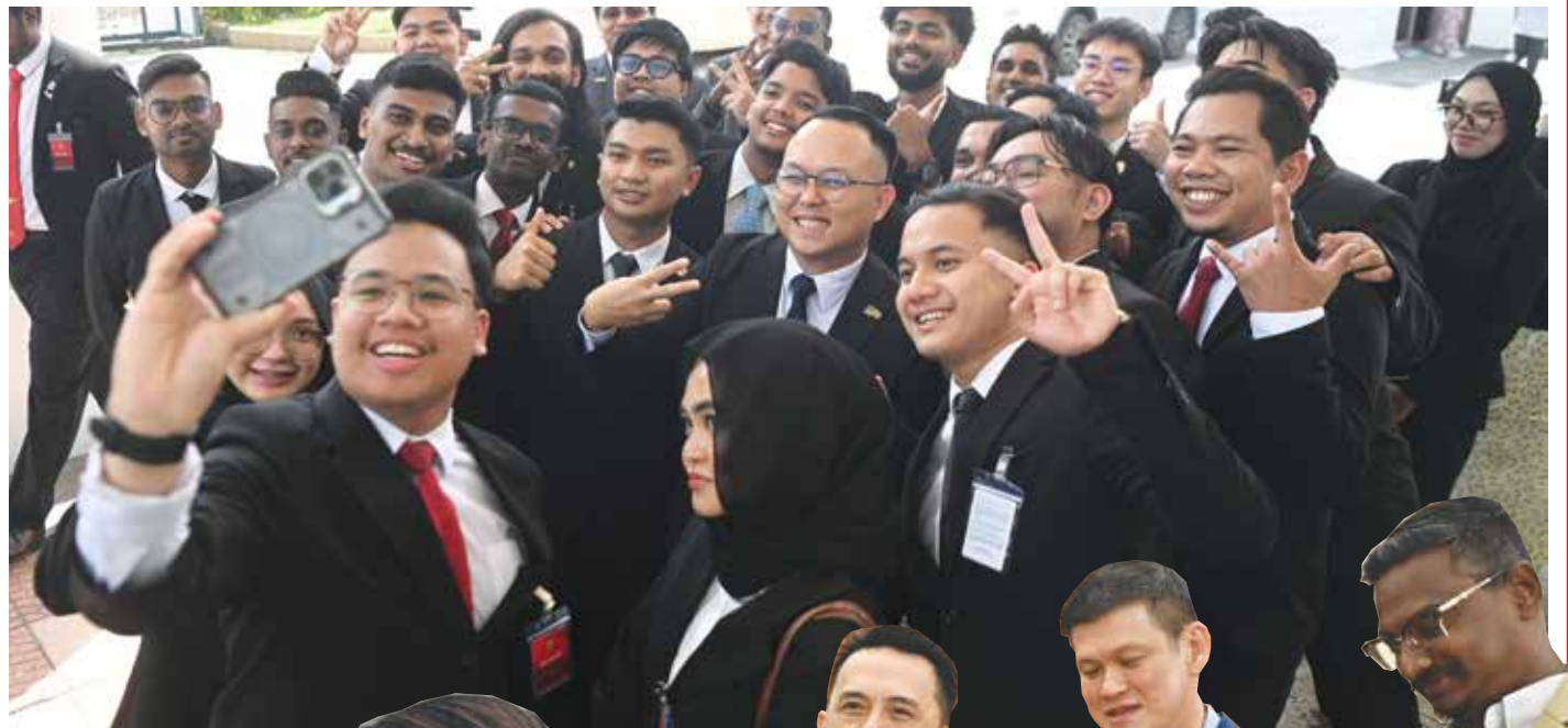
学生代表前来参观议会和交流，魏子森展现其亲和力，与众人打成一片。

与此同时，不少议员也善用休息时段或会议空档，与助理及官员进行简短会议，讨论跟进事务，确保公务推进不耽误。在庄严与效率并行之下，本次议会也展现出务实与活力并存的一面。