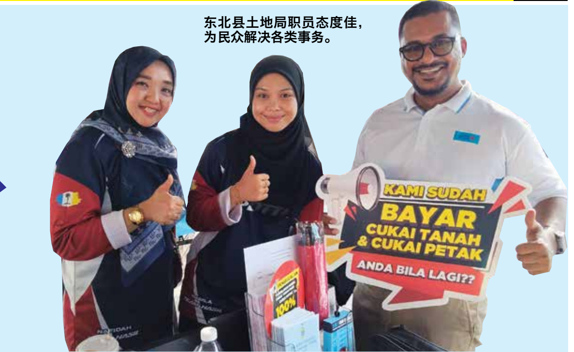
东北县土地局职员态度佳，为民众解决各类事务。