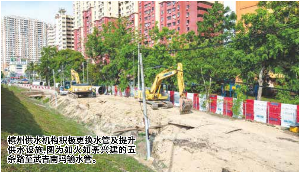
槟州供水机构积极更换水管及提升供水设施, 图为如火如荼兴建的五条路至武吉南玛输水管。

他强调, 水资源是槟州经济与人民生活的重要资产, 必须被珍惜及避免浪费同时, 当局也需要新水费机制, 以