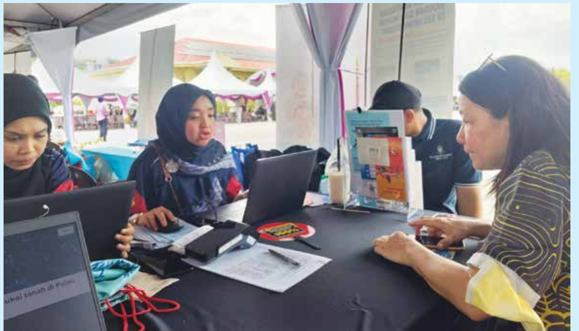
有了流动柜台，民众方便多了。

地址，并受理2026年度土地税减免投诉与上诉申请，让民众无需特地前往光大办公室，便能在社区内完成多项事务。