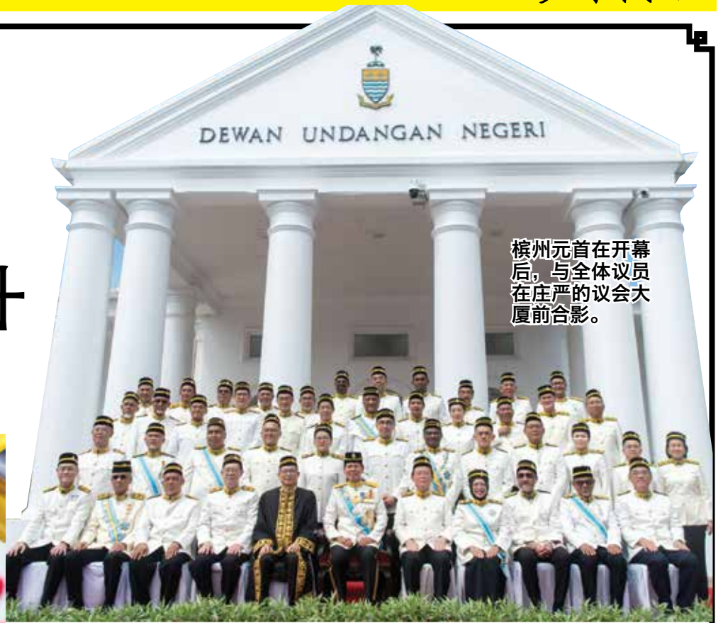
槟州元首在开幕后，与全体议员在庄严的议会大厦前合影。