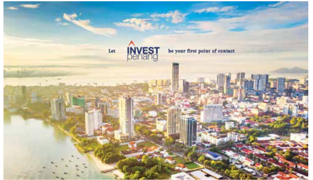
投资槟城机构为引资做出巨大贡献。

另一方面, 他强调, 州政府严正看待国家审计局针对投资槟城提出的治理建议, 并视之为持续加强机构治理、廉