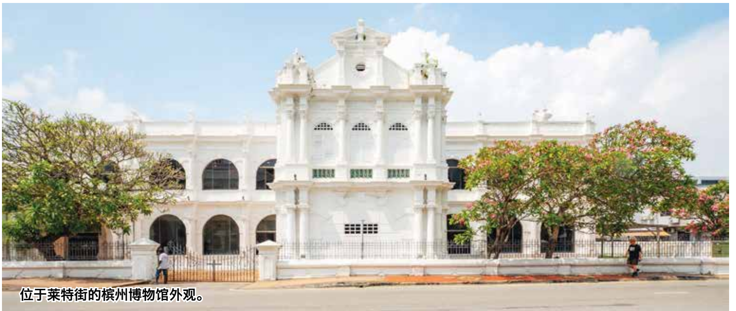
位于莱特街的槟州博物馆外观。

新法令也拟增设执法部门，赋予授权官员足够权力，依法展开调查和执法行动，包括进入场所、扣押、充公及访问电子数据的权力，以应对数字化藏品及电子档案管理等新挑战。