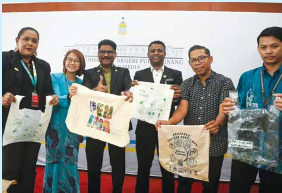
截至目前，“No Single-Use Plastic”运动已免费派发约5万5000个环保袋。

“如今很多民众车里都会放环保袋，这已逐渐成为一种习惯。未来民众可将湿货装入环保替代塑料袋后，再放入环保袋中携带。”