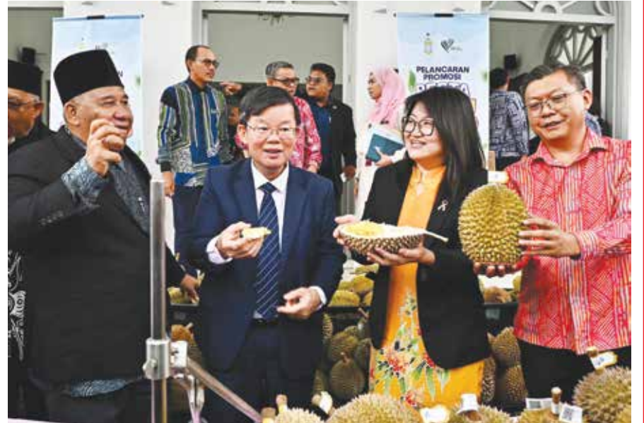
州议会最后一天，趁着午休时刻，大伙在议会外共享榴梿飨宴。