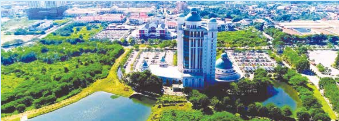
州政府是经过2年研究与咨询后才实施地税检讨，并非仓促行事。

他强调，这项做法符合州政府一贯坚持的审慎财政管理原则，即确保每一项收入都获得最佳运用，以维持州财政稳定，同时不加重人民负担。