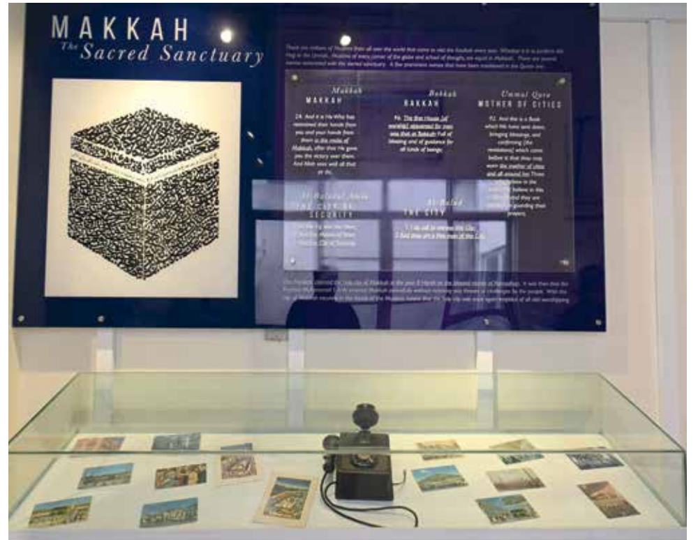
ANTARA gambar lama Mekah yang menjadi koleksi di sini.