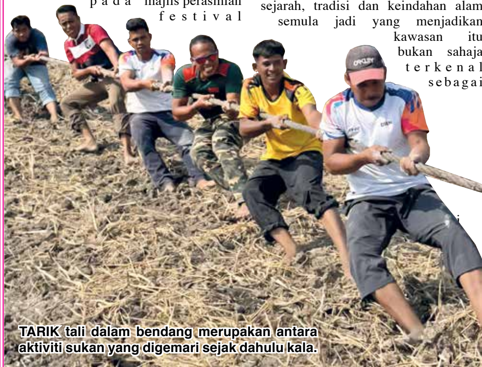
TARIK tali dalam bendang merupakan antara aktiviti sukan yang digemari sejak dahulu kala.

Sebelum itu, Kon Yeow sambil diiringi Rashidi dan barisan tetamu kehormat menyaksikan pertandingan tarik tali akhir dan pertandingan memancing sebelum menyempurnakan acara simbolik perasmian penutup dengan melepaskan wau yang dihasilkan oleh penduduk setempat.