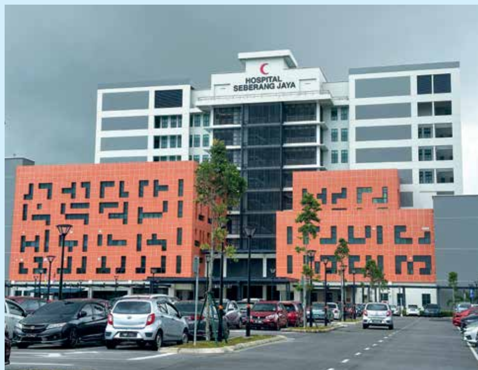
HOSPITAL Seberang Jaya telah mula beroperasi di bangunan baharu sejak 5 Mei 2025.

"Ini kerana projek dan program yang selari dengan aspirasi Visi Penang2030 dan Malaysia Madani akan terus menjadi fokus utama, bagi membina sistem kesihatan yang