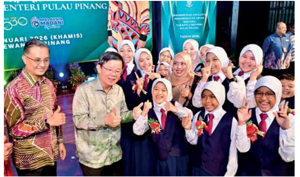
PARA murid dari Sekolah Kebangsaan Kongsi, Balik Pulau tidak melepaskan peluang merakam gambar kenangan bersama Ketua Menteri (dua dari kiri) pada Majlis Perhimpunan Anggota Perkhidmatan Awam di sini baru-baru ini.