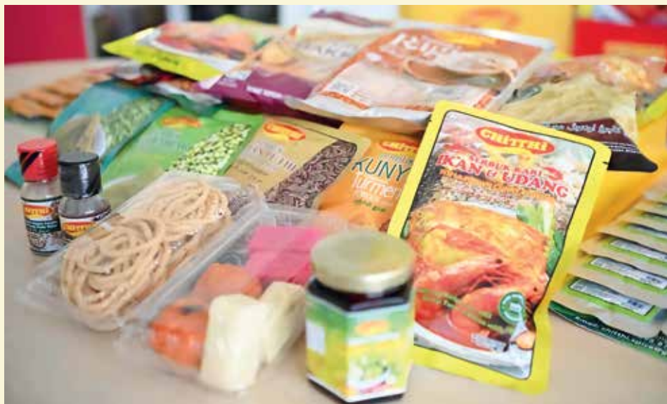
ANTARA rempah ratus keluaran Chitthi Spice yang berada di pasaran.

Ganga Devi turut mengalu-alukan individu yang berminat untuk menjadi ejen jualan, khususnya suri rumah dan ibu tunggal, untuk menghubungi syarikat bagi mendapatkan maklumat lanjut mengenai peluang tersebut.