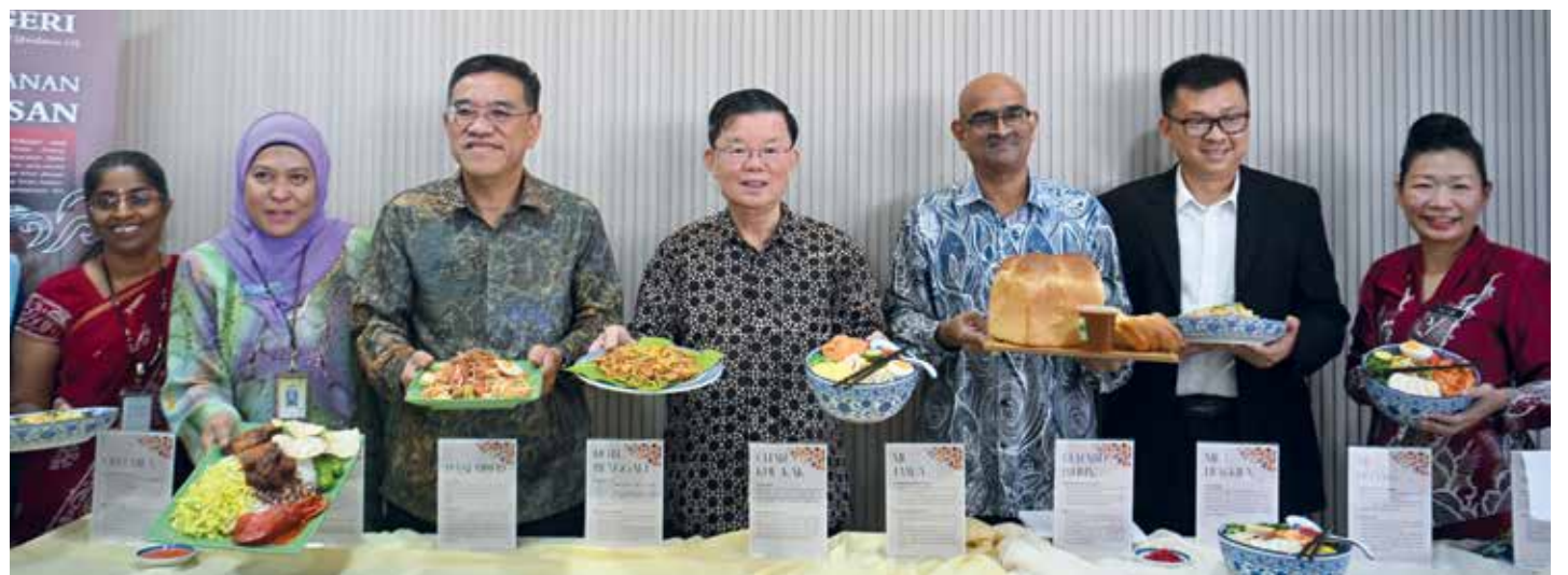
KETUA Menteri bersama-sama barisan pimpinan Kerajaan Negeri dan ahli Jawatankuasa Pakar Warisan Kebudayaan Tidak Ketara menunjukkan item - item yang bakal diwartakan usai sidang media di sini.

“Kesemua 16 item berkenaan akan diperkenalkan secara rasmi kepada orang ramai menerusi program Kenduri Warisan bersempena Perisytiharan