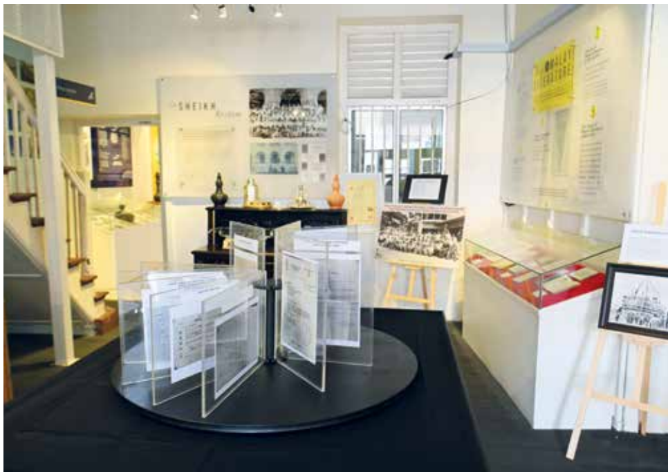
ANTARA koleksi yang terdapat di Galeri Haji Pulau Pinang.

“Bahan-bahan pameran ini juga pernah dipamerkan di Universiti Teknologi Mara (UiTM) Permatang Pauh dari 2 hingga 26 Disember 2025