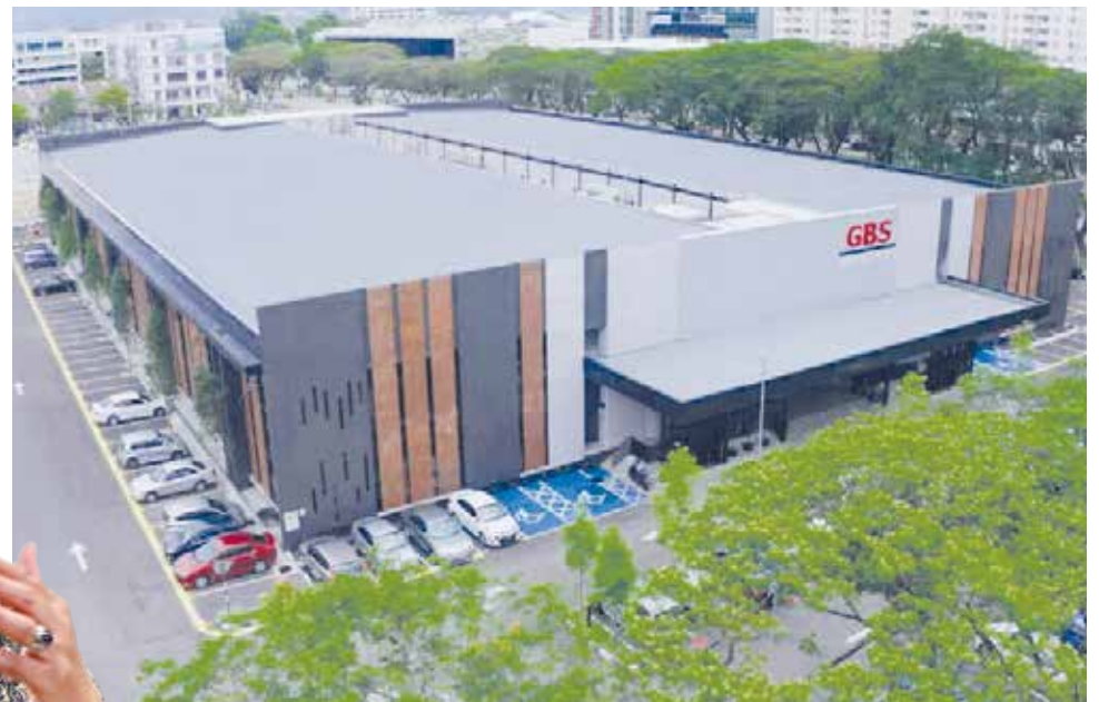
GBS @Mayang di Bayan Baru merupakan hab perkhidmatan perniagaan global yang menempatkan syarikat-syarikat multinasional terkemuka.

Rancangan Malaysia Ke-12 (RMK-12) serta Visi Penang2030,” katanya.