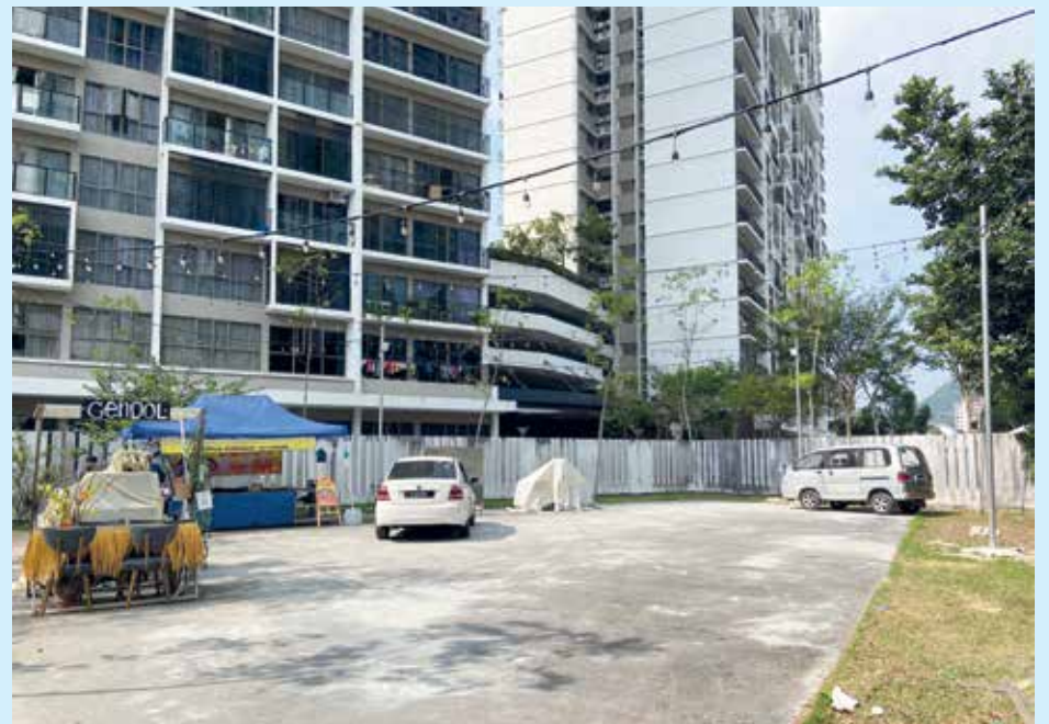
TAPAK perniagaan yang disediakan oleh MBPP di kawasan lapang berhampiran Persiaran Relau di sini.