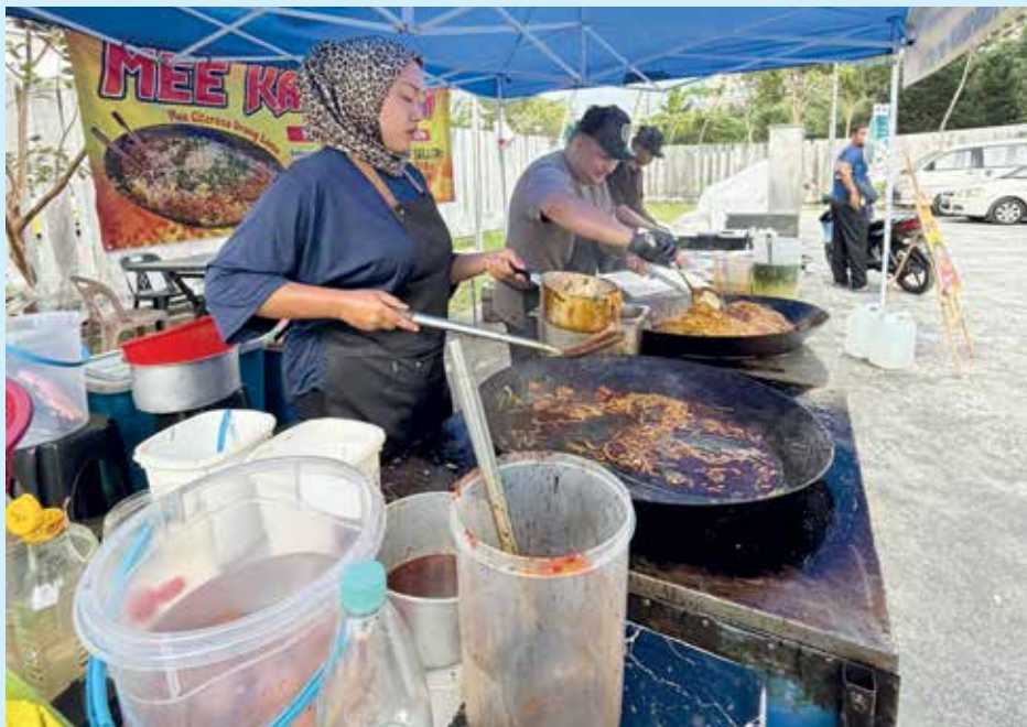
SALAH satu perniagaan kuetiau yang sudah memulakan perniagaan di Lintang Sungai Ara dan mampu menerima pelanggan hasil promosi di media sosial.

Justeru, beliau amat berharap agar penjaja tanpa lesen tampil bagi membolehkan MBPP membantu mereka melalui proses pemutihan.