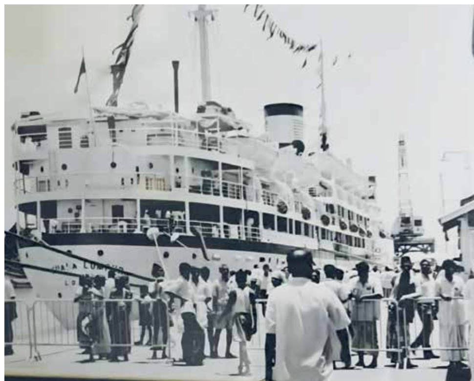
GAMBAR lama menunjukkan suasana di pelabuhan ketika musim pelayaran untuk menunaikan ibadah haji.

“Penemuan ini bukan sahaja memperluas peta sejarah haji Pulau Pinang, malah membuktikan bahawa Seberang Perai turut memainkan peranan signifikan dalam ekosistem pengurusan haji suatu ketika dahulu,” katanya kepada wartawan Buletin Mutiara, SUNARTI YUSOFF dan jurugambar, MUHAMMAD IQBAL HAMDAN ketika ditemui sempena wawancara khas di Galeri Haji Pulau Pinang, Lebuh