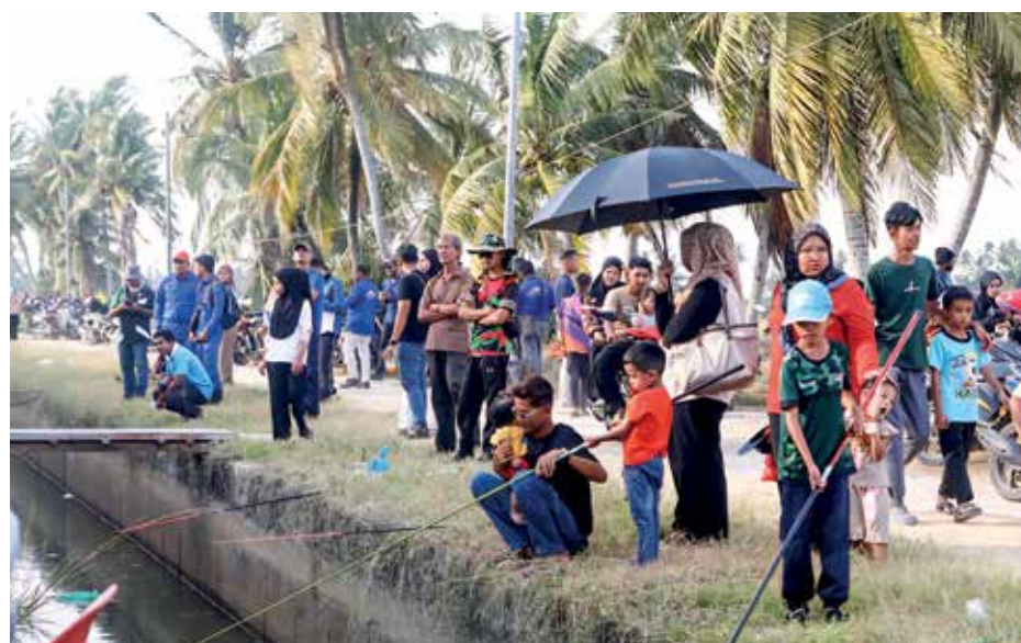
AKTIVITI memancing di tali air antara tarikan yang mendapat sambutan pada penganjuran Penang2030 Festival x Pesta WOW di sini baru-baru ini.

Mengulas lanjut, Kon Yeow menyatakan bahawa Sungai Aceh merupakan kawasan yang kaya dengan sejarah, tradisi dan keindahan alam semula jadi yang menjadikan kawasan itu bukan sahaja terkenal sebagai