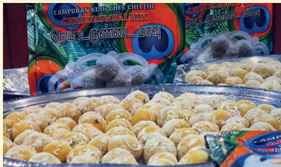
CAMPURAN kuah ghee merupakan salah satu produk keluaran Chitthi Spice yang mendapat sambutan ramai.

Chitthi Spice menggunakan resipi campuran rempah tradisional India Selatan yang diolah semula mengikut cita rasa tempatan dan antarabangsa.