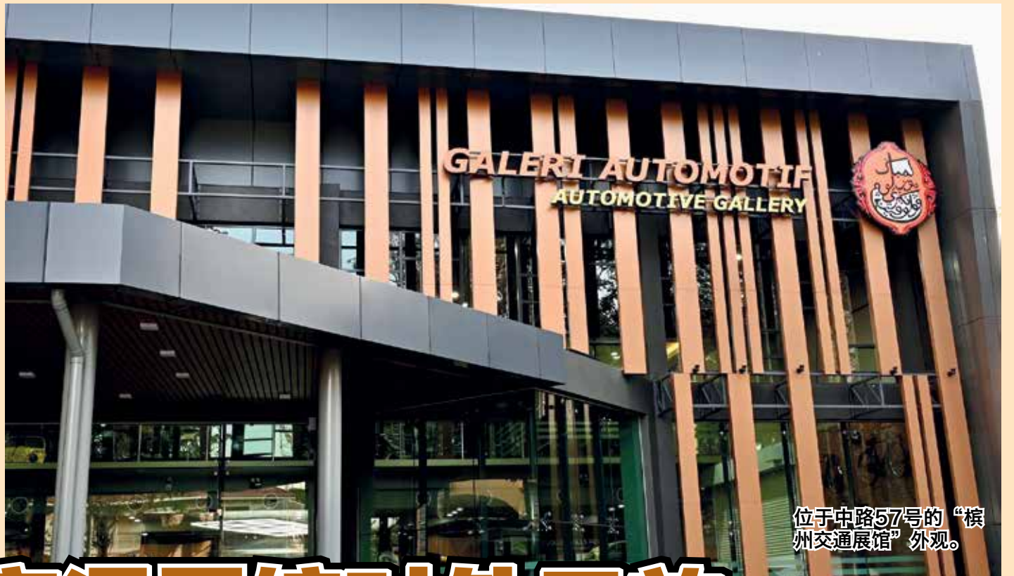
位于中路57号的“槟州交通展馆”外观。

首长指出，这展馆的建设费用约700万令吉，包括展品修复等工程，所有经费皆来自槟州政府拨款。