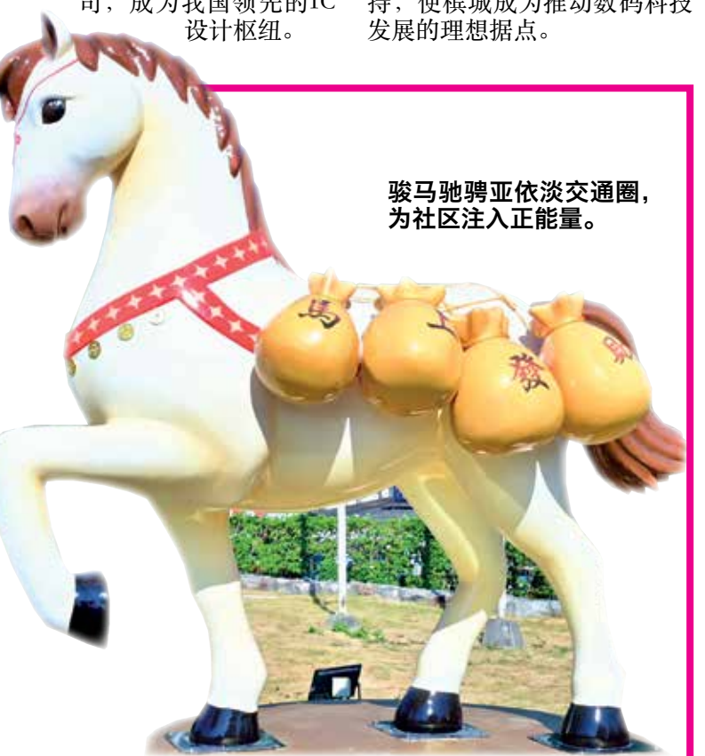
骏马驰骋亚依淡交通圈, 为社区注入正能量。