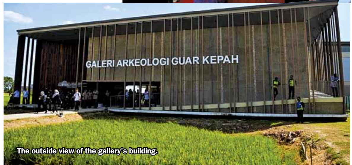
The outside view of the gallery's building.