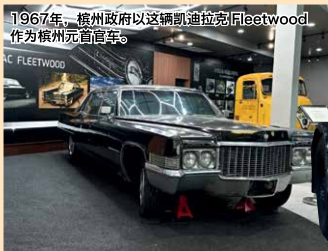
1967年，槟州政府以这辆凯迪拉克 Fleetwood 作为槟州元首官车。