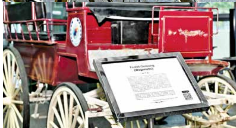
Something most of us would not be familiar with - a 'Pedati Gerbong' (Wagonette) can also be seen at the gallery.