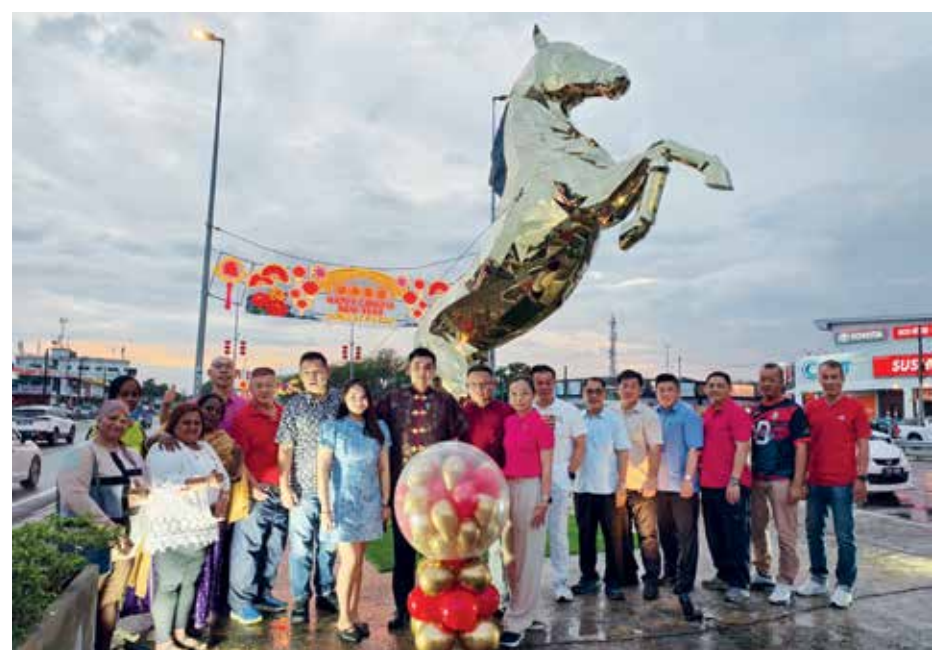
一只昂首蹄跃的金马新春装饰，给大家带来满满的力量。

他冀望随着马年，众人可以“蹄疾步稳，共筑新高”为目标，进一步提升社区服务品质，凝聚力量，打造更加繁荣、和谐、文化蓬勃发展的