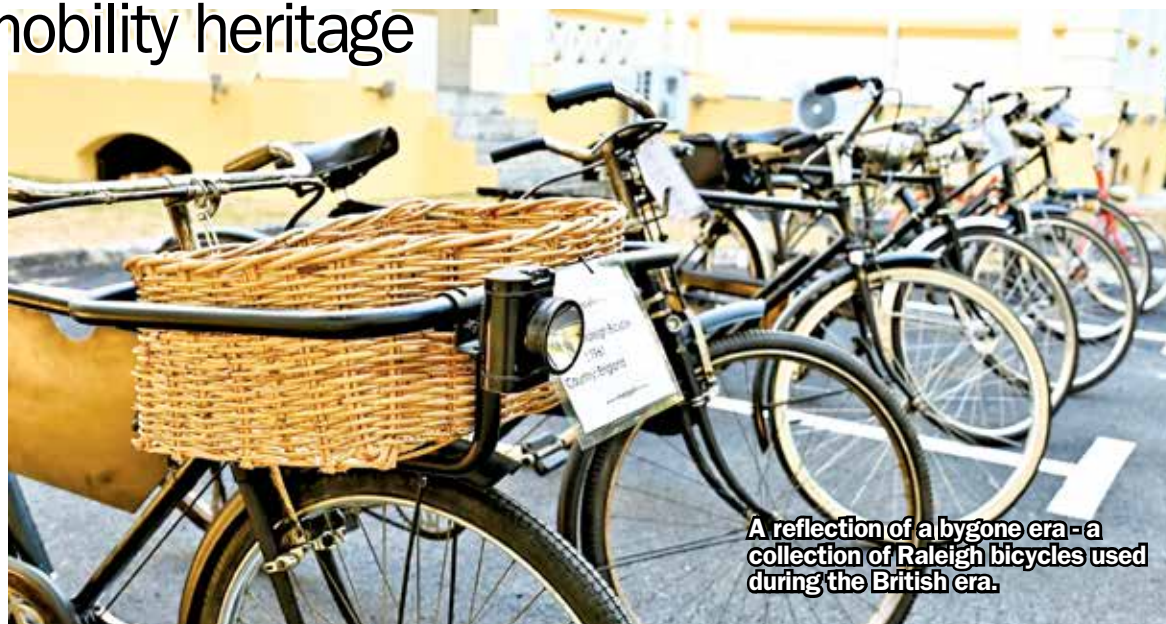
A reflection of a bygone era - a collection of Raleigh bicycles used during the British era.

Chief Minister Chow Kon Yeow, who officiated the opening ceremony recently, said the establishment of the automotive gallery represents a long-term strategic investment by the Penang government in heritage preservation, education and socio-