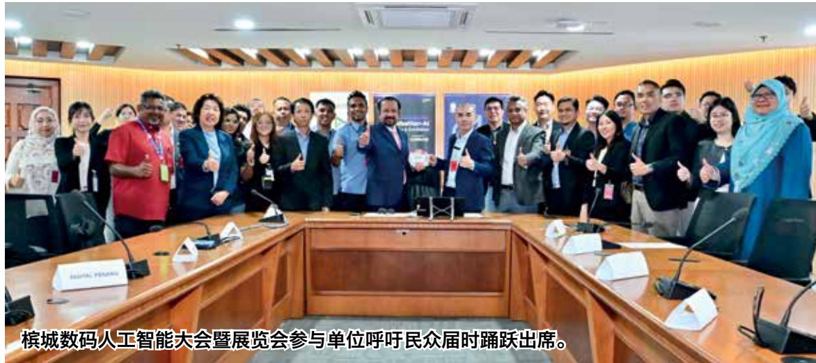
槟城数码人工智能大会暨展览会参与单位呼吁民众届时踊跃出席。

2026年槟城数码人工智能大会暨展览会 (PDX 2026) 将于7月15日至16日, 在槟城国际会展中心 (Setia SPICE Convention Centre) 盛大举行。