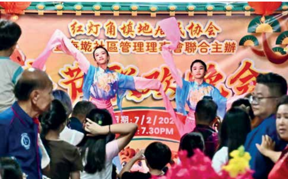
主办单位安排丰富精彩节目，让居民开心度过晚会。