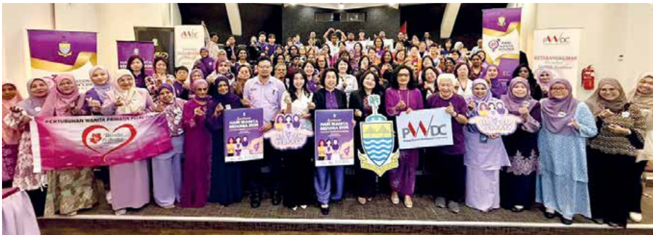
2026年槟州国际妇女节庆典，将于3月31日，在威省市政厅举行。

她强调，无论时公司、组织、个人或男性女性，当女性获得赋权时，家庭与社区、州和国家都将从中受益。