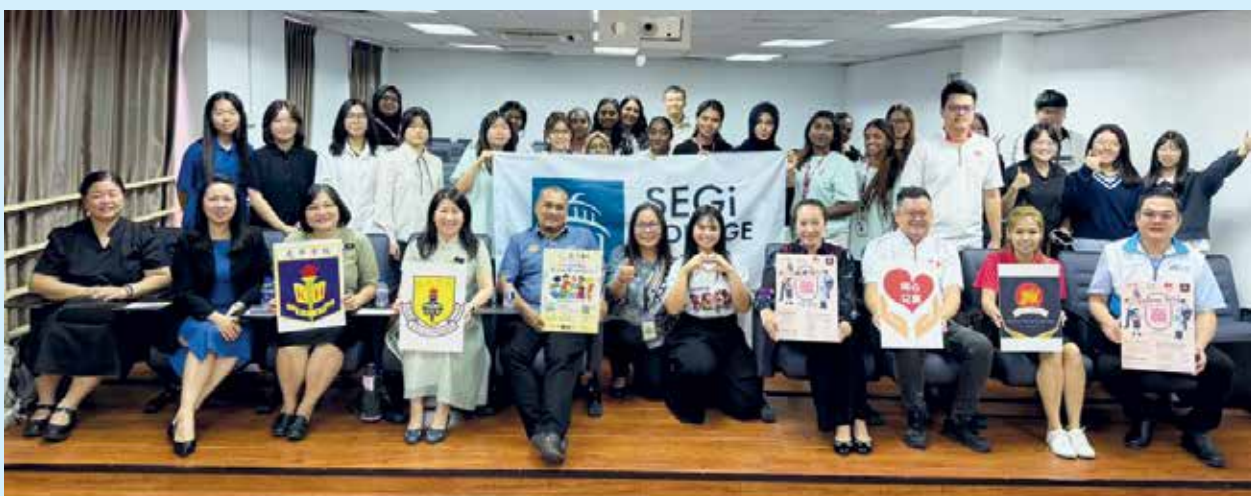
一众嘉宾呼吁大众踊跃参与“Penang Seed 慈善义走”。

Penang SEED 主席李音娜表示，透过“学术导师计划（AMeP）”，Penang SEED 持续为 B40 群体学生提供免费的学业辅导与软技能培训，协助他们建