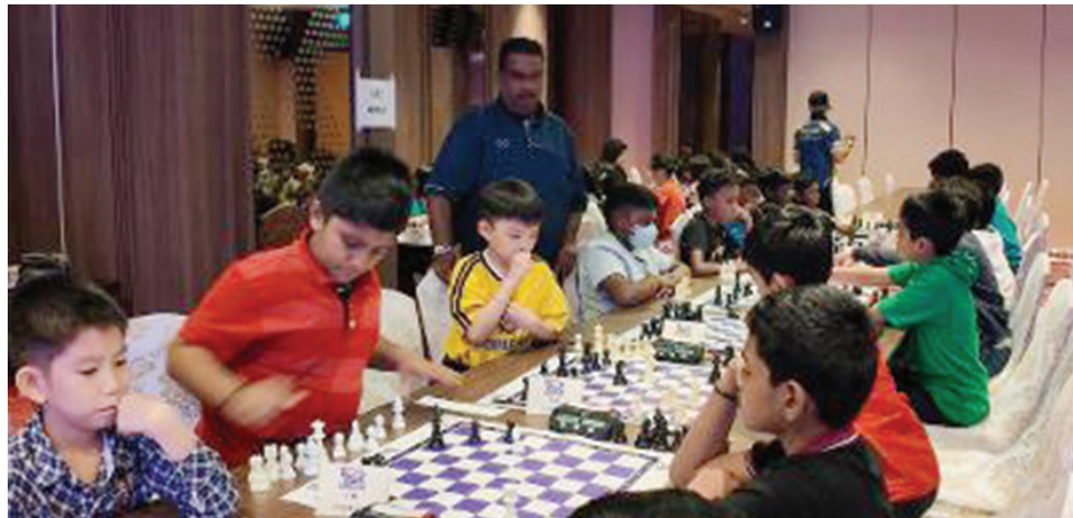
சதுரங்கப் போட்டியில் மாணவர்கள் திறமையை வெளிகாட்டினர்.