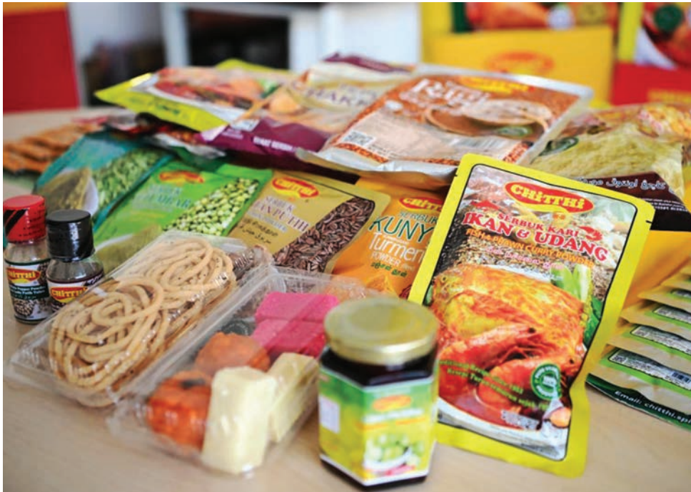
சித்தி நிறுவன தயாரிப்புப் பட்டியலில் கிட்டத்தட்ட 60 வகையான மசாலா மற்றும் மசாலா பொடிகளாகவும், மாவு சார்ந்த பொருட்கள், மூலிகை பானங்கள் மற்றும் இந்தியப் பலகார வகைகள் உட்பட சுமார் 40 தொடர்புடைய சில தயாரிப்புகளைப் படத்தில் காணலாம்.

மேலும், விற்பனை முகவர்களாக ஆக ஆர்வமுள்ள நபர்களுக்கு, குறிப்பாக மகளிர் மற்றும் தனித்து வாழும் தாய்மார்கள், நேரடியாக நிறுவனத்தை தொடர்பு கொண்டு செயல்முறை விபரங்கள் பெற்றுக் கொள்ள கங்கா தேவி வரவேற்கிறார்.