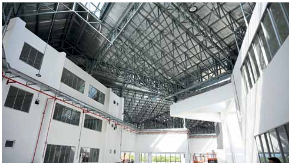
建筑进度已达至95%，明年开课在望。

露，他本身是一名英校生，但太太及孩子们都受华文教育，因此，他一直以来都在家人熏陶下，对华教并不陌生。