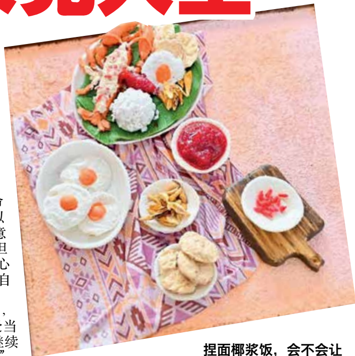
捏面椰浆饭，会不会让人不小心拿来吃？