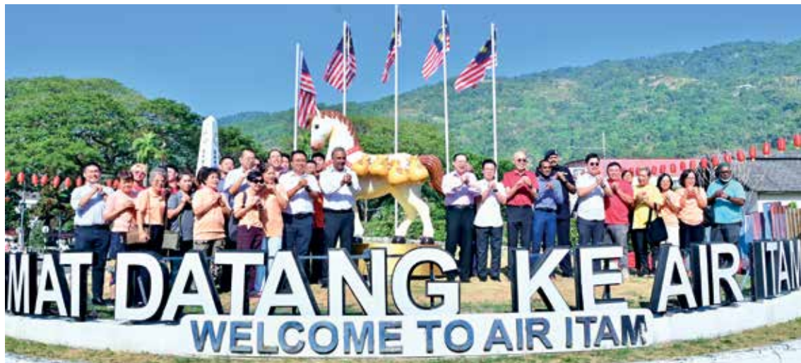
亚依淡交通圈新春装置推介礼全体嘉宾向民众拜年。

配合即将到来的农历新年, 槟城亚依淡交通圈再有新春装置, 今年以《马到福来。采财聚缘》骏马雕塑, 向路过民众拜年。