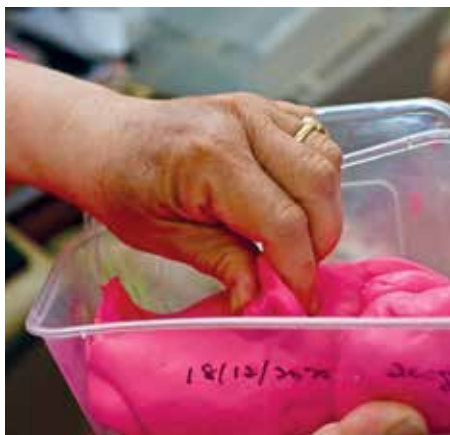
捏面材料需把色彩调得均匀。