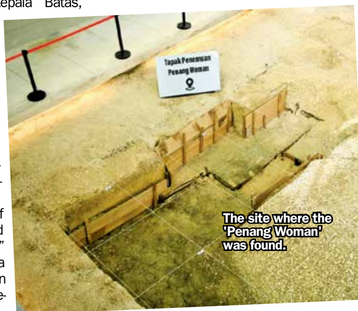
The site where the 'Penang Woman' was found.

Malaysia Plan through the Northern Corridor Economic Region (NCER), the gallery incorporates green design, interactive exhibits and digital technology, posi-