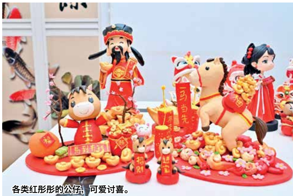
各类红彤彤的公仔，可爱讨喜。