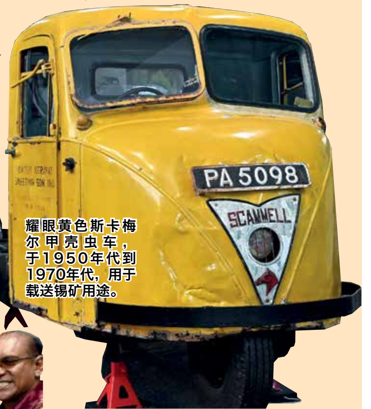
耀眼黄色斯卡梅尔甲壳虫车，于1950年代到1970年代，用于载送锡矿用途。