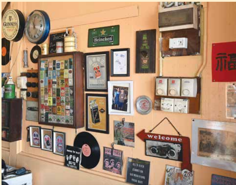
茶室内的摆设复古怀旧。