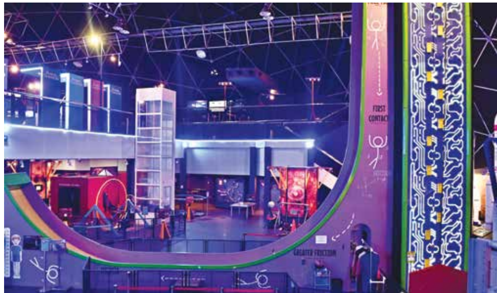
深受学生欢迎的光大圆顶科学馆，将庆祝10周年并放眼寻找新址，以配合未来扩展。

他说，目前科学馆已进入初步规划阶段，计划兴建一座更大规模及更先进的槟城科学中心。新中心预计占地至少3英亩，总建筑面积约24万平方米，设有六层楼，并涵盖屋顶及地下空间。