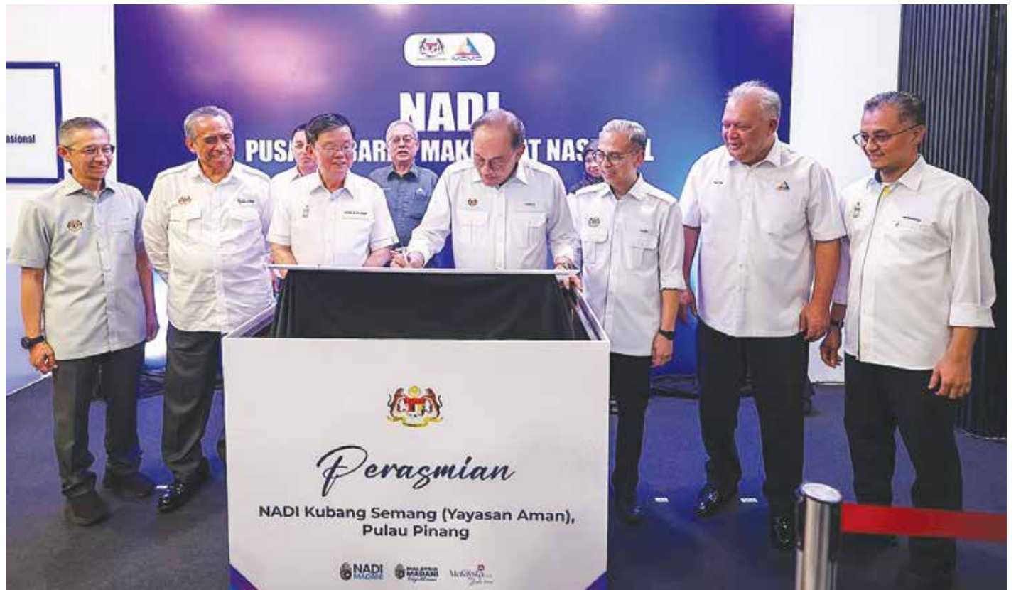
安华（左4）在曹观友（左3）、法米（右3）及莫哈末阿都哈密陪同下，为高巴三万的国家资讯传播中心主持开幕。

了在大城市精英阶层流转，更应该带入乡区推广，让基层人民被教育和引导，发展必须是为多数人带来公平，而不是只惠及少数群体。