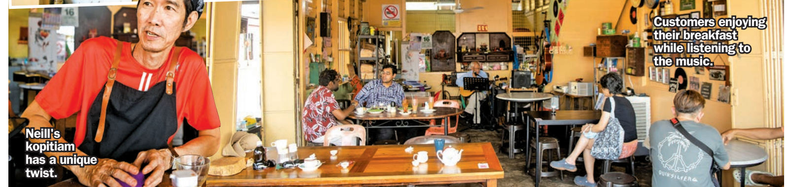
Customers enjoying their breakfast while listening to the music.