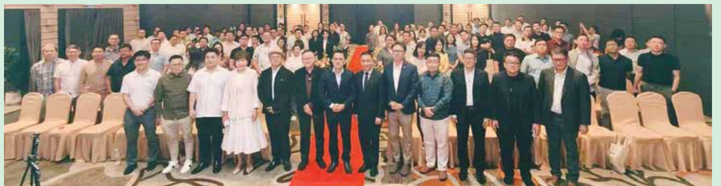
“老板，还好吗？”企业分享会全体出席者合影。