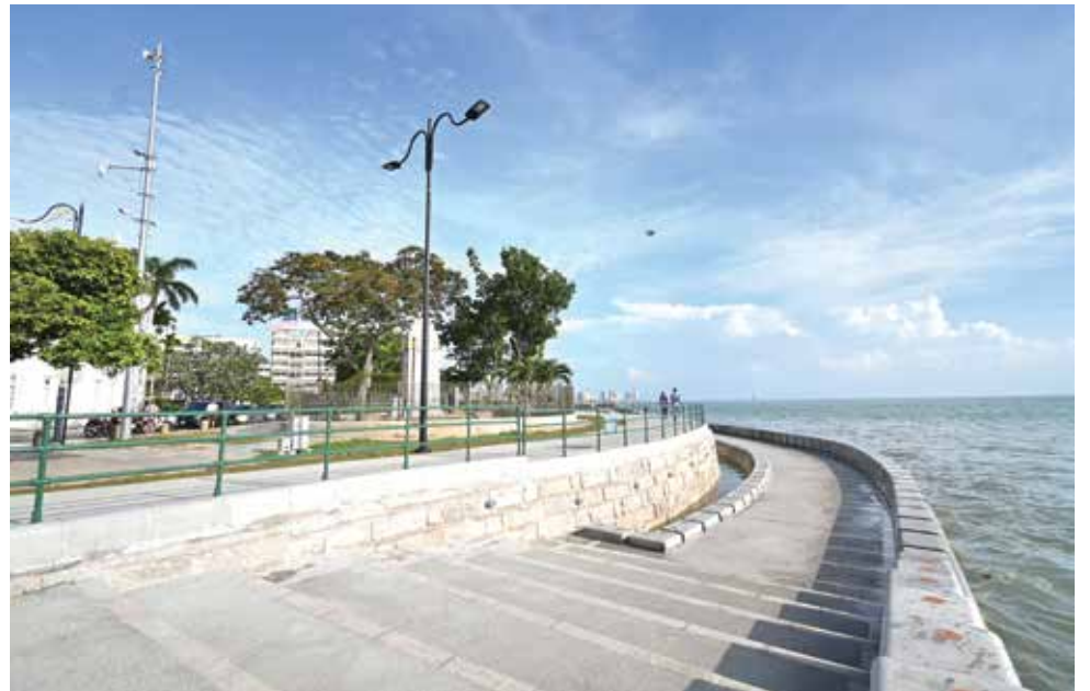
国际评审团认为，旧关仔角海堤和走道项目树立了“保育结合新设计”的全国标杆。