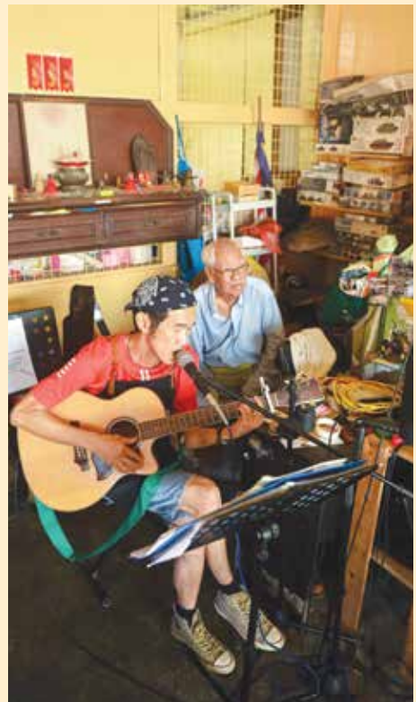
只要您喜欢唱歌和弹奏，都随时欢迎在这“小小舞台”里即兴弹唱。