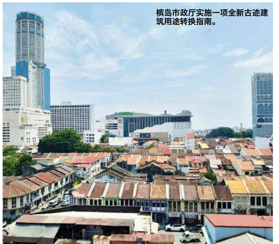
槟岛市政厅实施一项全新古迹建筑用途转换指南。