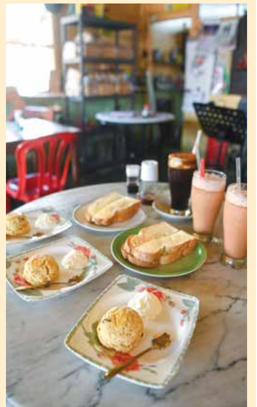
招牌咖啡搭配自制鸭蛋咖椰与牛油，还有必试店里的另一卖点“司康”。

营业时间： 8am - 1pm (周三至周五) 8am - 2pm (周六) 8:30am - 2pm (周日)