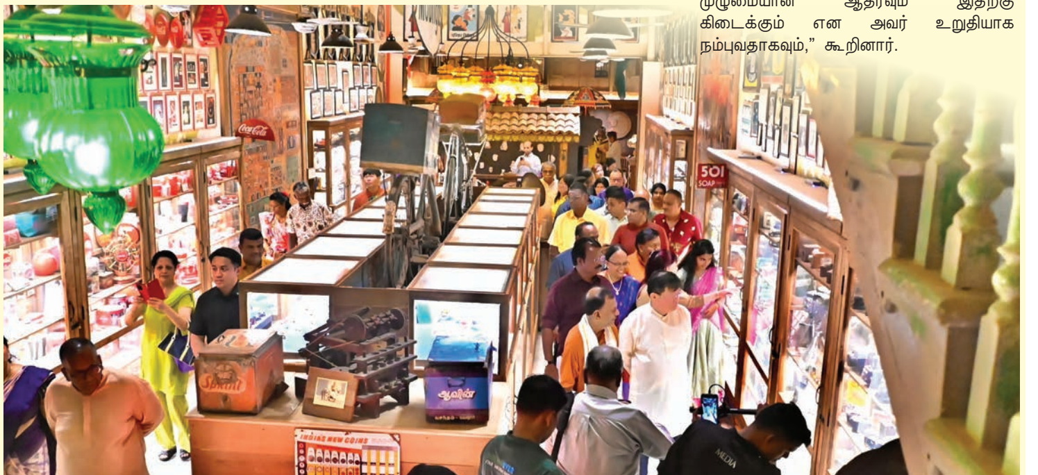
இந்திய பாரம்பரியக் கலைக்கூடம் மற்றும் பினாங்கு கலாச்சார மையம் தனது தனித்துவமான அமைப்பாலும் கலைநயத்தாலும் வருகையாளர்களை வெகுவாகக் கவர்ந்தது.

நடவடிக்கை முக்கியமானதாகும்,” என்று அவர் தெரிவித்தார்.