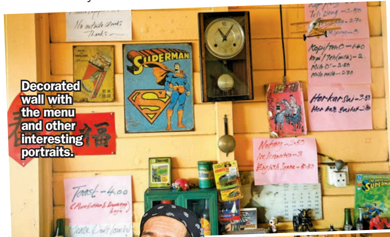
Decorated wall with the menu and other interesting portraits.

And for now, as long as the kettle keeps boiling and the guitars keep playing, the story of this 1947 kopitiam continues to unfold.