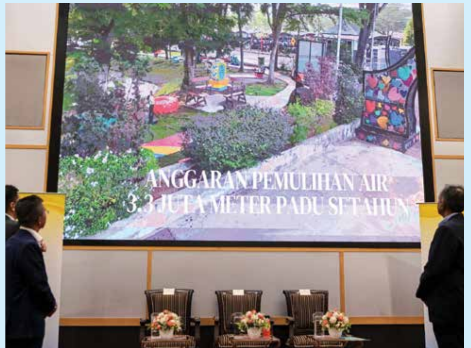
威省市厅放眼每年修复约330万立方米水量。

他说，水是支撑生活、经济及生态平衡的重要资源，惟当前却面对多重挑战，如污染、气候变化及洁净水源