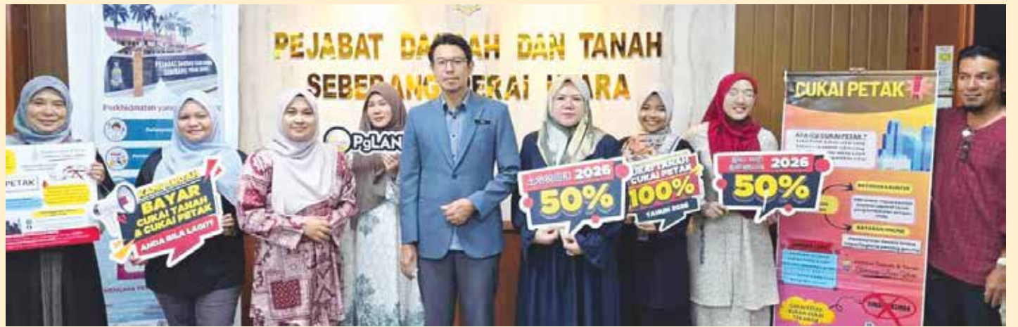
威北县土地局团队主动走入社区, 推动公共服务亲民化, 中为威北县长莫哈末哈菲兹。