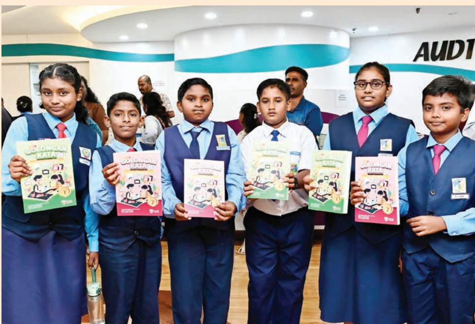
பினாங்கு மாநில தமிழ்ப்பள்ளி ஆறாம் வகுப்பு மாணவர்களுக்காக, பினாங்கு தமிழ்ப்பள்ளிகள் சிறப்புக் குழுவின் ஆதரவில் வழங்கப்பட்ட மலாய் மொழி பயிற்சிப் புத்தகங்களை மாணவர்கள் பெற்றுக்கொண்டனர்.

மேம்பாட்டுத் திட்டங்களைச் செயல்படுத்துவதற்கும், மாநிலத்தில் உள்ள தமிழ்ப்பள்ளிகளுக்குத் தேவையானவற்றை பெற்றுத் தருவதற்கும், 2026 ஆம் ஆண்டிற்காக மாநில அரசு ரிம2.1 மில்லியன் ஒதுக்கீடு செய்துள்ளது," என்று