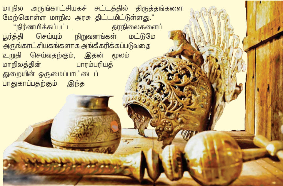
இந்திய பாரம்பரியக் கலைக்கூடம் மற்றும் பினாங்கு கலாச்சார மையத்தில் காட்சிக்கு வைக்கப்பட்டுள்ள அரிய பொருட்களைப் படத்தில் காணலாம்.

“நிர்ணயிக்கப்பட்ட தரநிலைகளைப் பூர்த்தி செய்யும் நிறுவனங்கள் மட்டுமே அருங்காட்சியகங்களாக அங்கீகரிக்கப்படுவதை உறுதி செய்வதற்கும், இதன் மூலம் மாநிலத்தின் பாரம்பரியத் துறையின் ஒருமைப்பாட்டைப் பாதுகாப்பதற்கும் இந்த