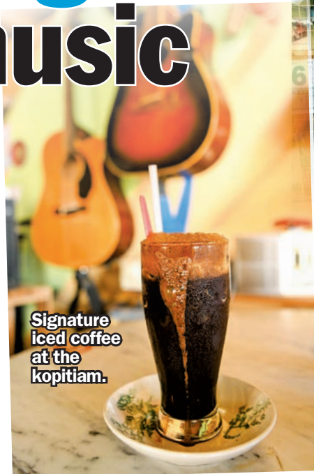
Signature iced coffee at the kopitiam.

"I came back because of Covid. Tourism stopped; there were no tours to do. So, for two years, I stayed here and helped at the shop," he said.