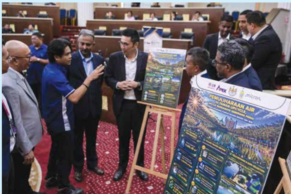
威省市厅将携手美光科技，进行水资源修复项目。