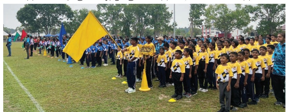
மாக் மண்டின் தமிழ்ப்பள்ளி வருடாந்திர விளையாட்டுப் போட்டியின் தொடக்க விழாவில், மாணவர்கள் உற்சாகத்துடன் அணிவகுப்பில் பங்கேற்றனர்.

மாக் மண்டின் தமிழ்ப்பள்ளி வருடாந்திர விளையாட்டுப் போட்டியின் தொடக்க விழாவில், மாணவர்கள் உற்சாகத்துடன் அணிவகுப்பில் பங்கேற்று நிகழ்ச்சியை சிறப்பித்தனர். மேலும், மாணவர்கள் சிறந்த விளையாட்டு திறனை வெளிப்படுத்தி வெற்றிப் பதக்கங்களைப் பெற்றனர்.