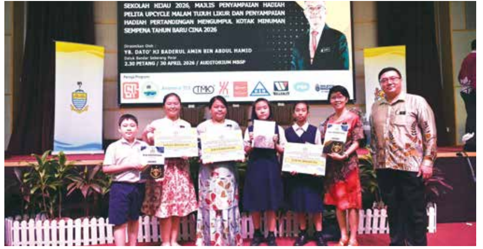
威省三县冠军学校共享喜悦。

这是一场绿意十足的活动！ 由威省市政厅主办的2026年农历新年饮料盒回收比赛成绩正式揭晓，威北甲抛峇底培育华文小学、威中新亚小学及威南毓英小学分别荣获各县冠军，各赢得奖金500令吉。