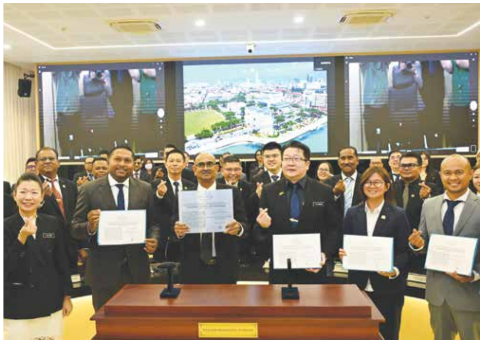
槟岛市政厅全员欣喜获得两项UNESCO保护奖的肯定。