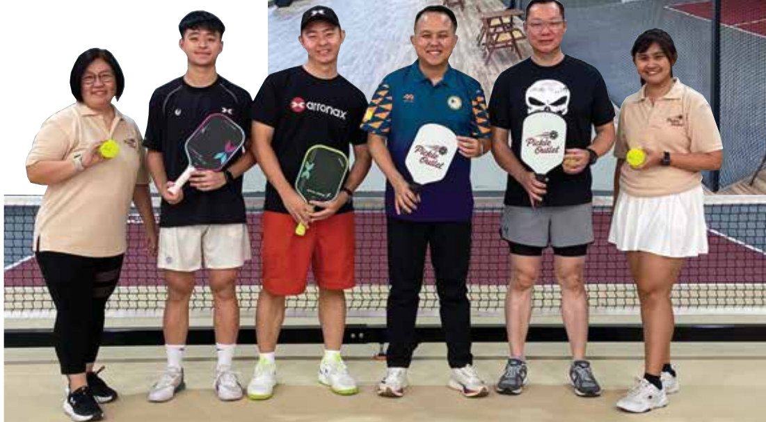
Pickle Outlet 在3月杪，邀请了槟州青年与体育行政议员魏子森（右3）主持开幕。