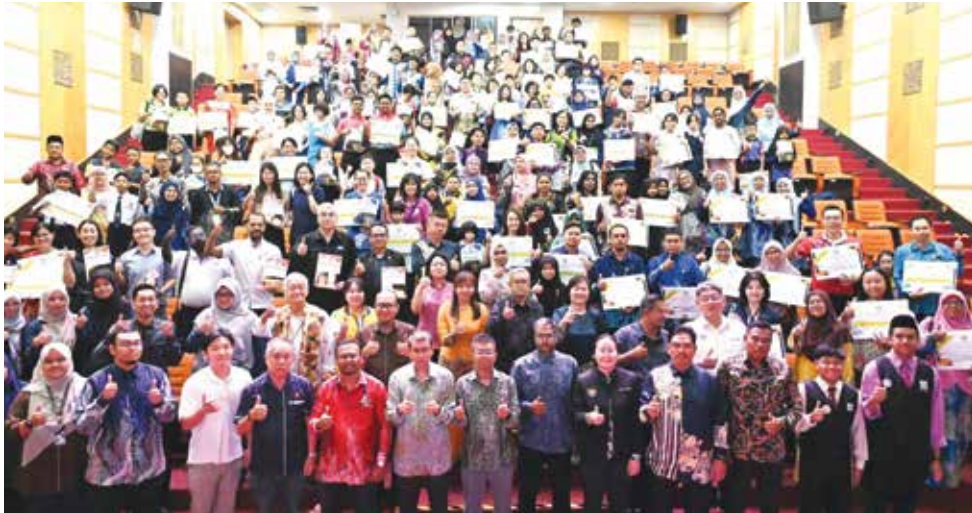
威省市厅农历新年饮料盒回收比赛及其他比赛颁奖礼全体出席者合影。