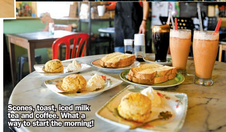
Scones, toast, iced milk tea and coffee. What a way to start the morning!